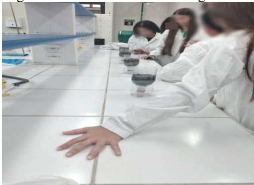
Figura 1 - Teste dos filtros com água bruta.

A atividade prática de filtração teve como foco a aplicação de métodos de separação de misturas, com destaque na filtração comum, a vácuo e a construção de filtros caseiros com materiais acessíveis. A construção dos filtros caseiros se destacou por promover um aprendizado significativo. Os estudantes foram capazes de visualizar, na prática, o funcionamento das etapas de separação, especialmente ao observar a melhora na aparência da água bruta após a filtração (Figura 1).