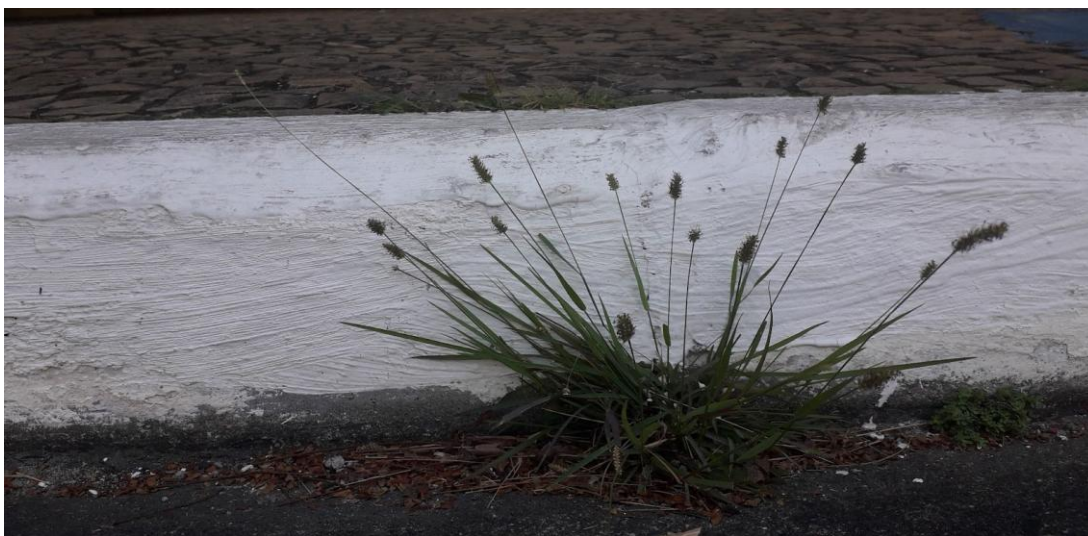
Figura 1. Pequenas plantas no meio fio.

Na tradição da representação, a paisagem é compreendida como estrutura estável, delimitada por um olhar que organiza o mundo segundo categorias fixas: identidade, pertencimento, funcionalidade. No mangá Dr. Stone , essa lógica é posta em tensão. A ciência promovida por Senku, embora inicialmente mobilize técnicas herdadas do passado em uma aparente repetição, em um mundo em ruínas encontra outros povos e faz emergir novas relações materiais. As tecnologias reaparecem como forças criadoras mas em contato com estruturas que já não se submetem facilmente à ordem anterior. As ruínas da civilização anterior diluem as fronteiras: os edifícios não delimitam mais propriedade; os muros já não separam; o pertencimento territorial se dissolve em matas que cobrem construções, mares que invadem cidades, musgos que avançam sobre monumentos. A tentativa de reconduzir a vida a fronteiras estáveis, ao que pertence, ao que é funcional, ao que é humano, mostra-se constantemente frustrada. A paisagem que se apresenta é uma paisagem em devir, na qual a diferença é produzida pelo tempo e pela matéria, e onde o gesto de delimitar é desfeito por erosão, instabilidade, recomposição.