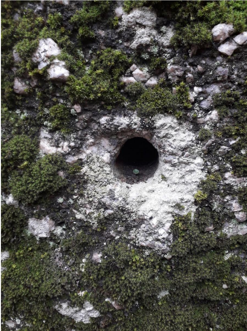
Figure 2. Uma plantinha crescendo no furo do muro.

ali. São presenças que a lógica urbana tenta apagar ou ignorar, mas que, pela insistência, se sedimentam como camadas de sentido não previstas, não reconhecidas mas reais.