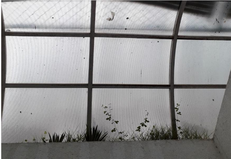
Figure 3. Uma cobertura de policarbonato com plantas crescendo junto.

Nesse sentido, as vidas menores são também formas de sensibilidade que nos ajudam a perceber as camadas profundas do tempo e do espaço, aquilo que escapa às delimitações convencionais, e que se manifesta justamente nas bordas, nas fraturas, nos resíduos. Elas são, em suma, habitantes das margens do mundo perceptível e simbólico, constituindo-se como forças que atravessam e transformam as paisagens urbanas e afetivas, convocando-nos a uma ética da atenção, do cuidado e do devir.