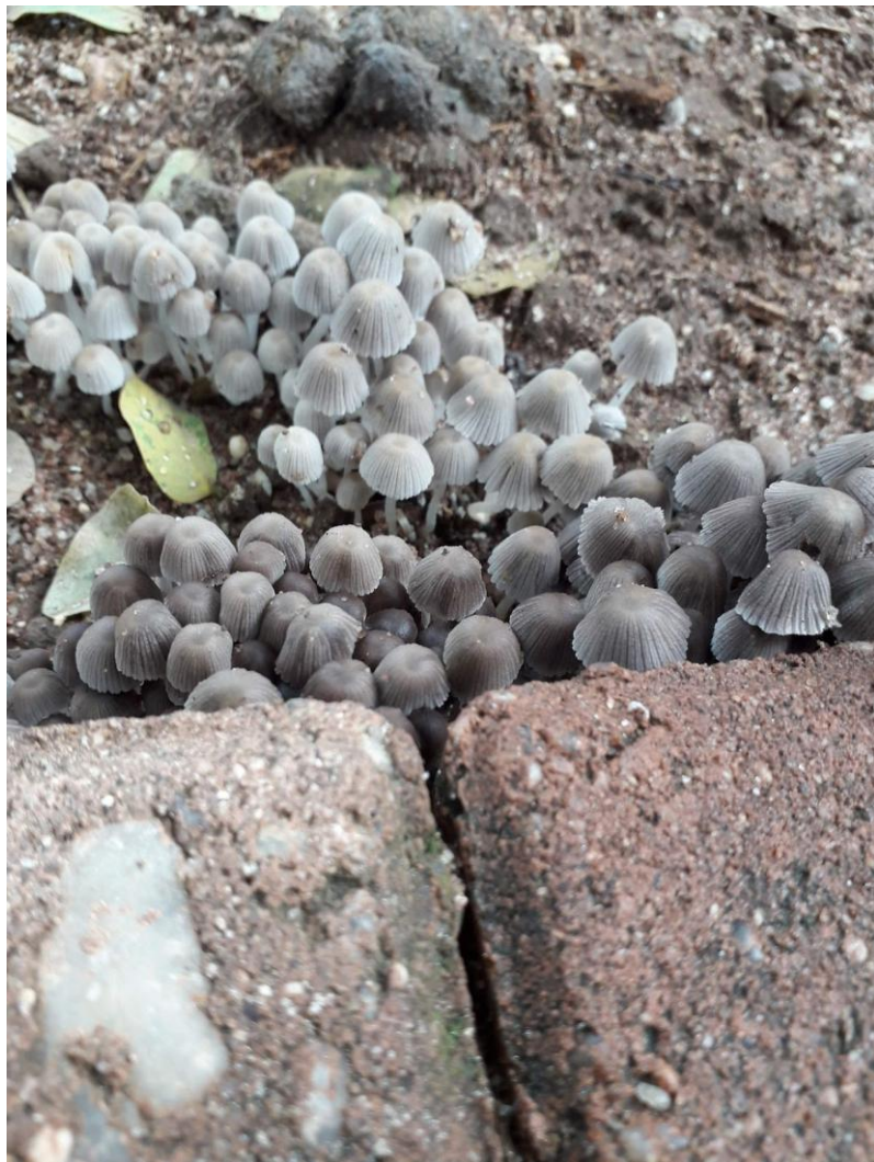
Figure 1. Um grupo de cogumelos crescendo na calçada.