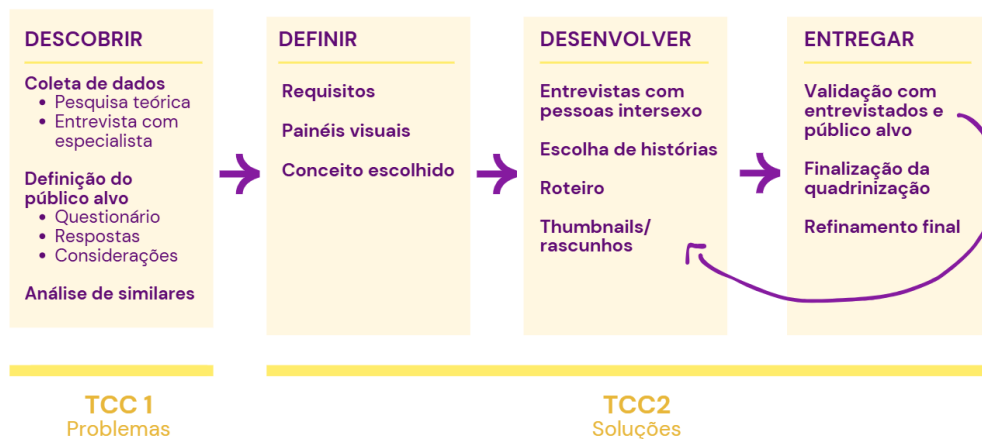
Imagem 1 – Método adaptado

Para o andamento do projeto, foram definidas 3 metodologias norteadoras para compor um método adaptado, moldado para as necessidades encontradas. Essas são o Duplo Diamante, como descrito pelo Design Council UK, Design Thinking aos moldes da IDEO, Rikke Friis Dam E Teo Yu Siang e as etapas apresentadas livro “Pequeno manual da Reportagem em Quadrinhos”, de Augusto Paim. O Duplo Diamante foi base para a estruturação das etapas, dividindo o projeto em suas 4 fases: Descobrir, Definir, Desenvolver e Entregar. A partir desse eixo, vão se subdividindo categorias menores a partir de conceitos de Design Thinking e as etapas propostas por Augusto Paim em seu livro “Pequeno manual da reportagem em Quadrinhos”, como mostrado na imagem 1.