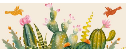
Quadro 7 – Aula 4