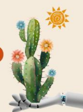
Quadro 4 – Aula 1