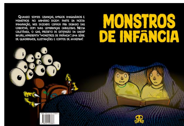
Imagem 4 – Capa da coletânea Monstros de Infância