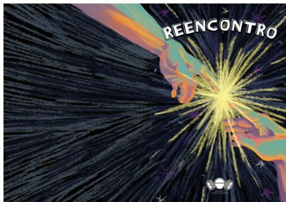
Imagem 3 – Capa da coletânea Reencontro