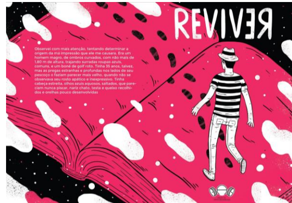
Imagem 2 – Capa da coletânea Reviver