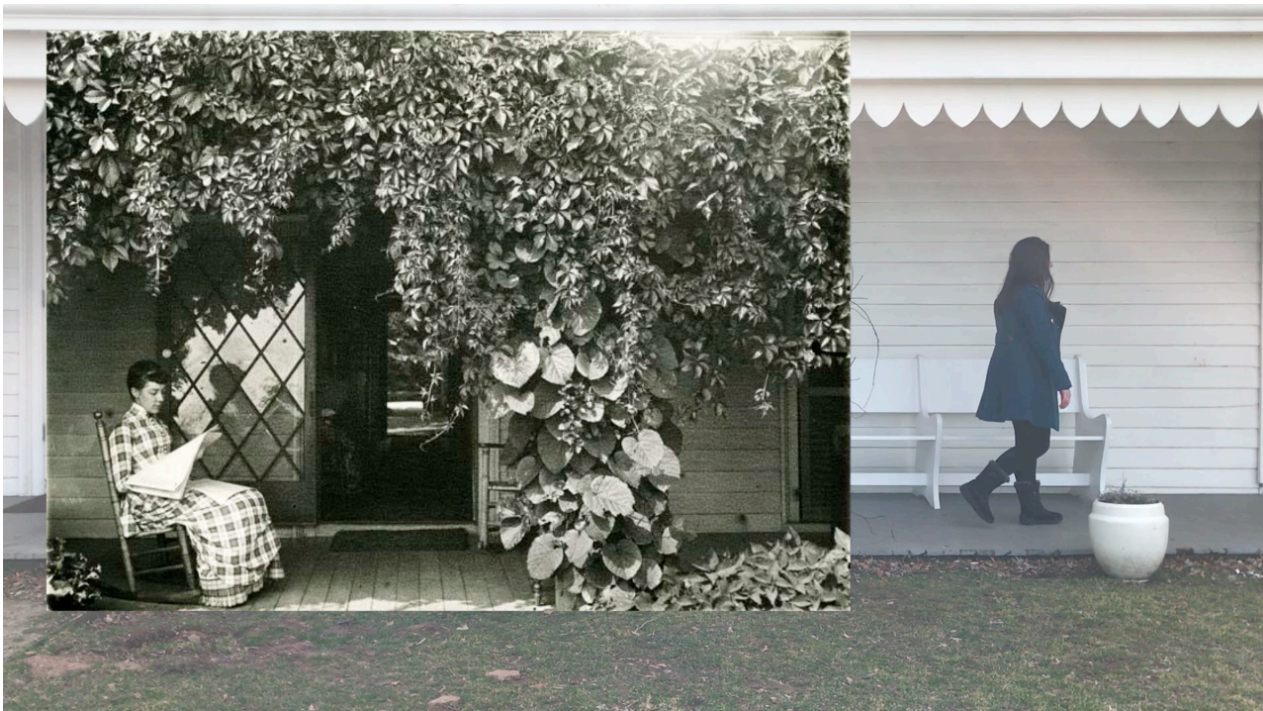
Imagem 10. Livia Auler, Para Alice, still de vídeo, dimensões variadas, Porto Alegre, 2021.