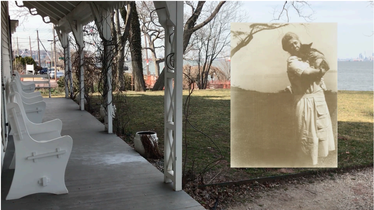
Imagem 9. Livia Auler, Para Alice, still de vídeo, dimensões variadas, Porto Alegre, 2021.