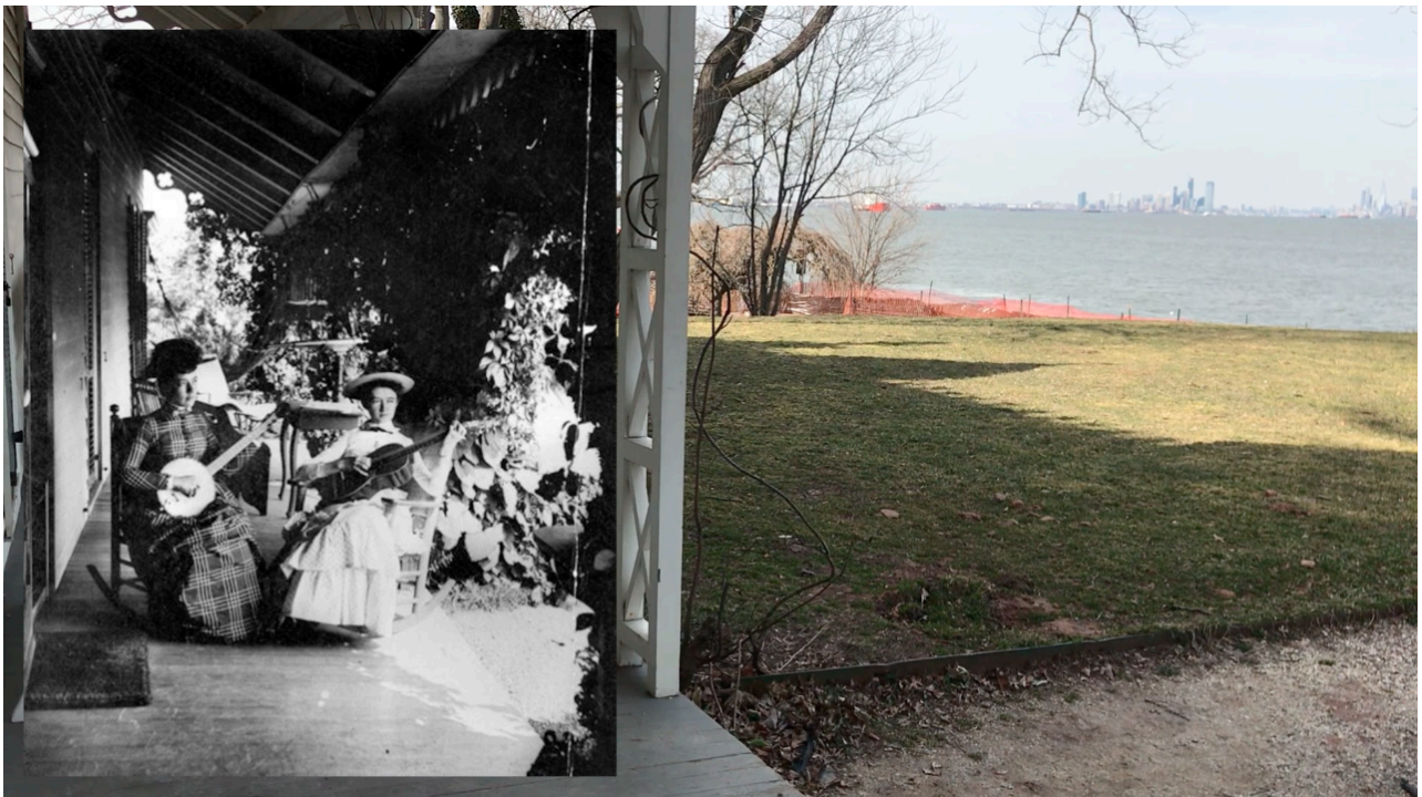
Imagem 8. Lívia Auler, Para Alice, still de vídeo, dimensões variadas, Porto Alegre, 2021.