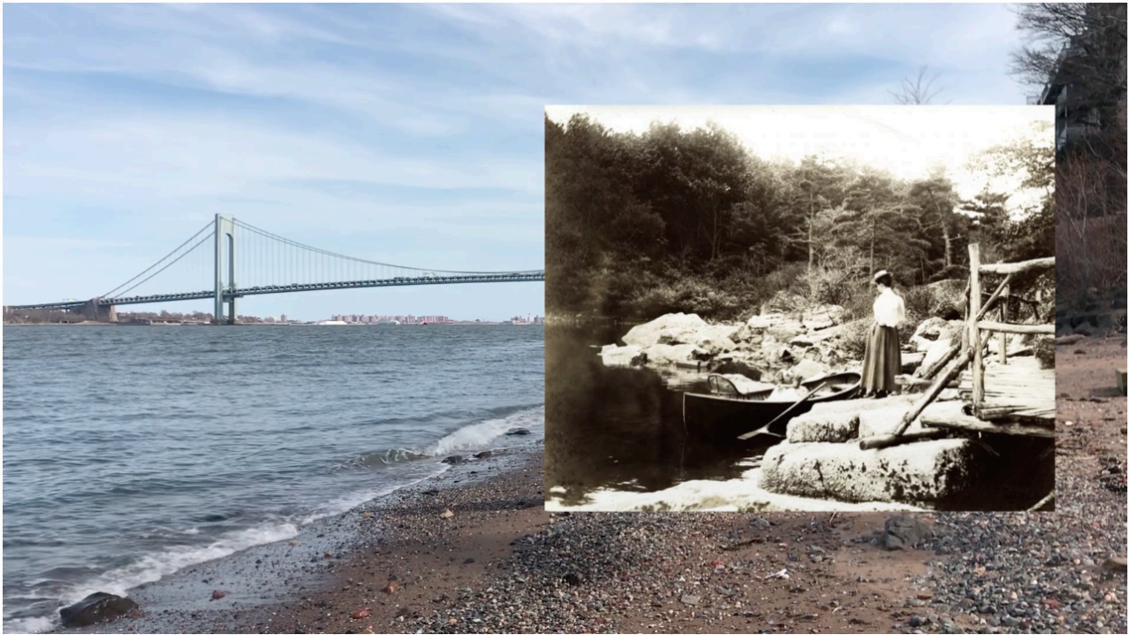
Imagem 7. Lívia Auler, Para Alice, still de vídeo, dimensões variadas, Porto Alegre, 2021.