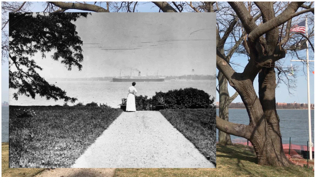
Imagem 2. Lívia Auler, Para Alice, still de vídeo, dimensões variadas, Porto Alegre, 2021.