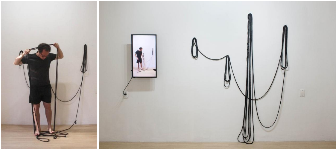
Imagem 1. Pedro Parente, Dimensões das fronteiras de si , 2021. Videoperformance, duração: 5:58.

1 e 2). Em outra instância, o trabalho se estabelece enquanto proposição através da qual visou provocar uma resposta do público por meio de uma interação gerada pela sua veiculação em páginas e plataformas digitais, como Instagram e YouTube, incluindo perfis de colaboradores e do próprio Corredor 14.