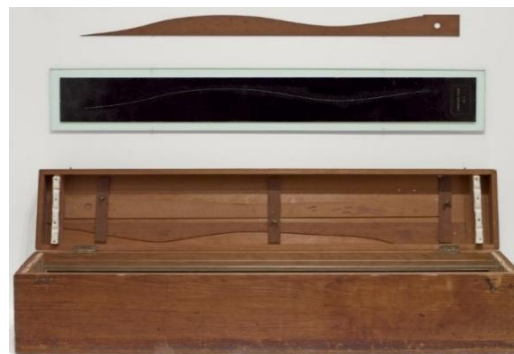
Imagem 7. Marcel Duchamp, 3 repousos padrão , réplica de 1964 (original 1913/14).

Em Três repousos padrão 5 (Imagem 07), Marcel Duchamp ironizava a pretensão de exatidão matemática e a noção de um padrão universal, como o metro. Para isso ele criou três réguas em madeira, cujo tamanho foi definido pelo repouso de fios com um metro de comprimento soltos de uma altura de um metro. Crease (2013, p.109) afirma que a operação de Duchamp seu teor sarcástico conseguia demonstrar que “Em vez de o sistema métrico ser libertador para a humanidade, como viam seus instituidores, os revolucionários franceses, uma paródia do sistema métrico é que é libertadora para o artista”.