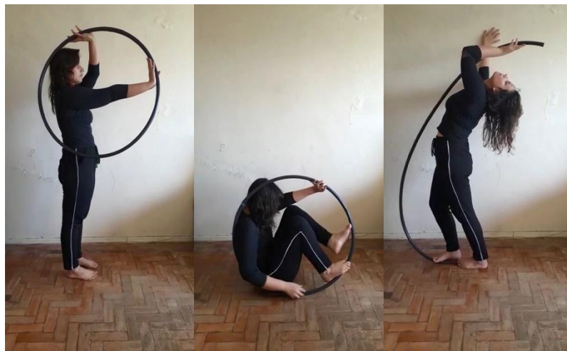
Imagem 5. Nadine Lannes, frames da videorresposta A circunferência do eu , 2021 Duração 1:57 min.