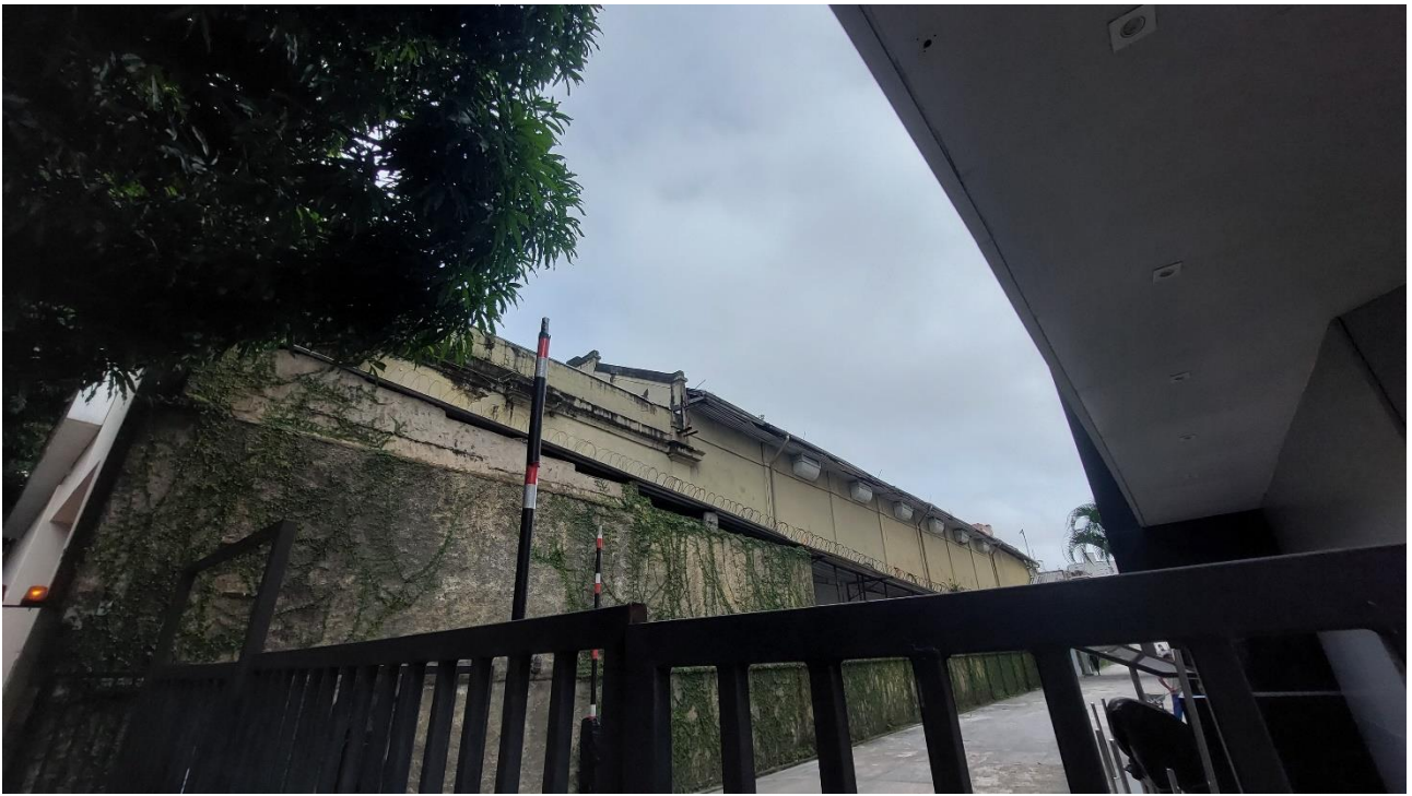
Imagem 8. Denis Bezerra, Aqui foi, ainda jaz – Cinema Nazaré 1, fotografia, série Filmagem Do lugar de onde se vê , Belém/PA, 15/5/2022.