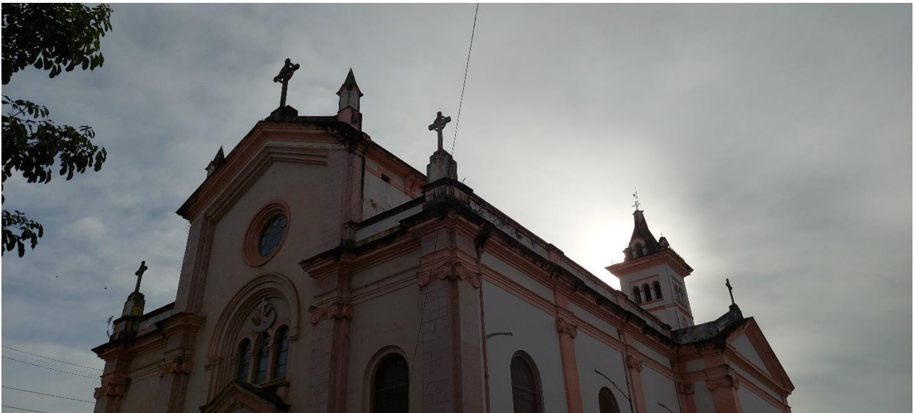
Imagem 6. Denis Bezerra, Igreja dos Capuchinos – entre céus, fotografia, série Filmagem Do lugar de onde se vê , Belém/PA, 15/5/2022. “Empenhou-se tanto e de tal modo, sem cessar, na busca de algo jamais revelado, segredo seu, pelo qual se deixara fascinar até à obsessão, que lá um dia, viu-se obrigado a sustá-la de vez. Não, diga-se, a bem da verdade, por cansaço, desânimo, ou coisa pior, mas - contando ninguém acredita - apenas por ter esquecido totalmente o que era que estava buscando”. Contículo Nº 20 . Cláudio Barradas (2022).