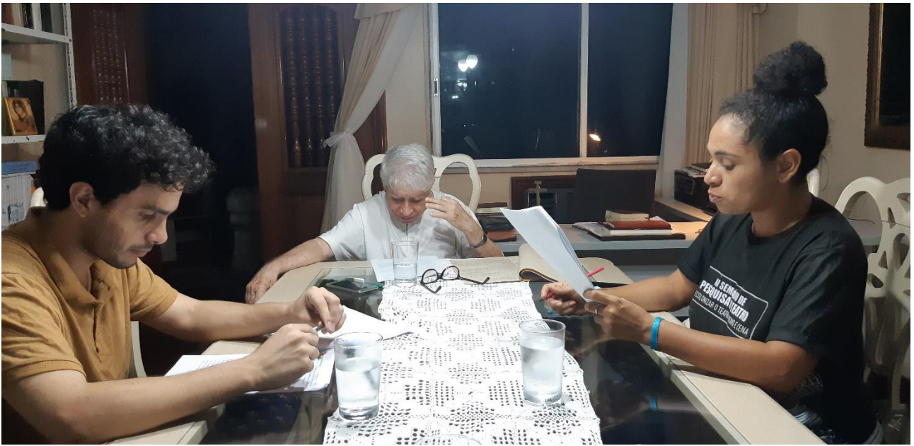
Imagem 4. Denis Bezerra, Barradas e seus atores, Fotografia, série Dama da Noite – Ensaios , 4º Encontro, Belém/PA, 23/1/2020. “Encontra o VERDADEIRO AMOR [...] A Dama da Noite recolhe seu perfume com a luz do dia [...] Roda na Roda, meu bem!” Frases do texto (Barradas, Dama da Noite , 1989).