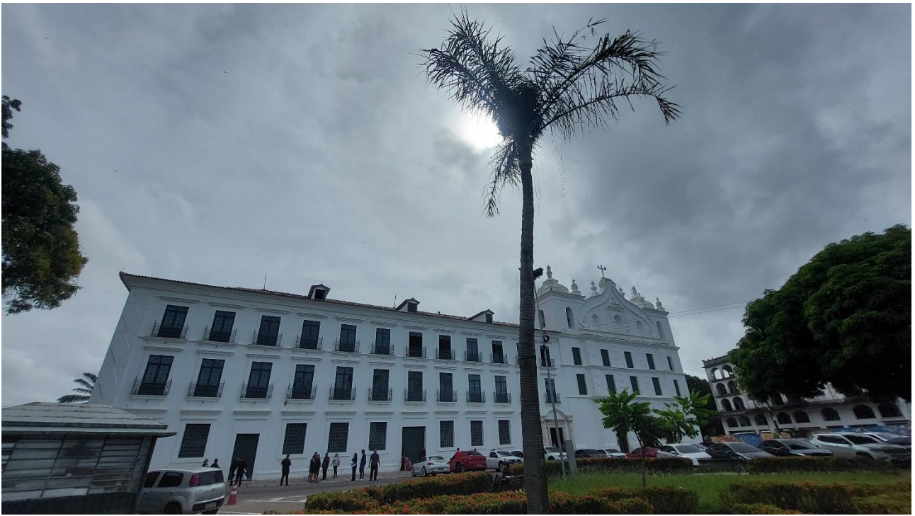
Imagem 9. Denis Bezerra, Onde era – antigo Seminário Metropolitano de Belém, fotografia, série Filmagem Do lugar de onde se vê , Belém/PA, 15/5/2022.