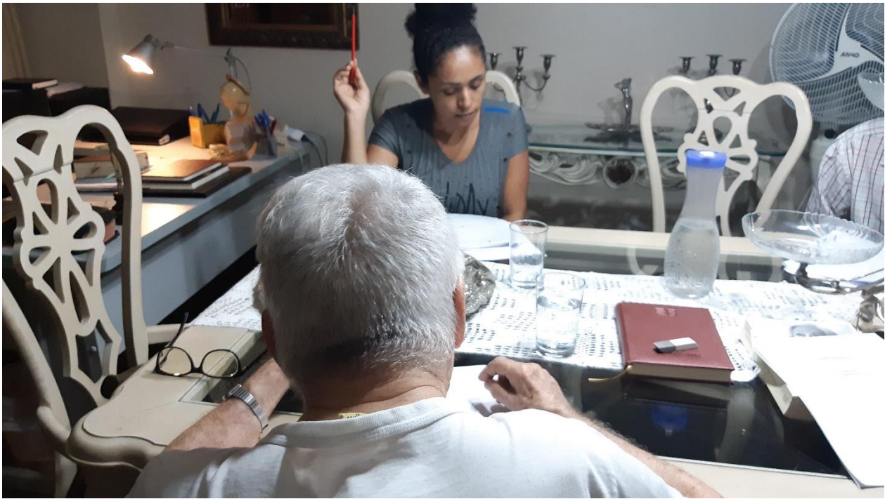
Imagem 1. Denis Bezerra, Mestre e a Atriz I, iii Fotografia, série Dama da Noite – Ensaio , 3º Encontro, Belém/PA, 21/1/2020. “Só se baixa a voz na penúltima sílaba da palavra” (Cláudio Barradas, Ensaio, 2020).