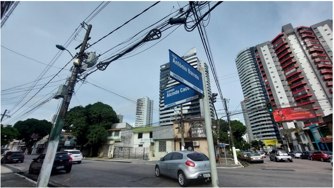
Imagem 7. Denis Bezerra, Cruzamentos da memória – em busca da casa onde nasceu, fotografia, série Filmagem Do lugar de onde se vê , Belém/PA, 15/5/2022. Foto: Denis Bezerra, 2022. “Como escritor, senhor absoluto de tudo quanto é palavra. Como ser humano, pobre escravo de seus não poucos vícios”. Contículo Nº 26. Cláudio Barradas (2022).