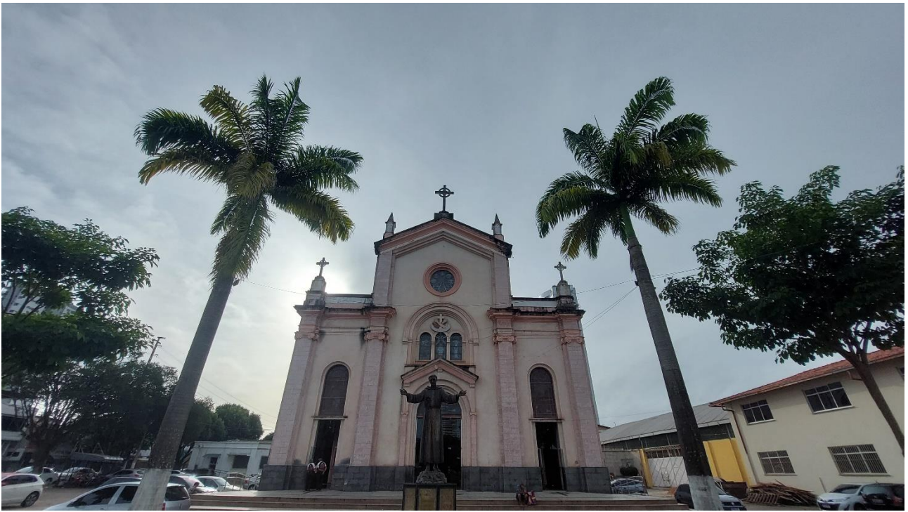
Imagem 5. Denis Bezerra, Igreja dos Capuchinos – plano geral, fotografia, série Filmagem Do lugar de onde se vê , Belém/PA, 15/5/2022. Foto: Denis Bezerra, 2022. “Fez da memória um baú onde cuidadosamente ia guardando tudo que lhe era dado a viver, para não perdê-lo, levado pelo tempo” - Contículo N° 0 . Cláudio Barradas (2022).