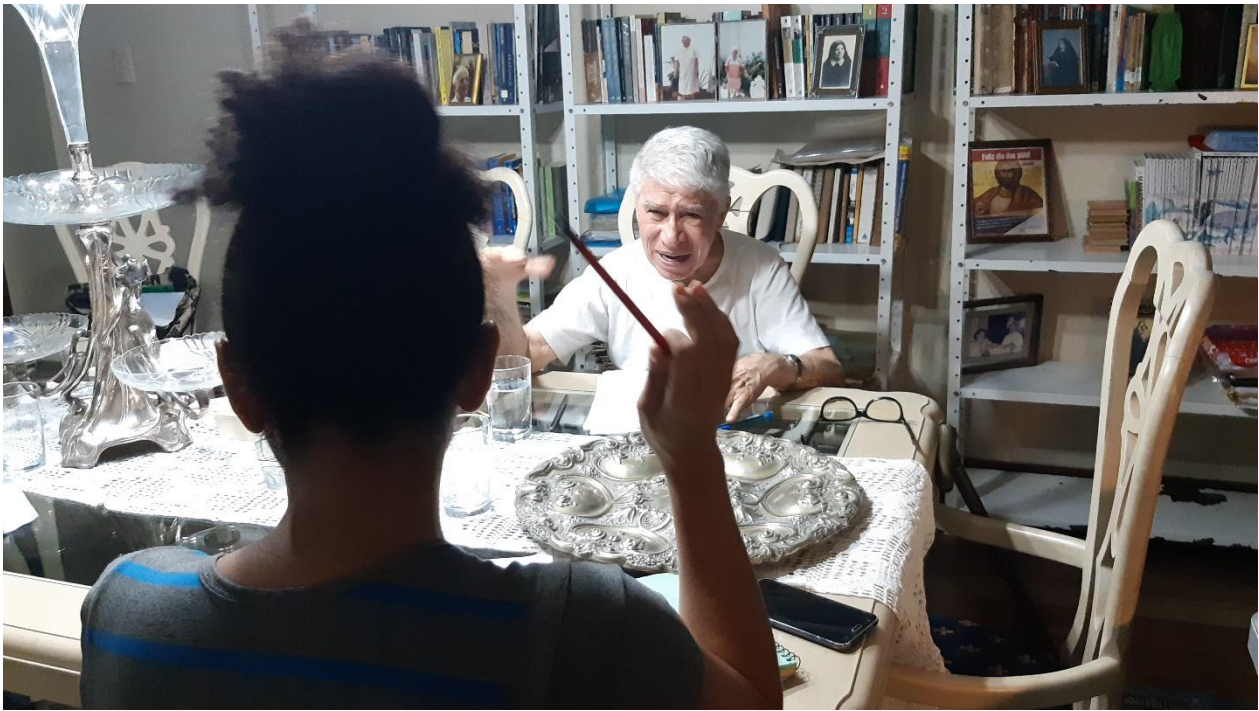
Imagem 2. Denis Bezerra, Mestre e a Atriz II, Fotografia, série Dama da Noite – Ensaios , 3º Encontro, Belém/PA, 21/1/2020. “Eu tenho um sonho, eu tenho um destino [...] E quando chegar essa hora da noite eu me desencanto”. Frases do texto (Barradas, Dama da Noite , 1989).