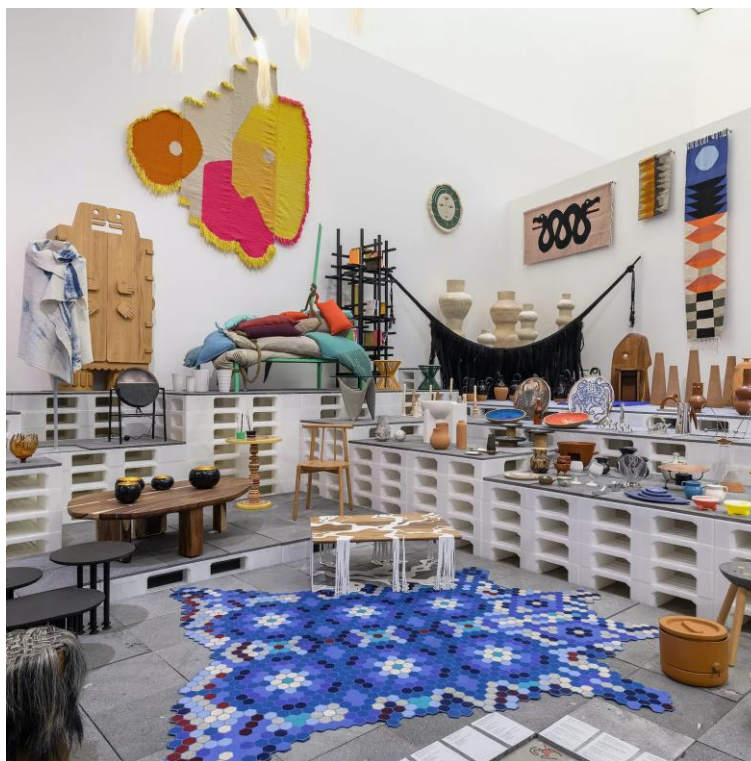
Imagem 3 – Fotografia do núcleo 5.

Delgado Ávila (2024) crítica a expografia da mostra, sugerindo que o layout expositivo ficou “abarrotado”. Para a autora, embora os primeiros núcleos tenham uma disposição mais fluida, a partir do terceiro núcleo instala-se um caos crescente. Segundo Ávila (2024), esse adensamento resulta da tentativa da curadora de abarcar múltiplas narrativas, somada à ausência de delimitações claras quanto a tipologias, técnicas e materiais, contribuindo para a saturação do espaço expositivo. O que a crítica observa como problema - a ausência de um ordenamento ou de categorias aparentes - parece ter sido uma escolha curatorial, ao ensinar no ambiente expositivo a profusão, ou efervescência, que é identificada na cultura material mexicana.