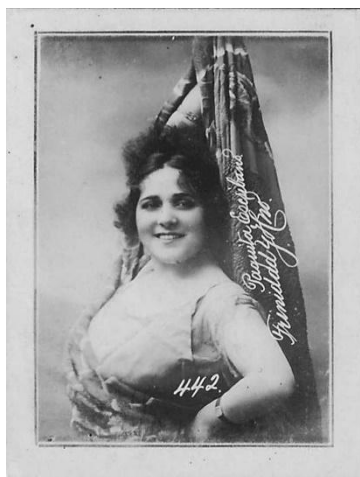
Imagem 2. Autor desconhecido. Cartão-postal 442. Trinidad y Hermano, década de 1920. Impressão fotográfica em prata/gelatina, 6,2 x 4,7 cm. Fonte: Acervo do autor.