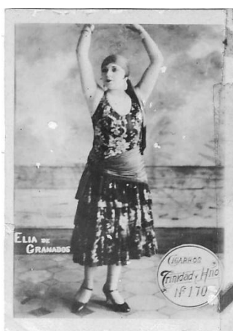
Imagem 3. Autor desconhecido. Cartão-postal 170. Trinidad y Hermano, década de 1920. Impressão em prata/gelatina, 6,2 x 4,7 cm.