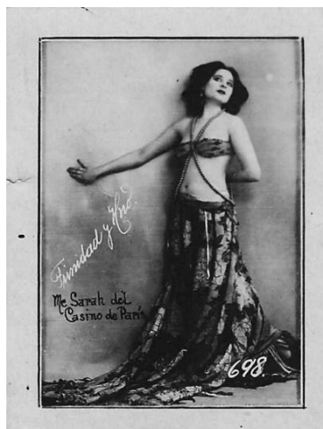
Imagem 4. Autor desconhecido. Cartão-postal 698. Trinidad y Hermano, década de 1920. Impressão em prata/gelatina, 6,2 x 4,7 cm.

34° Encontro Nacional anpap ® FURG Rio Grande/RS