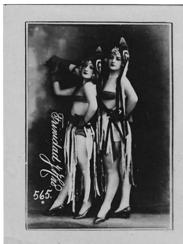
Imagem 10. Autor desconhecido. Cartão-postal 565. Trinidad y Hermano, década de 1920. Impressão em prata/gelatina, 6,2 x 4,7 cm. Fonte: Acervo do autor.

La seducción de la mirad: fotografía del cuerpo em Cuba (1840 – 2013) , (2014, p. 46), aqui já mencionadas.