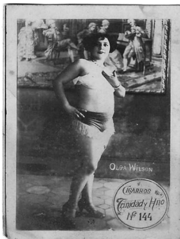
Imagem 9. Autor desconhecido. Cartão-postal 144. Trinidad y Hermano, década de 1920. Impressão em prata/gelatina, 6,2 x 4,7 cm. Fonte: Acervo do autor.

O cartão-postal número 565, apresenta uma situação peculiar, é o único da coleção do autor, que apresenta duas modelos-artistas (Imagem 10). Fato que, também, não acontece nos cartões-postais apresentados no catálogo da exposição Antología del desnudo femenino en la fotografía cubana (2000, p. 3), e na obra de Acosta de Arriba