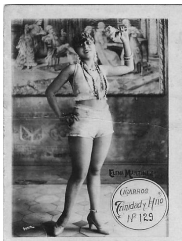
Imagem 8. Autor desconhecido. Cartão-postal 129. Trinidad y Hermano, década de 1920. Impressão em prata/gelatina, 6,2 x 4,7 cm.

34° Encontro Nacional anpap ® FURG Rio Grande/RS