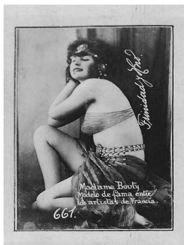
Imagem 5. Cartão-postal 661. Trinidad y Hermano, década de 1920. Impressão em prata/gelatina, 6,2 x 4,7 cm.