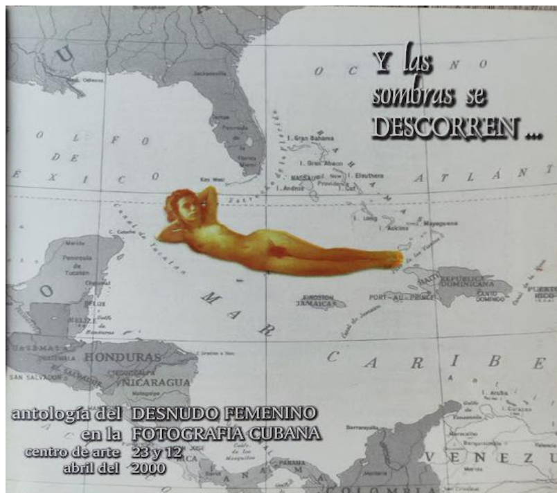
Imagem 1. Capa do catálogo da exposição “Antología del desnudo femenino en la fotografía cubana”, 2000. 75 páginas, 20 x 20 cm.

34° Encontro Nacional anpap ® FURG Rio Grande/RS