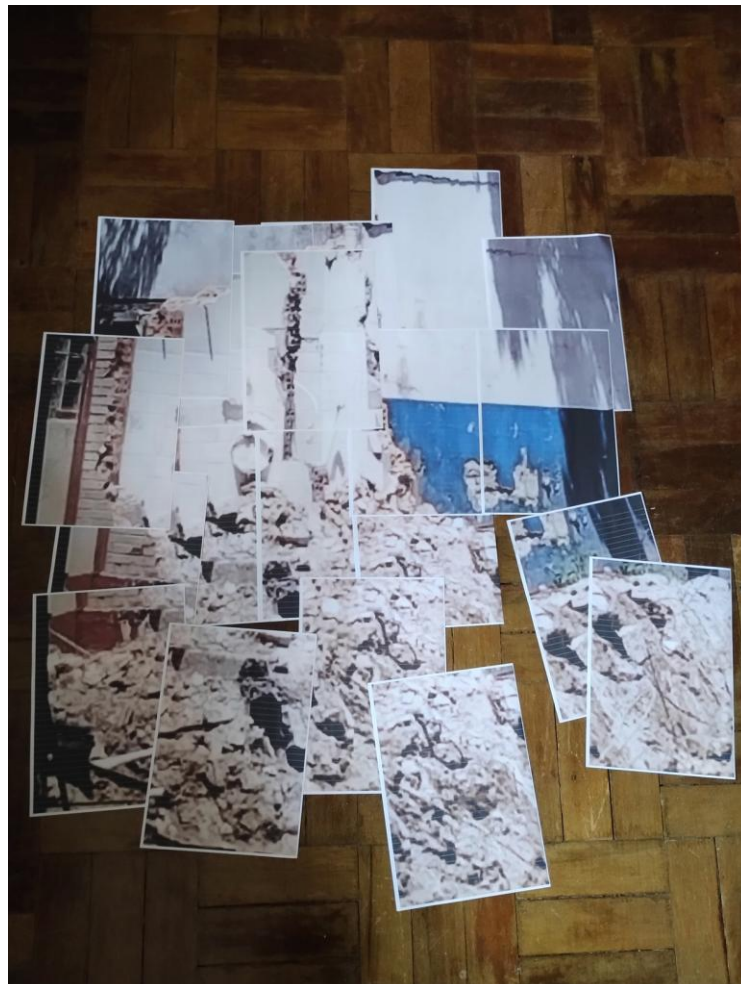
Imagem 6: Impressões da imagem para colagem, usada em Demolição bairro Santa Cecília .

Em Demolição bairro Santa Cecília , utilizei uma imagem dividida em várias impressões (Imagem 6), montei conforme a proporção designada e colei em cima de portas de armários com relevos decorativos (Imagem 7). Junto a isso, eu pintei com tinta esmalte um detalhe de aglomerados de calça, presente em outra imagem do meu acervo (Imagem 8). Preenchi partes do relevo dessas portas com papel machê para realçar o volume que cruzava a pintura. Observado esse trabalho de perto, fica visível que há remendos entre uma folha e outra formando a imagem, bem como os relevos do suporte. Não considero esse trabalho totalmente concluído, mas é um resultado que abre possibilidades de desdobramentos para as próximas produções.