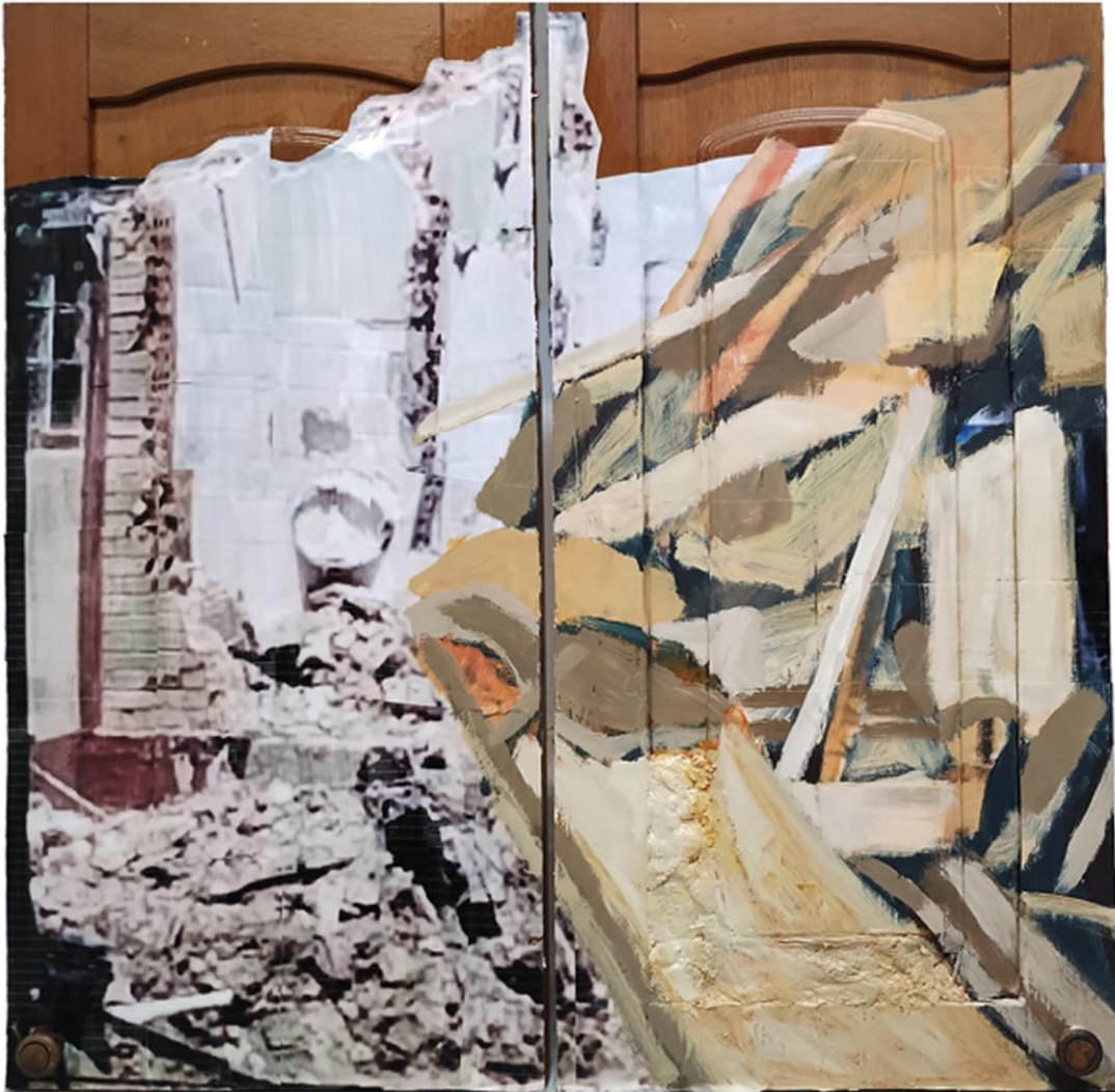
Imagem 8: Demolição bairro Santa Cecília, 2024. Colagem e pintura com tinta esmalte sintético sobre porta de armário. 82 x 80 cm.

Portanto, ao analisarmos essas duas produções, percebo um diálogo pictórico da colagem, técnica que começa a torner minha pesquisa poética. A colagem é um ramo da pintura, e parte da composição com sobreposições de elementos junto à superfície, criando espacialidades e composições específicas. Foi uma linguagem bastante comum na arte moderna entre os dadaístas, cubistas, surrealistas e construtivistas, e ainda hoje nos deparamos com trabalhos que contêm essa técnica. Marco Giannotti descreve um fator importante vindo do cubismo: