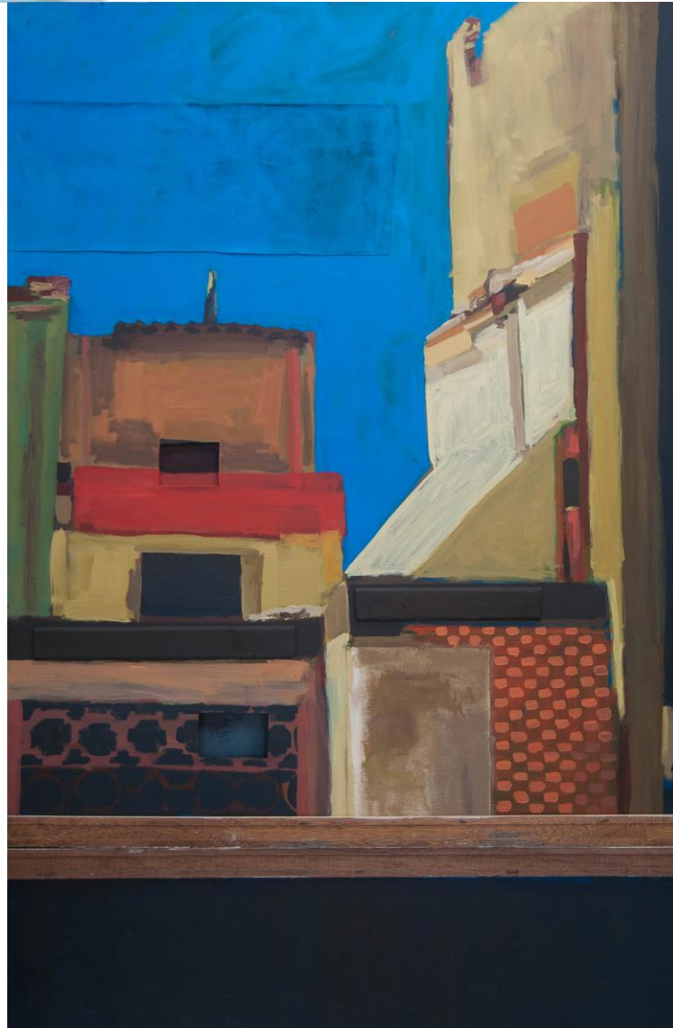
Imagem 4: Demolição bairro Rio Branco, 2023. Tinta esmalte sintético, madeira e tela sobre MDF, 203 x 113 cm.