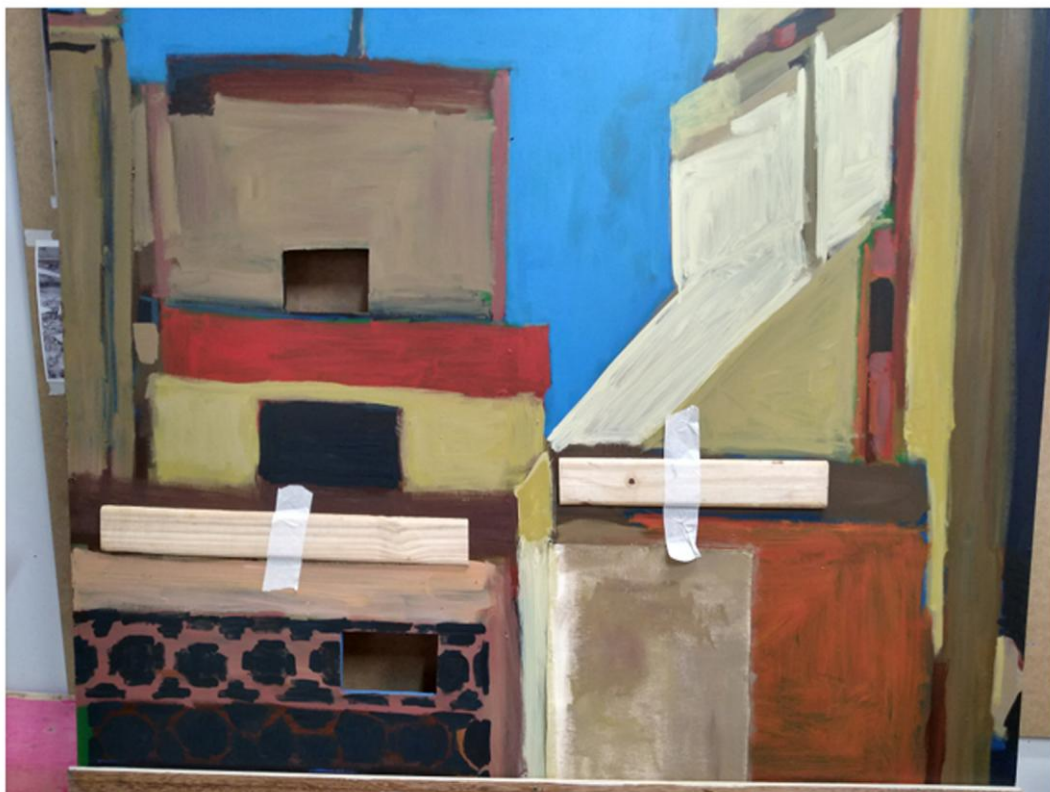
Imagem 5: Processo e detalhes da pintura Demolição bairro Rio Branco .

Demolição bairro Rio Branco (Imagem 4) trata-se de uma pintura em grande dimensão, com tinta esmalte sintético sobre placa de MDF. Encontrei e coletei esse suporte dentro do prédio do Instituto de Artes da UFRGS, que seria descartado após obras no edifício, e nele havia intervenções: recortes triangulares na superfície. Para a feitura da pintura, organizei a estrutura da imagem conforme a referência e adicionei outros materiais na composição, como guarnição de portas ou demais pedaços de madeira, junto com retalhos de telas antigas (Imagem 5). Resultou em uma pintura com diferentes relevos e texturas. Durante o processo, senti necessidade de detalhar algumas partes da imagem, por observar que isso compunha com as texturas dos materiais acoplados à superfície.