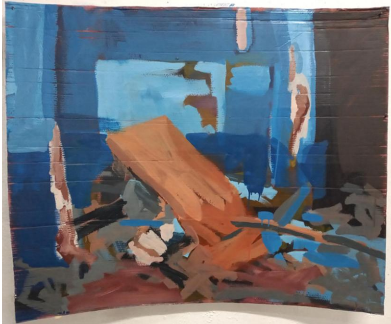
Imagem 2: Série (Des)construção – Ginásio da Brigada Militar #1, 2020. Pintura acrílica com tinta esmalte sintético sobre papelão, 92,5 x 113 cm.