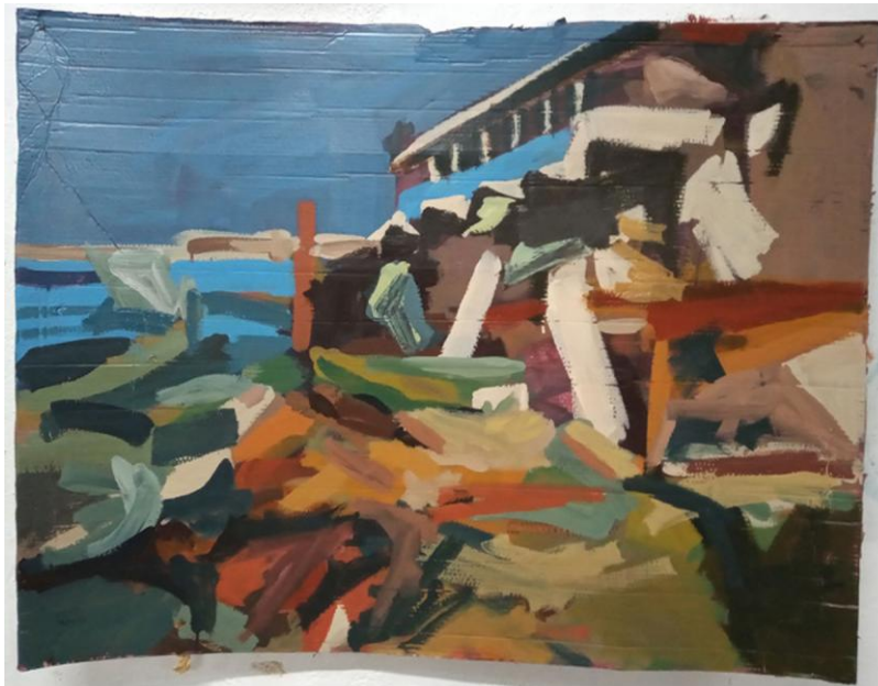
Imagem 3: Série (Des)construção – Ginásio da Brigada Militar #4, 2020. Pintura acrílica com tinta esmalte sintético sobre papelão, 92,5 x 113 cm.