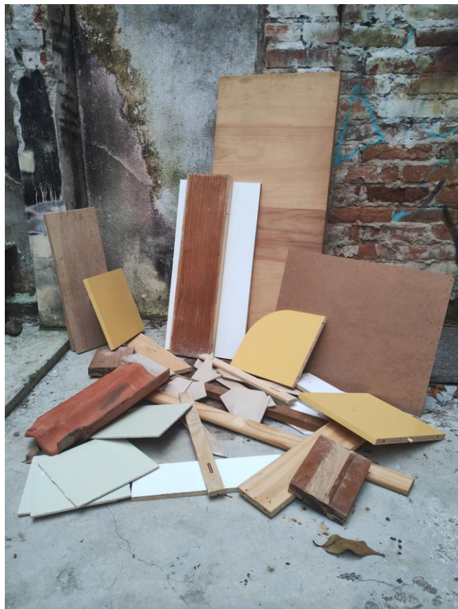
Imagem 1: Alguns materiais recolhidos durante caminhandas pelos bairros, 2025.

Em meio ao caos das constantes construções e demolições pelos bairros de Porto Alegre, consigo coletar materiais descartados em caçambas nas ruas (Imagem1), onde os pedreiros se desfazem dos restos de obras. São portas, tábuas, tapumes, metais, chapas de MDF, azulejos, gesso, cimento, painéis, dentre outros, que para mim são úteis para o processo construtivo da pintura.