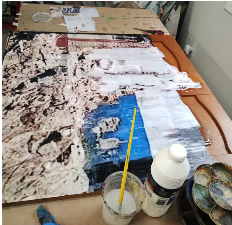
Imagem 7: Processo da pintura Demolição bairro Santa Cecília.