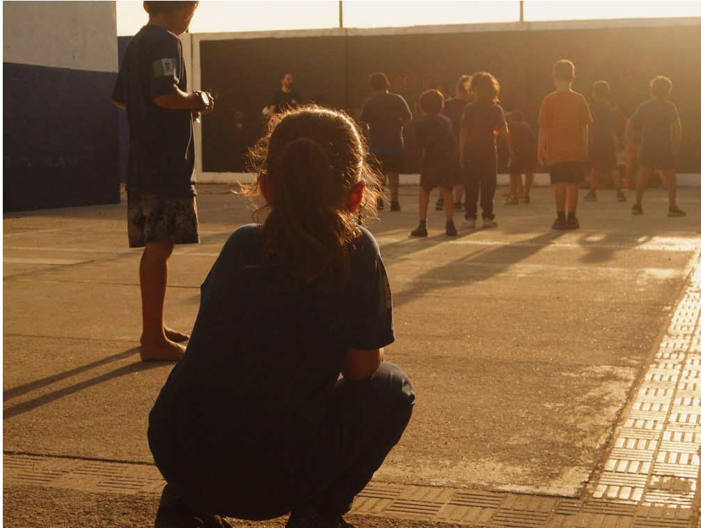
Imagem 8. Eduardo San Martins, Pequenas Esperas, instantes que alongam o corpo. Fotografia digital, 4000px X 3000px, Rio Grande - RS, 2025.