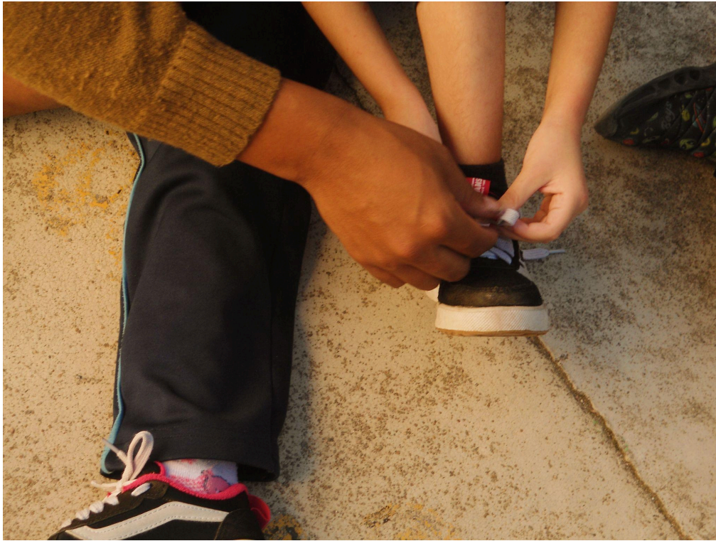
Imagem 7. Verônica Brandão, Entre Nós, o Nó: afeto em forma de amarra. Fotografia digital, 4000 px X 3000 px, Rio Grande - RS, 2025.