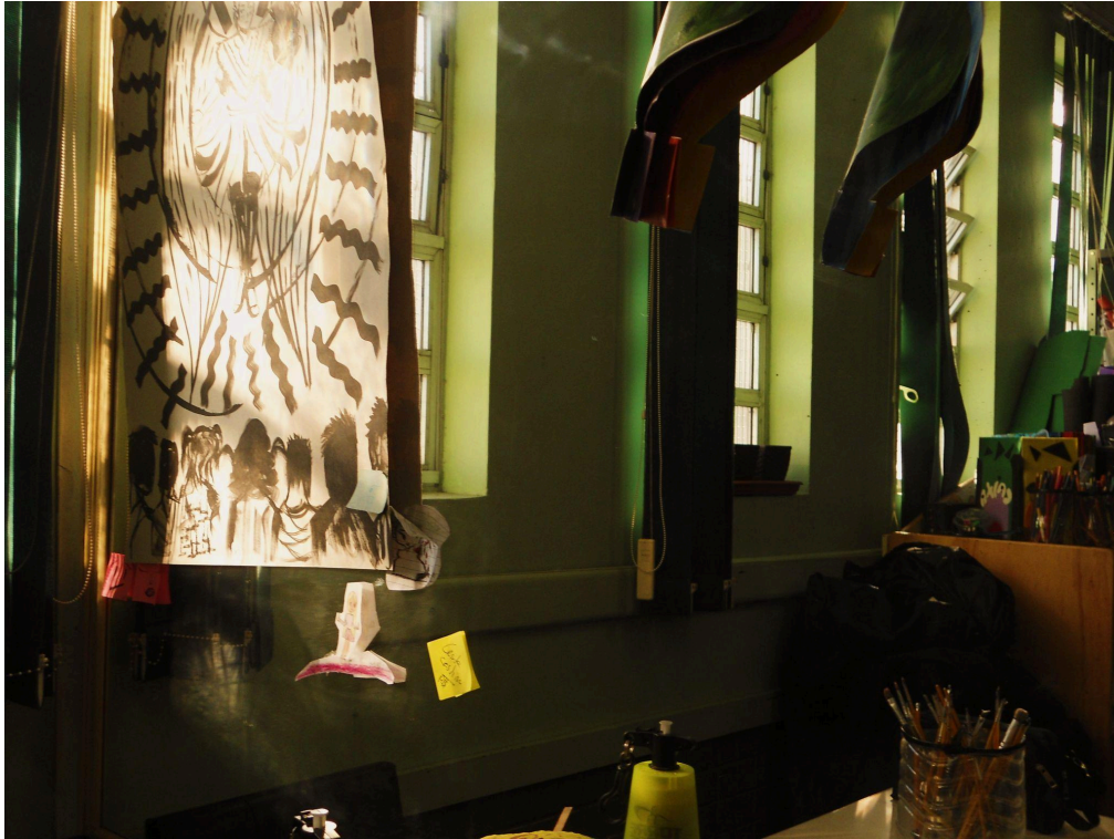
Imagem 4. Estudante do 3º ano. Lente Baixinha, Olhar Atento. Fotografia digital, 4000 px X 3000 px, Rio Grande - RS, 2025