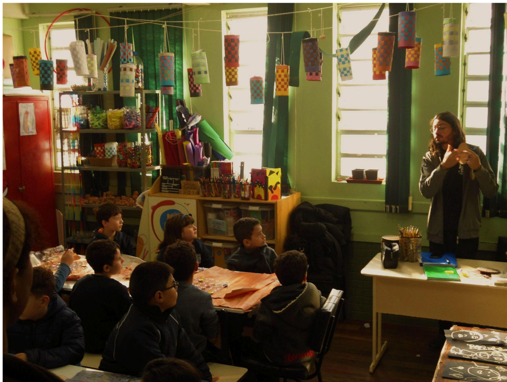
Imagem 1. Verônica Brandão, A poética da atenção, um gesto delicado de estar com o mundo. Fotografia digital, 4000 px X 3000 px, Rio Grande - RS, 2025.