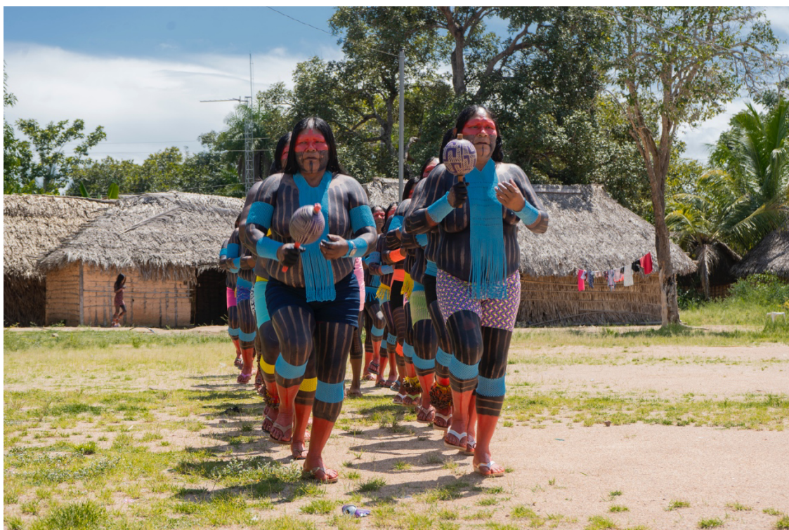
Imagem 2. Mulheres indígenas Mëbêngôkre Kayapó. Fotografia Digital, 40 cm X 50 cm, Aldeia Tekrejarotire, 2025.