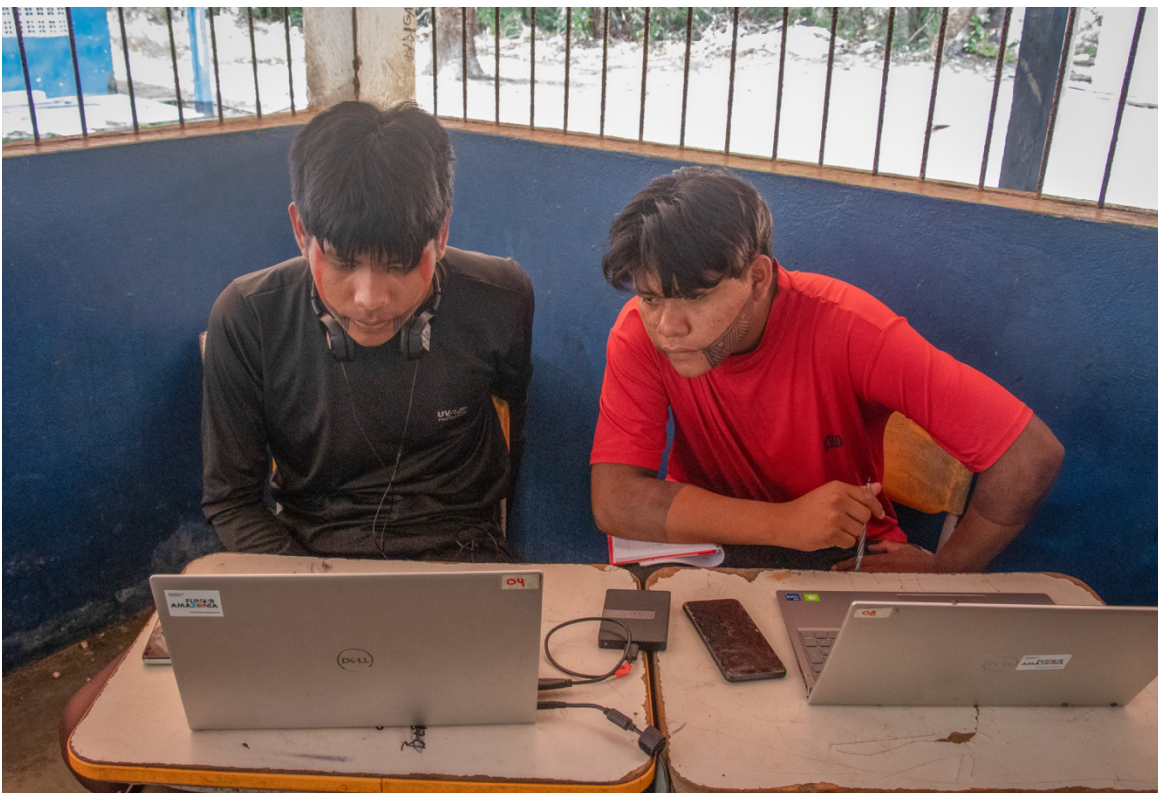
Imagem 6. Oficina Narrativas Digitais. Fotografia Digital, 40 cm X 50 cm, Aldeia Tekrejarotire, 2025