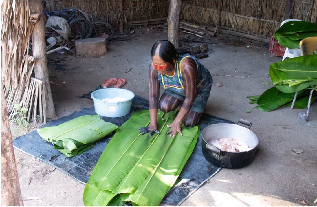
Imagem 7. Preparação do alimento tradicional Djwyjkupu. Fotografia Digital, 40 cm X 50 cm. Aldeia Tekrejarotire, 2025.