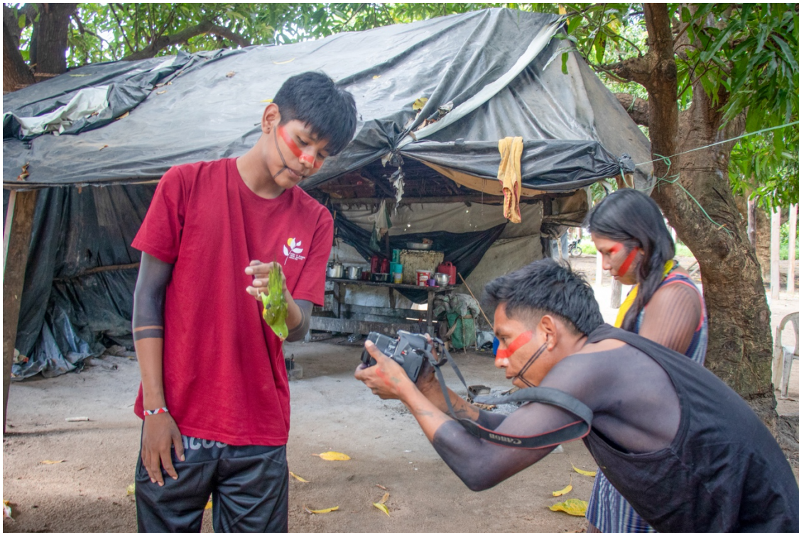
Imagem 9. Oficina Narrativas Digitais. Digital, 40 cm X 50 cm, Aldeia Tekrejarotire, 2025.