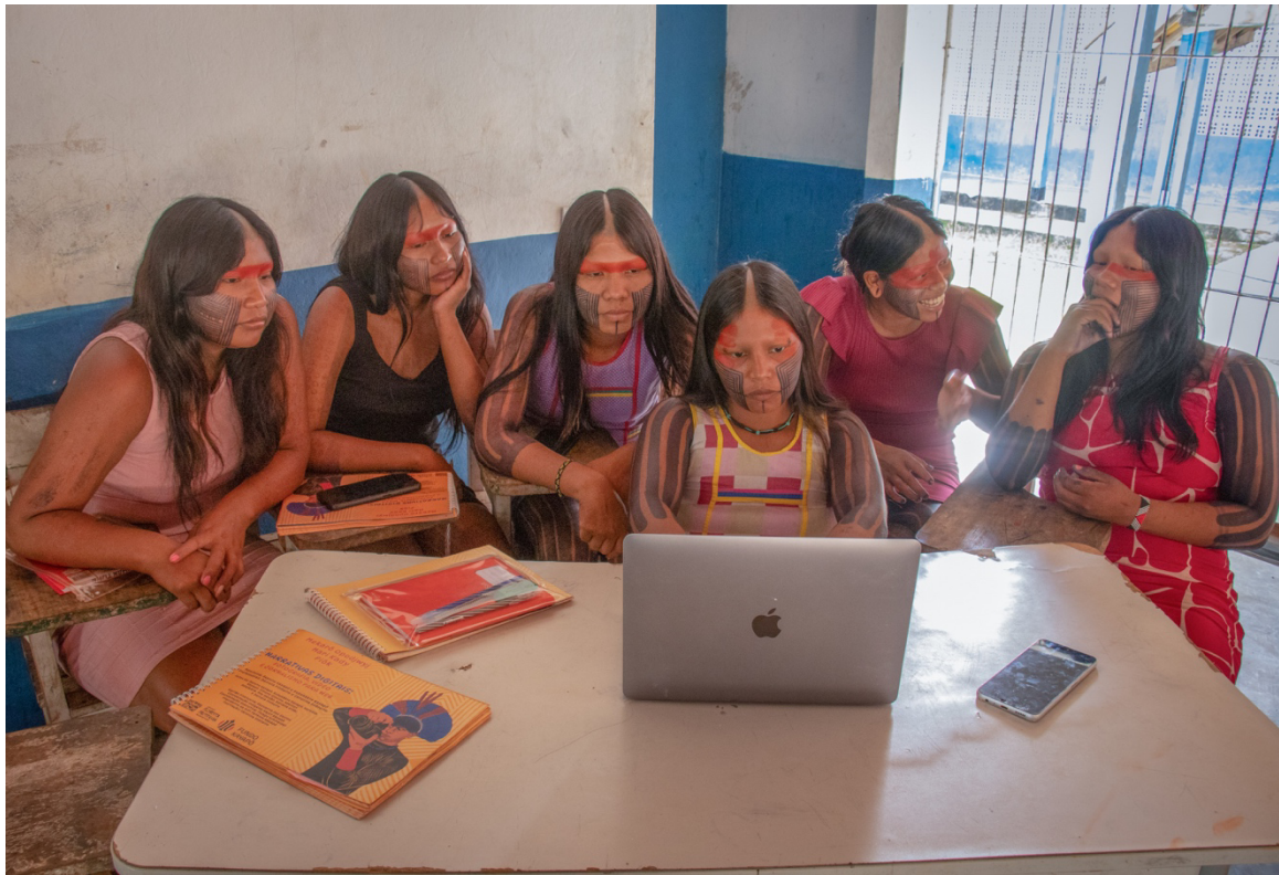
Imagem 5. Oficina Narrativas Digitais. Fotografia Digital, 40 cm X 50 cm, Aldeia Tekrejarotire, 2025