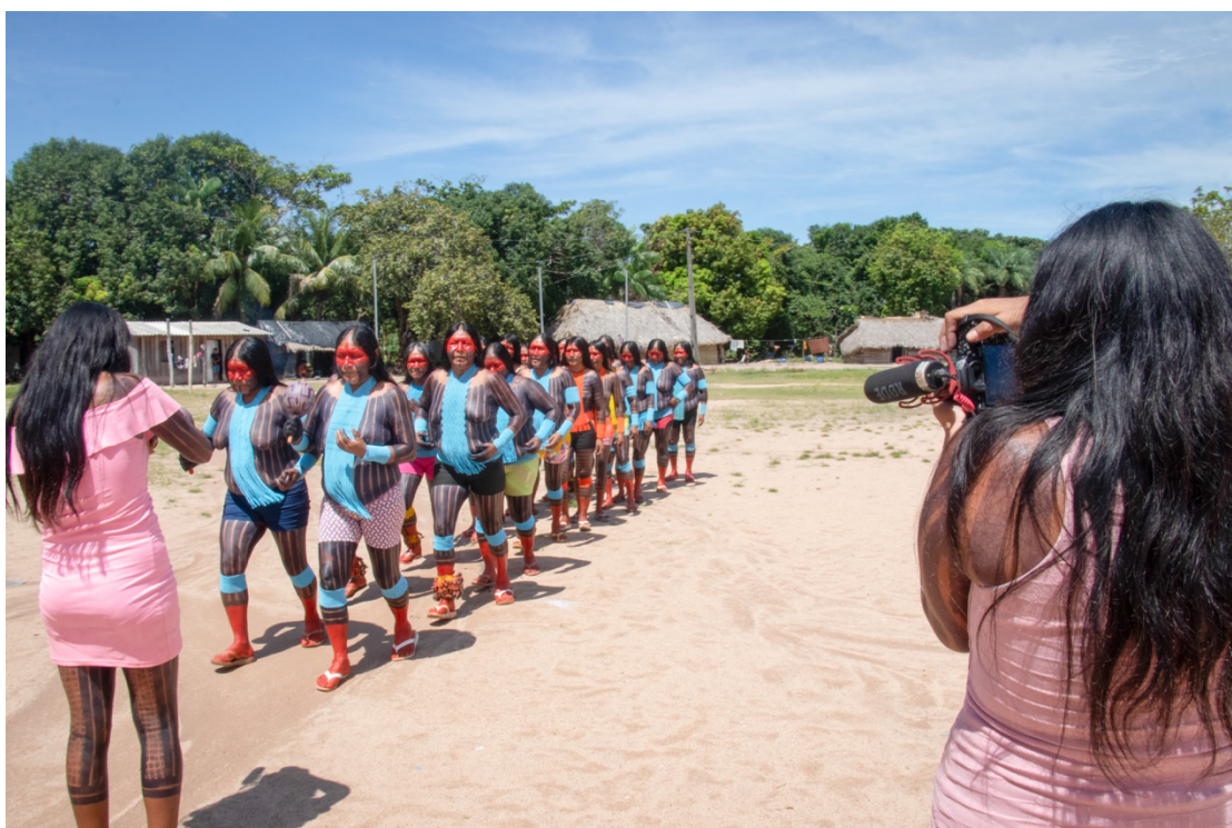
Imagem 1. Irekabô e Nhakture, Kayapó, fotografando as anciãs da aldeia, durante a oficina Narrativas Digitais. Fotografia Digital, 40 cm X 50 cm, Aldeia Tekrejarotire, 2025