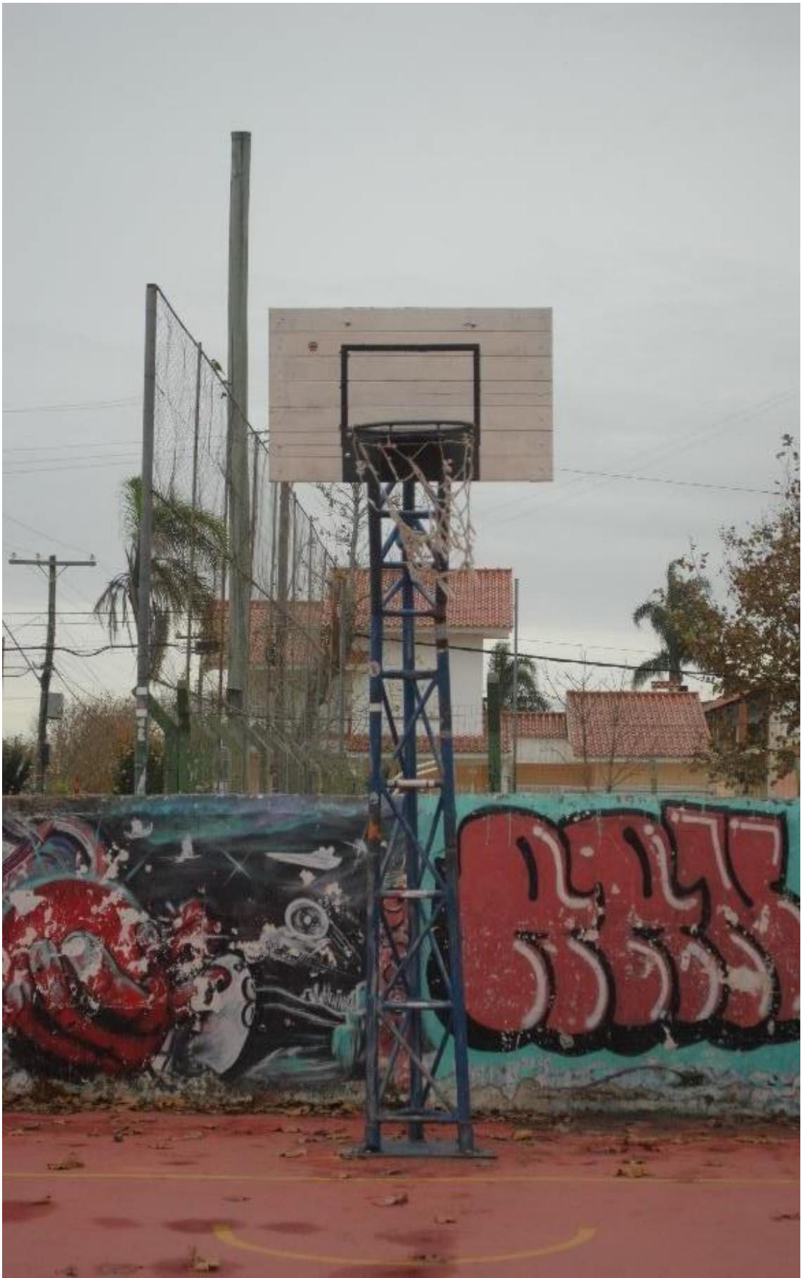
Imagem 1. Thaisa Freitas, Cesta (1 de 5), fotografia digital colorida, 24cm X 15cm, Rio Grande, (2023).