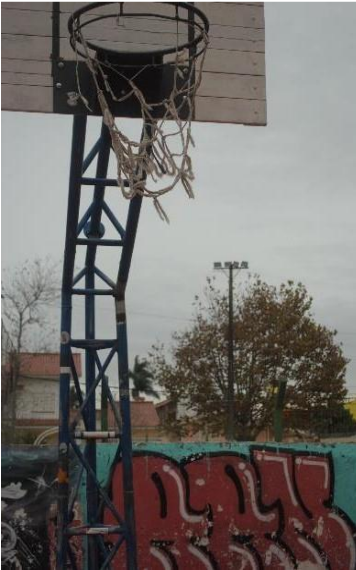
Imagem 3. Thaisa Freitas, Cesta (3 de 5), fotografia digital colorida, 24cm X 15cm, Rio Grande, (2023). Foto: acervo pessoal, (2023).