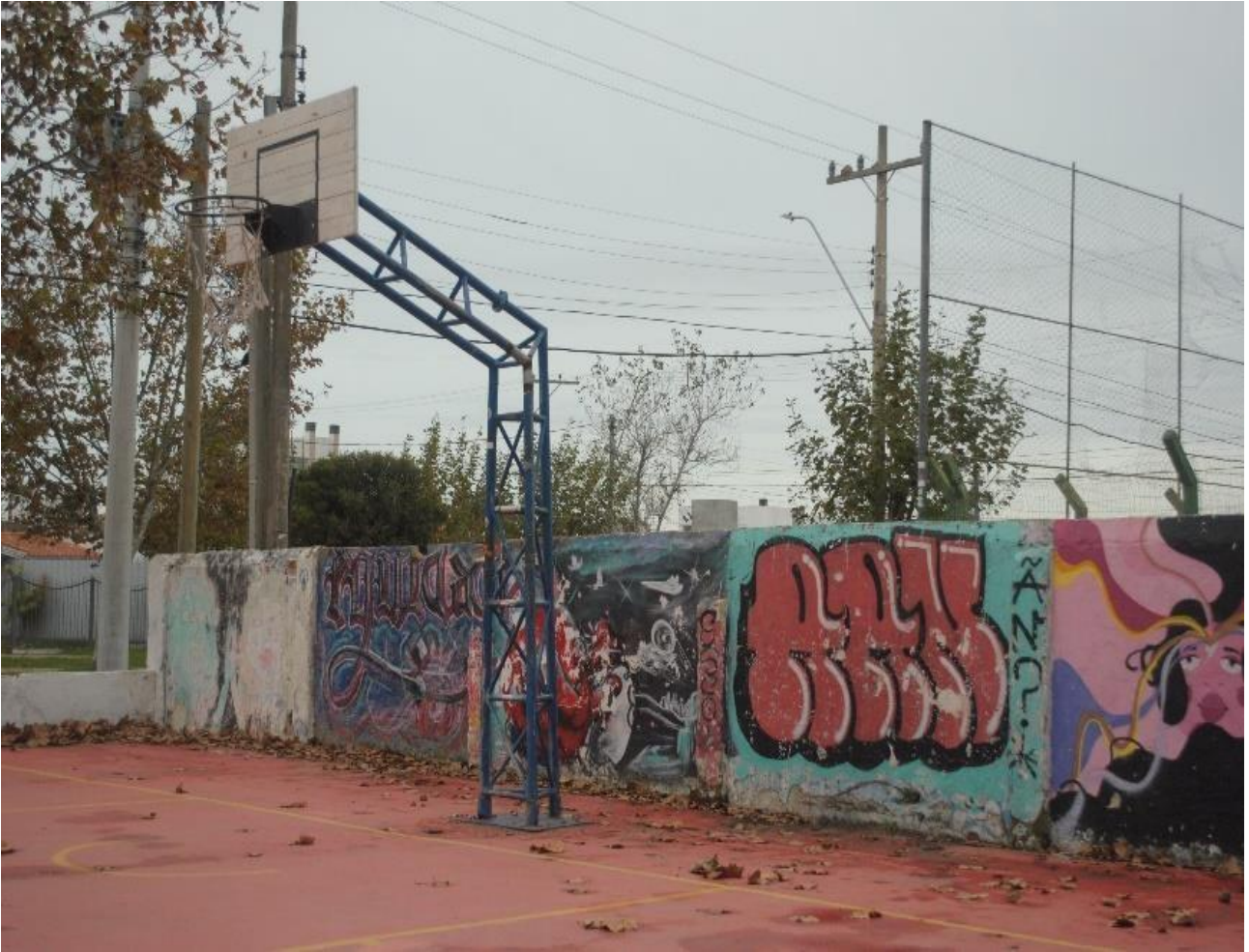
Imagem 5. Thaisa Freitas, Cesta (5 de 5), fotografia digital colorida, 12cm X 17cm, Rio Grande, (2023).