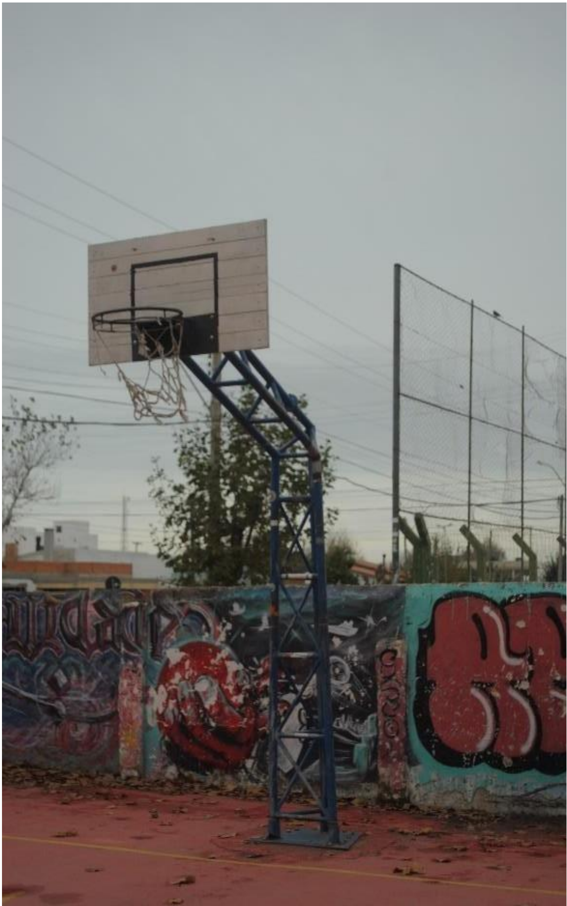
Imagem 2. Thaisa Freitas, Cesta (2 de 5), fotografia digital colorida, 24cm X 15cm, Rio Grande, (2023).