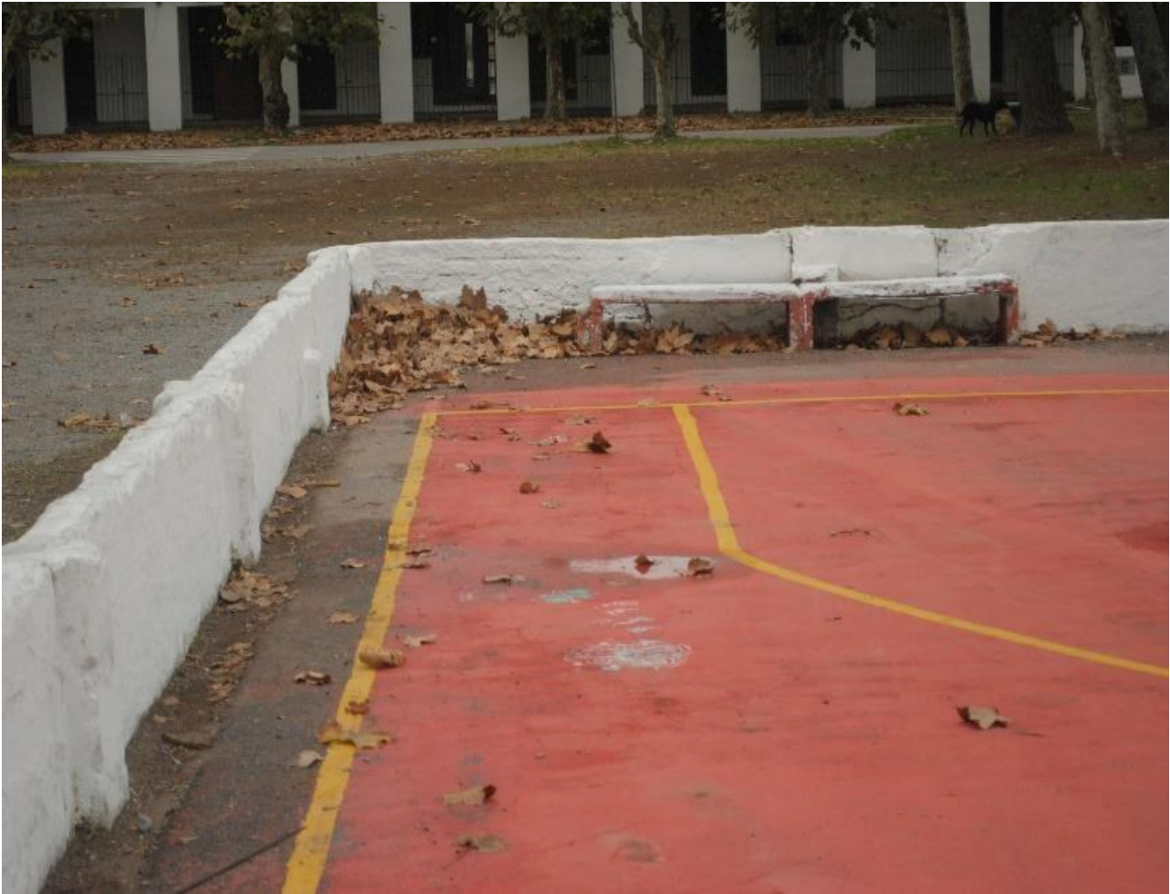
Imagem 4 Thaisa Freitas, Cesta (4 de 5), fotografia digital colorida, 12cm X 17cm, Rio Grande, (2023).