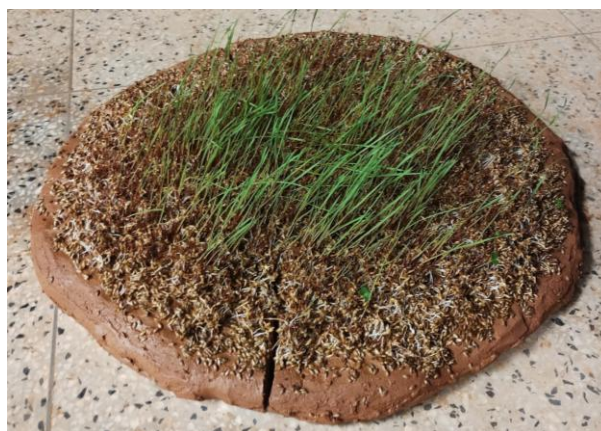
Imagem 1. Sementes germinadas sobre superfície de barro modelado, 2023.

A produção do trabalho exigiu cuidado constante, permitindo que se estabelecesse uma relação direta com esse ambiente, mesmo antes de saber, exatamente, como o corpo da artista interviria sobre aquela superfície. A partir desse momento, todo o desenvolvimento do trabalho voltou-se para o cultivo das sementes, que deram origem a um microambiente vivo preparado para receber as marcas sensoriais das pegadas da artista. No momento do contato mais transformador, o peso do corpo criou relevos na superfície, enquanto os pés podiam sentir o toque sutil das gramíneas. Tratava-se da ação performática realizada frente ao público.