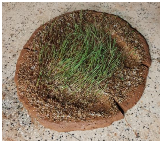
Imagem 3. Superfície de barro após interferência da ação performática, 2023.

Nesta fase da pesquisa, os pensamentos de Leda Maria Martins tornaram possível investigar as “inter-relações entre corpo, tempo, performance, memória e produção de saberes, principalmente os que instituem por vias da corporeidade” (Martins, 2021, p.22), evidenciando assim, o vínculo entre artes efêmeras e o corpo.