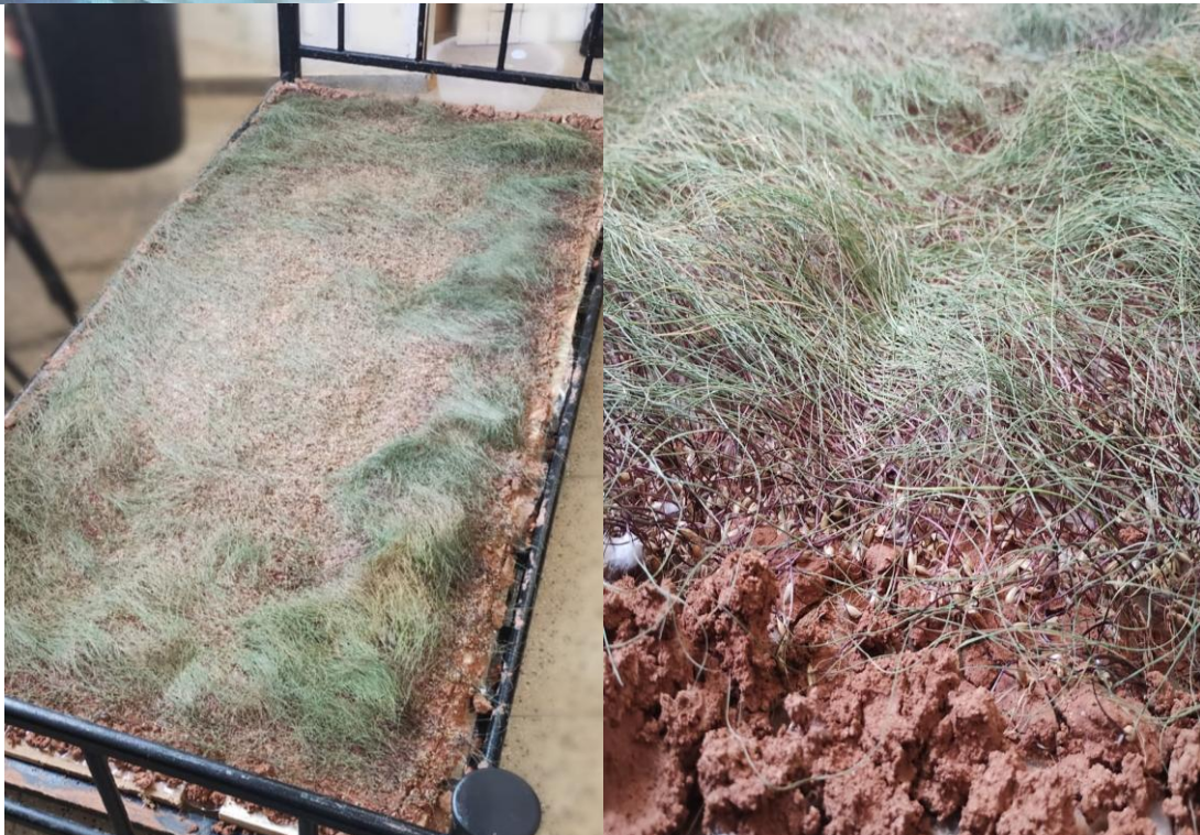
Imagem 8 e 9. Vestígios modificados da performance Marcas que (Des)envolvem , 2024.