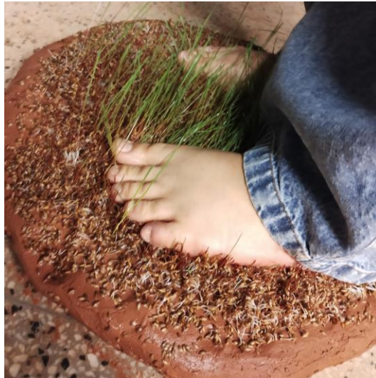
Imagem 2. Ação performática sobre sementes germinadas, 2023.

Essa sensibilidade estética diante das manifestações naturais é apontada por Humboldt (2009) como um fator capaz de despertar no indivíduo um prazer particular, resultante da contemplação da vegetação e das sensações subjetivas que ela provoca. E que então, na experiência performática esta percepção pode se ampliar.