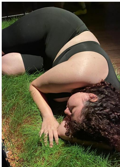
Imagem 6. Registro da performance Marcas que (Des)envolvem , 2024.

A imprevisibilidade se uniu à poética, não apenas no processo de construção do “objeto/microambiente”, como também na aproximação performática da artista, valorizando a impressão da sensibilidade com aquele ambiente e o contexto como um todo manifestava.