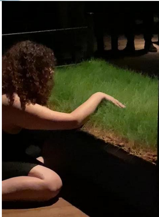
Imagem 5. Registro da performance Marcas que (Des)envolvem , 2024.

Diferentemente da instalação anterior - que como primeiro contato com aquela materialidade, a ação se mostrava mais racional, parecendo ser dominada buscando um efeito específico e no qual a preocupando estava mais com a visualidade - o desdobramento desse trabalho em performance mudou e isso se revelou na forma e na silhueta do corpo sobre o “objeto/microambiente”. Esse trabalho não relaciona-se mais com uma espécie de racionalismo, neste momento, o deitar criou marcas na cama coberta de gramíneas que delinearão uma posição que remetia ao recolhimento fetal e expressavam uma associação com os sonhos, a não racionalidade que os pés e mãos expressam, algo que remete também a este contínuo vínculo ao trabalho.