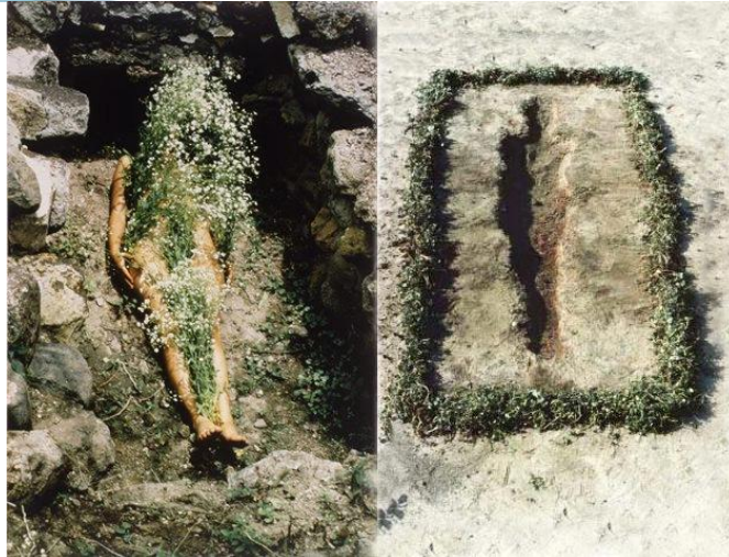
Imagem 4. Série Siluetas , Ana Mendieta, 1973.

Novamente, todo o percurso evidenciou que, em cada etapa - desde os cuidados cotidianos até as escolhas feitas para favorecer a germinação - a presença e interferência do corpo da artista se manifestaram sobre esses pequenos seres vivos (as sementes), mesmo nos momentos em que não havia contato direto. O ato de espalhar o alpiste sobre a terra, regá-lo diariamente e posicionar a cama em um local propício à incidência solar reforçou essa relação de influência e cuidado.