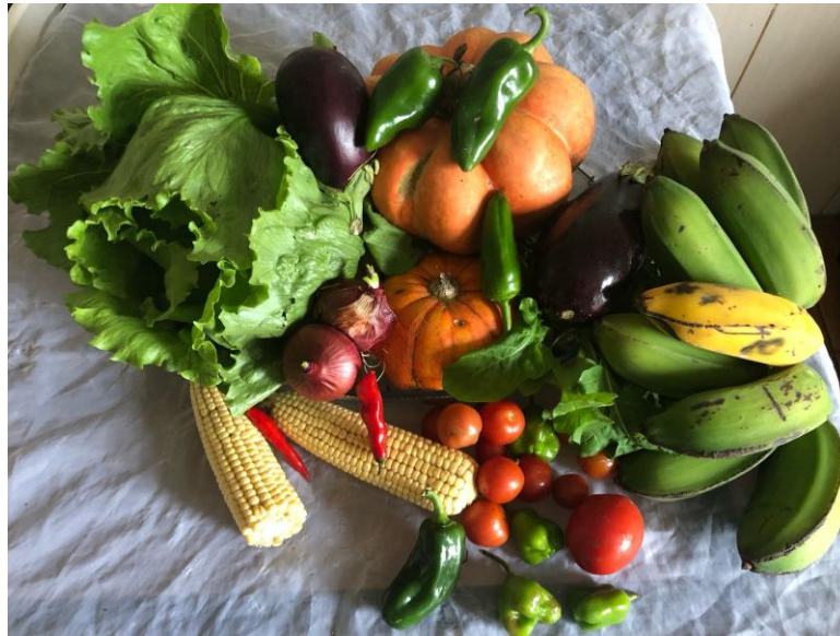
Imagem 2. Ingredientes para um sopão, 2025. Imagem digital. Dimensões: 10 cm x 10 cm.

pelo processo, sendo desafiada a deslocar suas referências e construir uma escuta radical, conforme propõe Paulo Freire, em que educar é também se deixar educar.