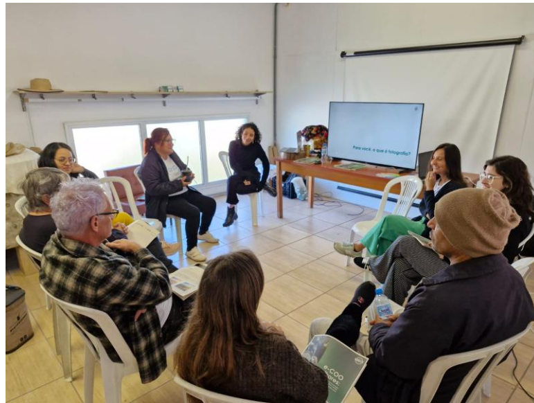
Imagem 1. Primeiro encontro do projeto e-COO olhares , 2025. Imagem digital. Dimensões: 10 cm x 10 cm.

agricultoras possuem potencial para narrar, através da imagem, a complexidade de seus cotidianos, culturas e práticas produtivas, gerando uma contra-narrativa frente às imagens hegemônicas veiculadas pelas grandes mídias e plataformas digitais.