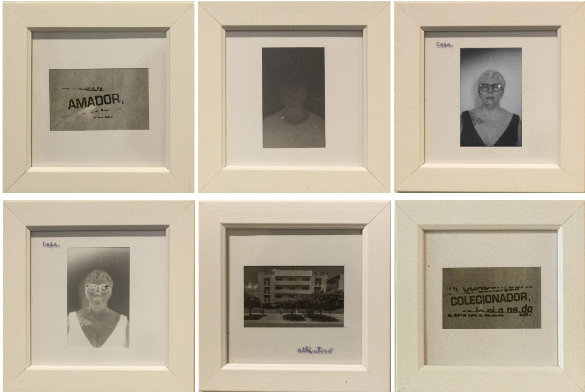
Imagem 2: Luciana Padilha, “Pequena Coleção das Dores – Colecionadora”, conjunto de seis fotografias lambe-lambe e fotogramas (positivos e negativos). Dimensões individuais sem moldura: 6 × 9 cm; com moldura: 12 × 12 cm. Olinda, 2025.