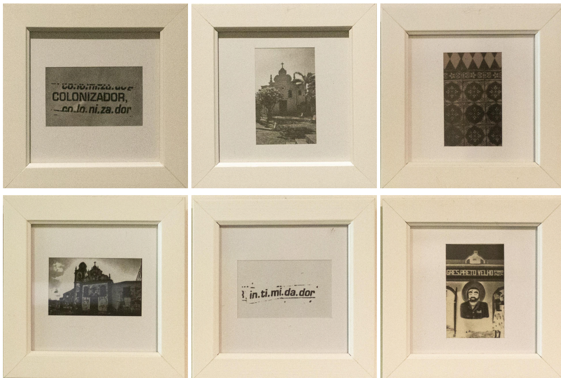
Imagem 4: Luciana Padilha, “Pequena Coleção das Dores – Colonizador”, conjunto de seis fotografias lambe-lambe e fotogramas (positivos e negativos). Dimensões individuais sem moldura: 6 × 9 cm; com moldura: 12 × 12 cm. Olinda, 2025.