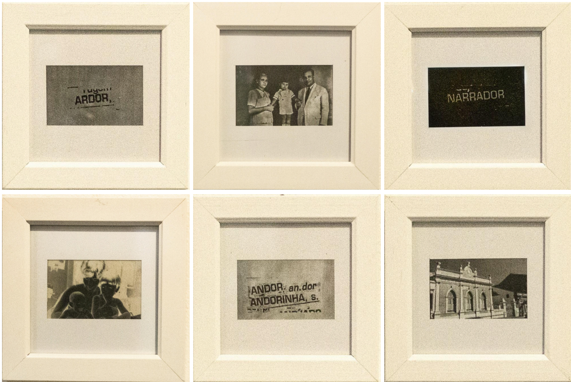
Imagem 5: Luciana Padilha, “Pequena Coleção das Dores – Andorinha”, conjunto de seis fotografias lambe-lambe e fotogramas (positivos e negativos). Dimensões individuais sem moldura: 6 × 9 cm; com moldura: 12 × 12 cm. Olinda, 2025.