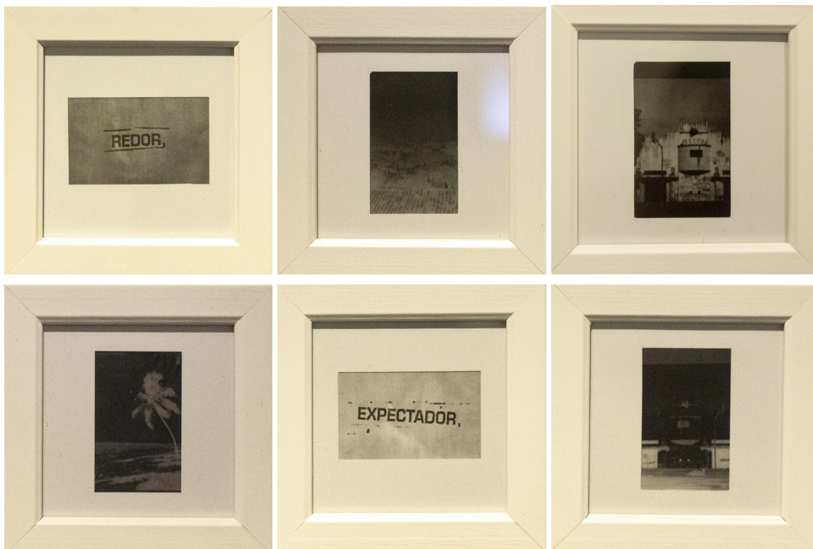
Imagem 3: Luciana Padilha, “Pequena Coleção das Dores – Expectadora”, conjunto de seis fotografias lambe-lambe e fotogramas (positivos e negativos). Dimensões individuais sem moldura: 6 × 9 cm; com moldura: 12 × 12 cm. Olinda, 2025.