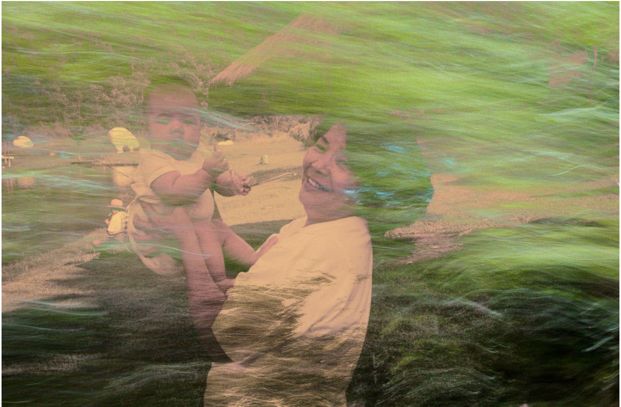
Imagem 2. Isabela Akemi, Galgamento II, Sobreposição fotográfica, 29,7 x 42 cm, Uberlândia, MG, 2025.