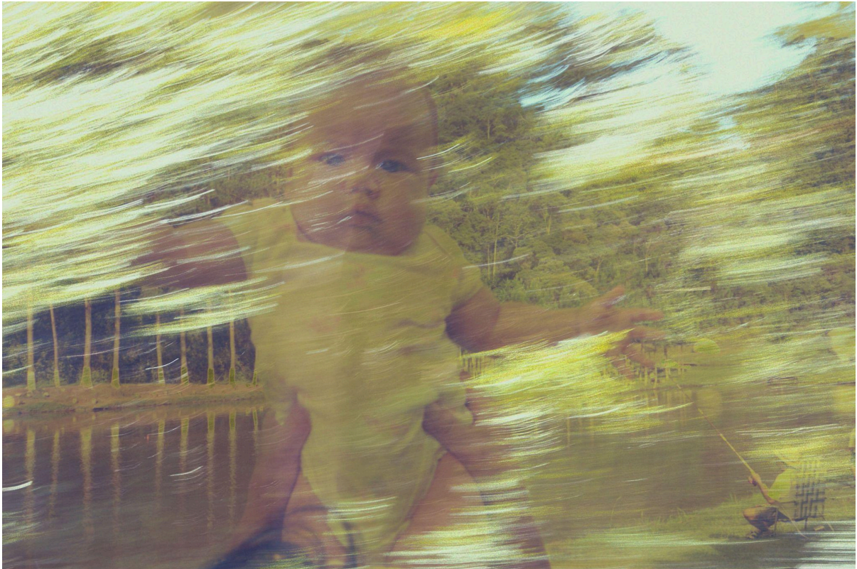
Imagem 1. Isabela Akemi, Galgamento I, Sobreposição fotográfica, 29,7 x 42 cm, Uberlândia, MG, 2025.