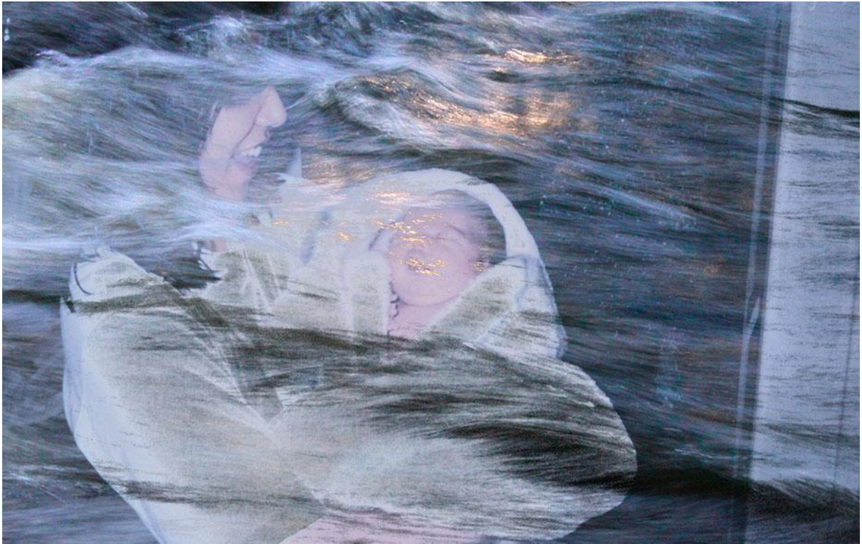
Imagem 4. Isabela Akemi, Galgamento IV, Sobreposição fotográfica, 29,7 x 42 cm, Uberlândia, MG, 2025.