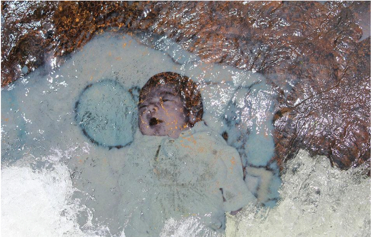
Imagem 5. Isabela Akemi, Galgamento V, Sobreposição fotográfica, 29,7 x 42 cm, Uberlândia, MG, 2025.