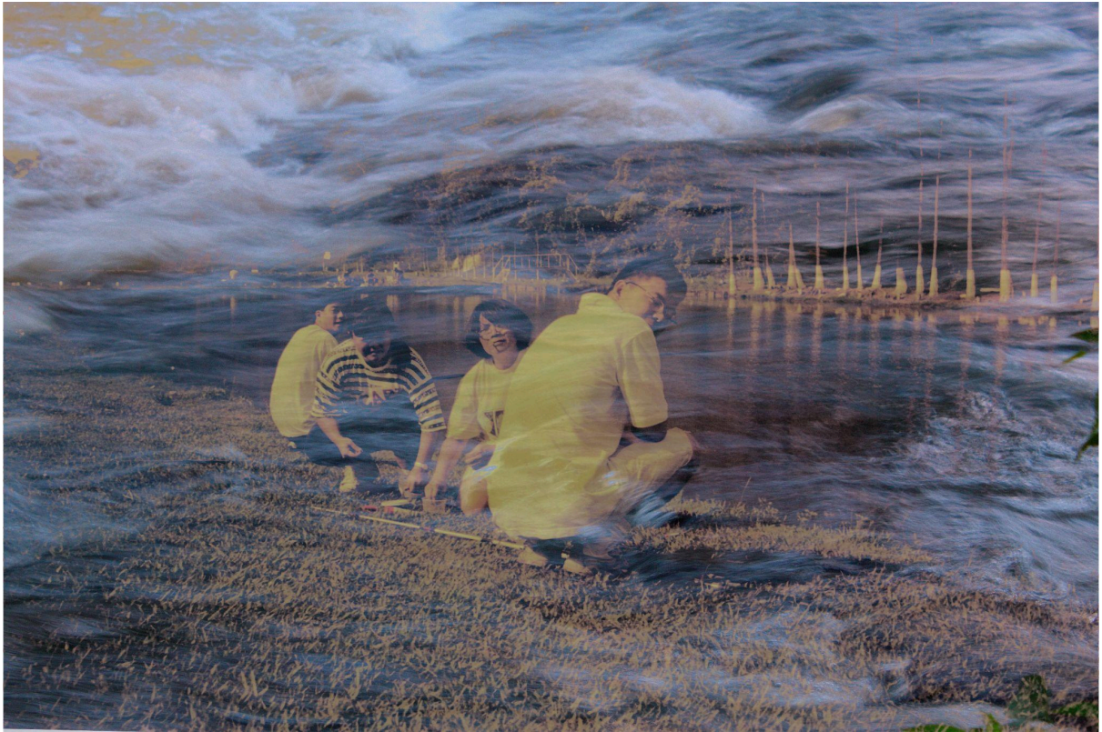
Imagem 3. Isabela Akemi, Galgamento III, Sobreposição fotográfica, 29,7 x 42 cm, Uberlândia, MG, 2025.