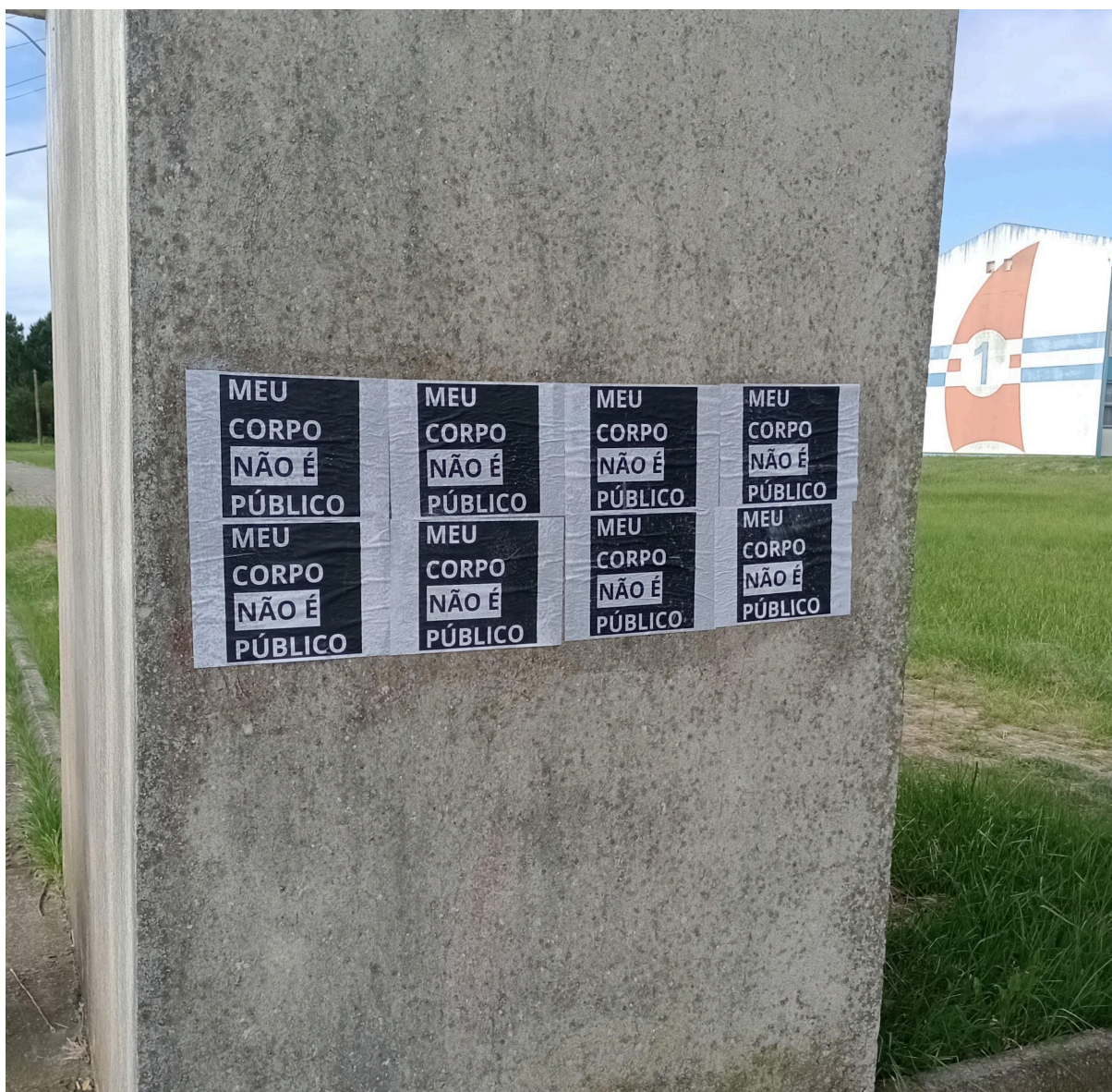
Imagem 3. Melissa Sobczyk e Ingrid Silva, meu corpo não é público: a repetição como reafirmação, fotografia, 3040 x 2968 px, Rio Grande (RS), 2023.