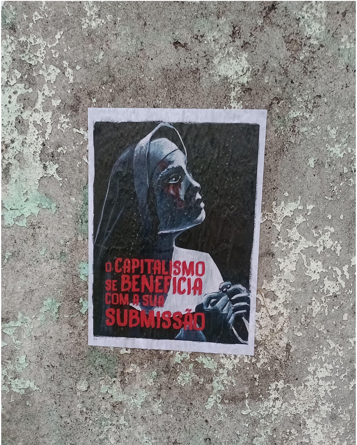
Imagem 8. Melissa Sobczyk, a conclusão: o capitalismo se beneficia com a sua submissão, fotografia, 2682 x 3368 px, Rio Grande (RS), 2024.