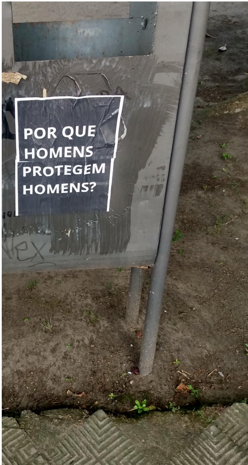
Imagem 4. Melissa Sobczyk e Ingrid Silva, é preciso estar em todos os lugares: colamos em diversos lugares além das paredes, fotografia, 1549 x 2908 px, Rio Grande (RS), 2023.