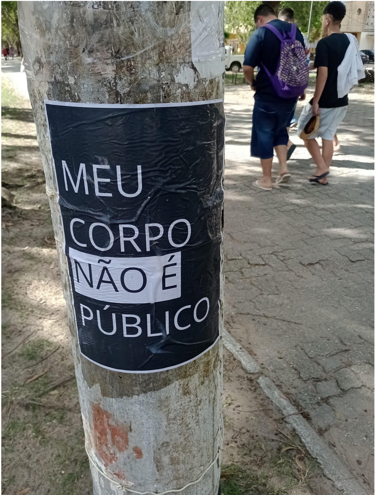
Imagem 2. Melissa Sobczyk e Ingrid Silva, meu corpo não é público, fotografia, 3072 x 4080 px, Rio Grande (RS), 2023.