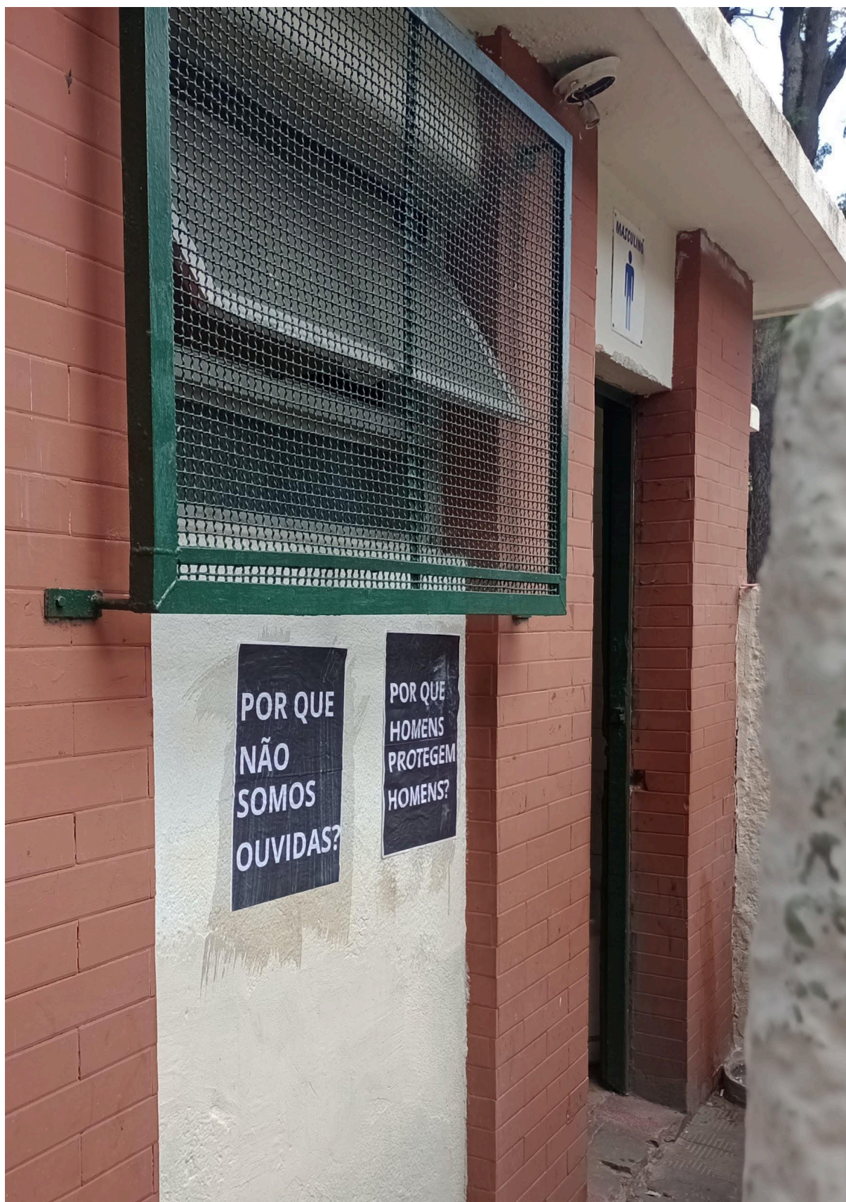
Imagem 5. Melissa Sobczyk e Ingrid Silva, cartazes no banheiro masculino, fotografia, 2481 x 3518 px, Rio Grande (RS), 2023.