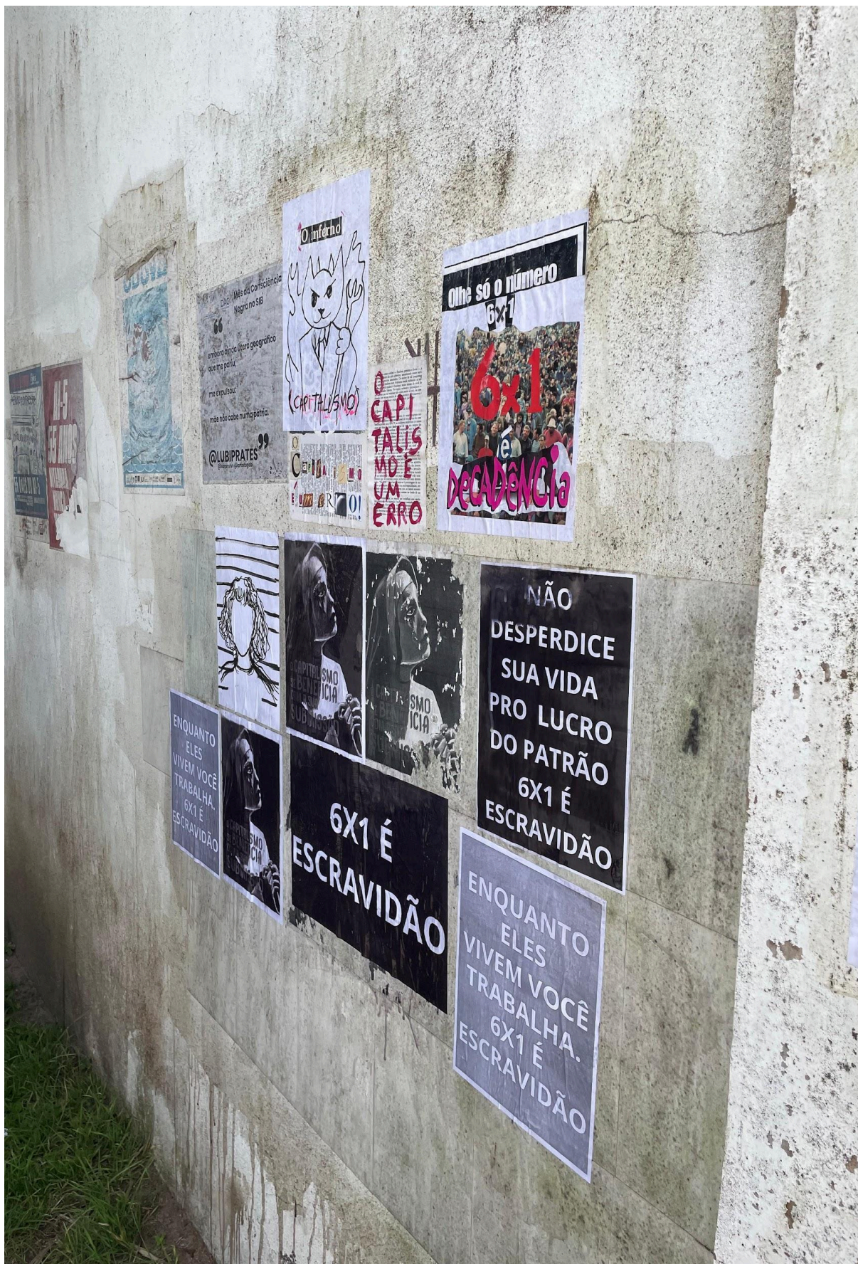
Imagem 7. Melissa Sobczyk e Ingrid Silva, parede de lambe-lambes contra a escala 6x1, fotografia, 3024 x 4032 px, Rio Grande (RS), 2024.