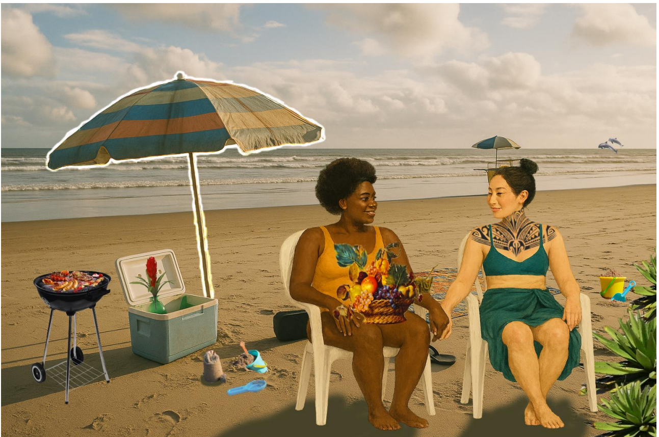
Imagem 4. Murilo Borges, Feriado na Praia. Colagem digital, 17cm X 11cm, Rio Grande - RS, 2025.