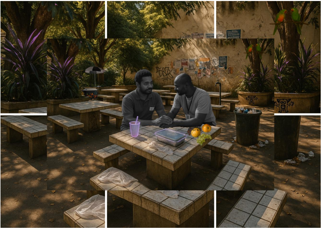
Imagem 3. Murilo Borges, Horário de almoço. Colagem digital, 17cm X 12cm, Rio Grande - RS, 2025.