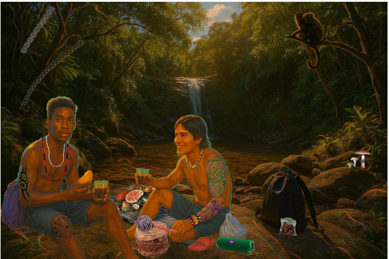
Imagem 2. Murilo Borges, Café da manhã na beira da cachoeira. Colagem digital, 17cm X 11cm, Rio Grande - RS, 2025.