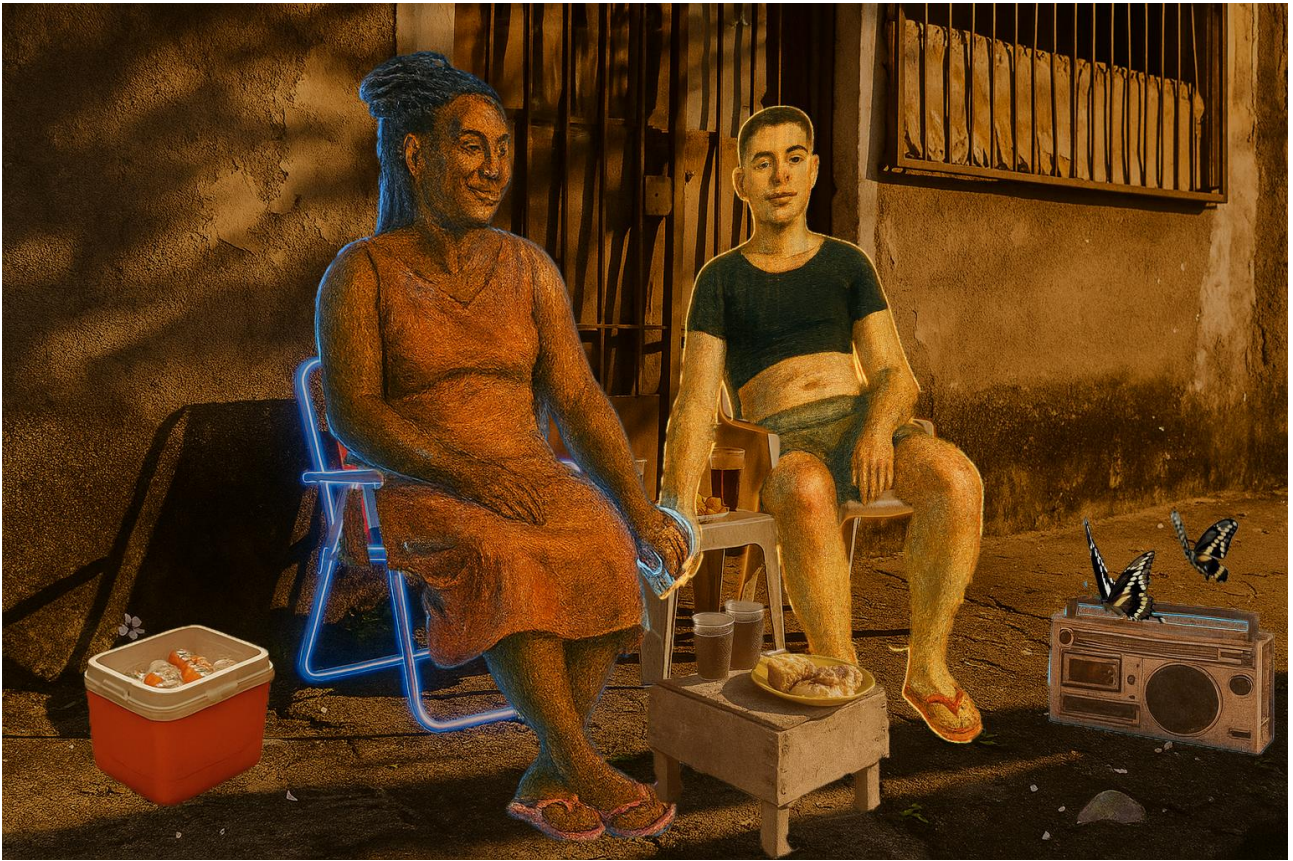
Imagem 5. Murilo Borges, Fim de tarde na calçada. Colagem digital, 17cm X 11cm, Rio Grande - RS, 2025.