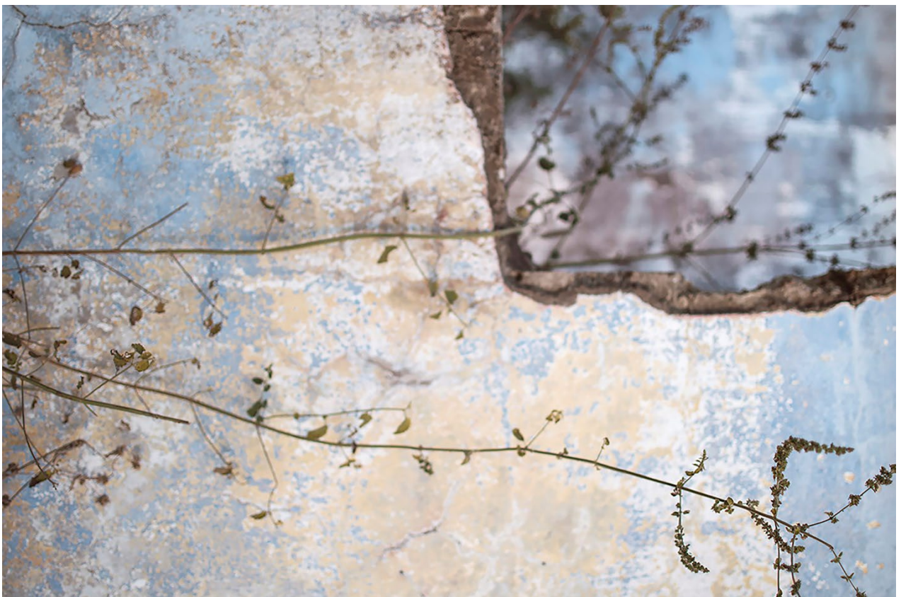
Imagem 4. Tainá Xavier, fotografia 4 da série “sobre escombros e poesia”, 2017. Fotografia Digital, 40cmX27,11cm. Goiás, 2017.