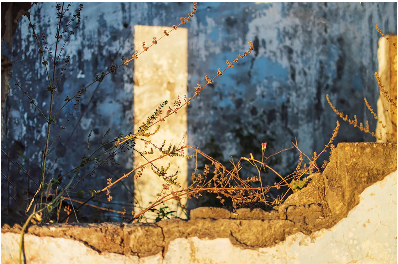
Imagem 6. Tainá Xavier, fotografia 6 da série “sobre escombros e poesia”, 2017. Fotografia Digital, 40cmX27,11cm. Goiás, 2017.