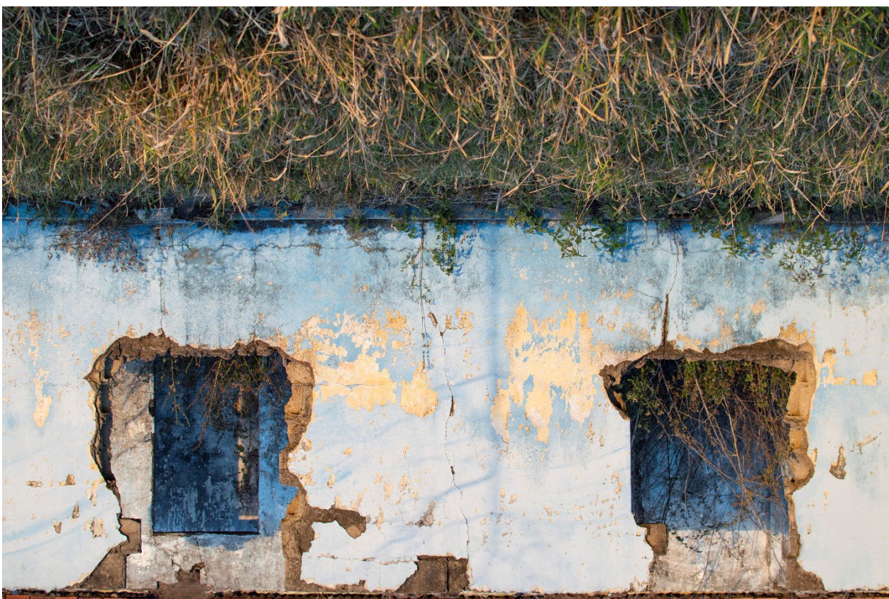
Imagem 8. Tainá Xavier, fotografia 8 da série “sobre escombros e poesia”, 2017. Fotografia Digital, 40cmX27,11cm. Goiás, 2017.