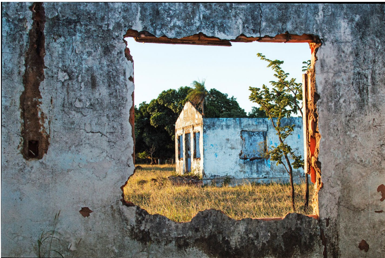
Imagem 7. Tainá Xavier, fotografia 7 da série “sobre escombros e poesia”, 2017. Fotografia Digital, 40cmX27,11cm. Goiás, 2017.