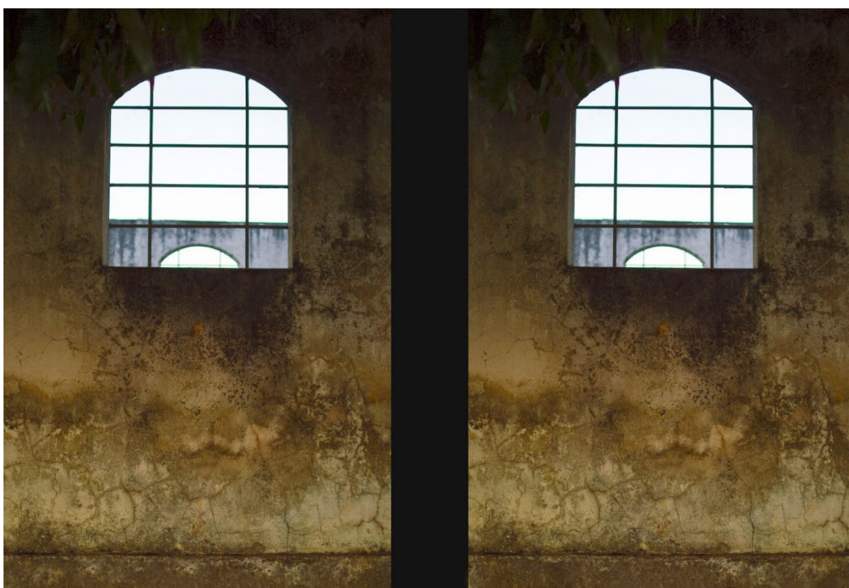
Imagem 2. Tainá Xavier, fotografia 2 da série “sobre escombros e poesia”, 2017. Fotografia Digital, 40cmX27,11cm. Goiás, 2017.