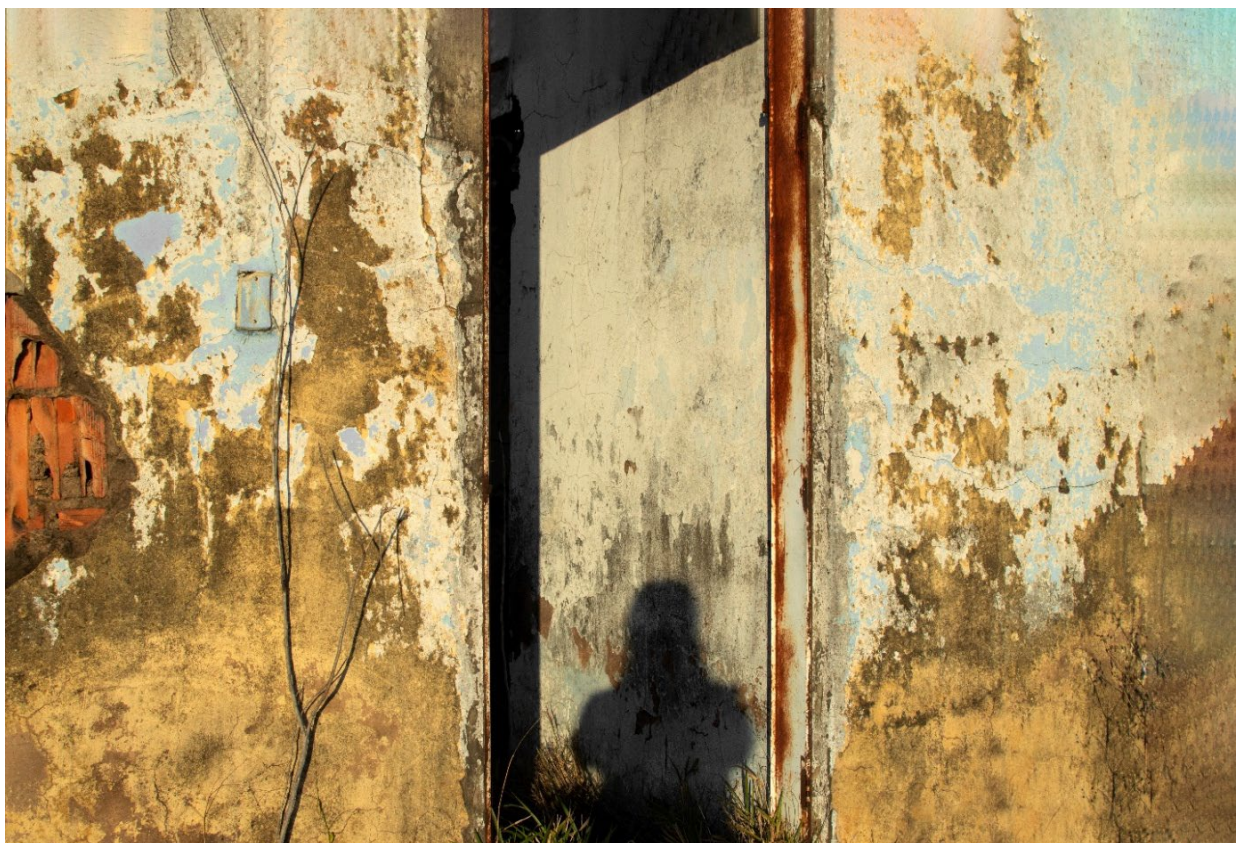
Imagem 1. Tainá Xavier, fotografia 1 da série “sobre escombros e poesia”, 2017. Fotografia Digital, 40cmX27,11cm. Goiás, 2017.