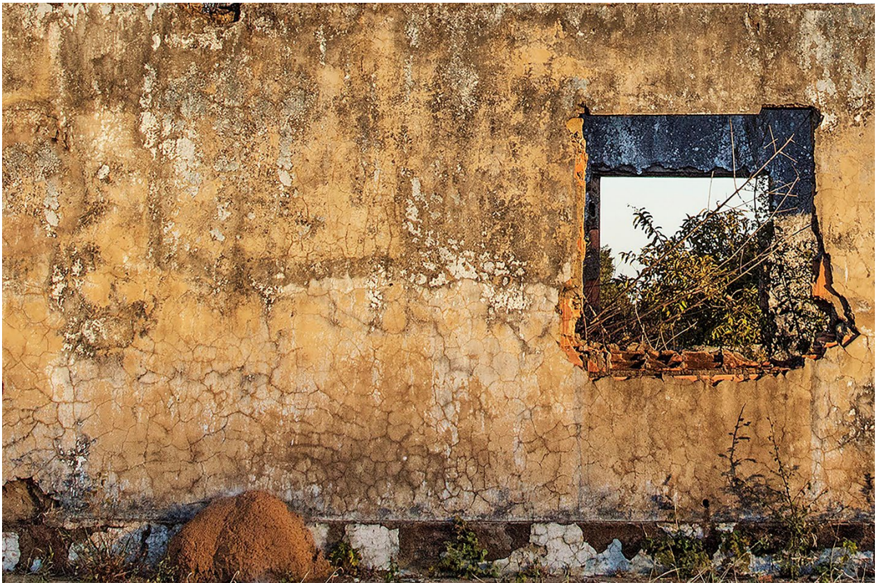
Imagem 5. Tainá Xavier, fotografia 5 da série “sobre escombros e poesia”, 2017. Fotografia Digital, 40cmX27,11cm. Goiás, 2017.