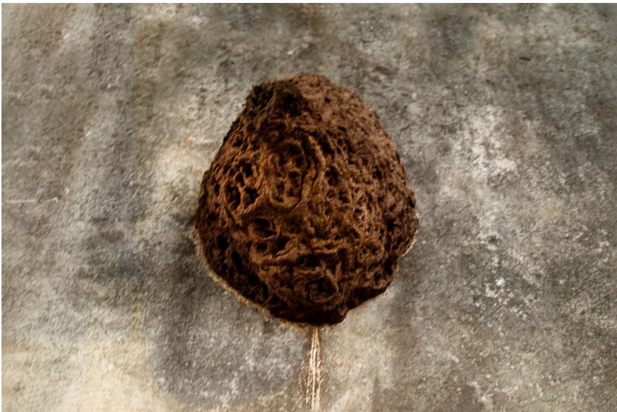
Imagem 9. Tainá Xavier, fotografia 9 da série “sobre escombros e poesia”, 2017. Fotografia Digital, 40cmX27,11cm. Goiás, 2017.