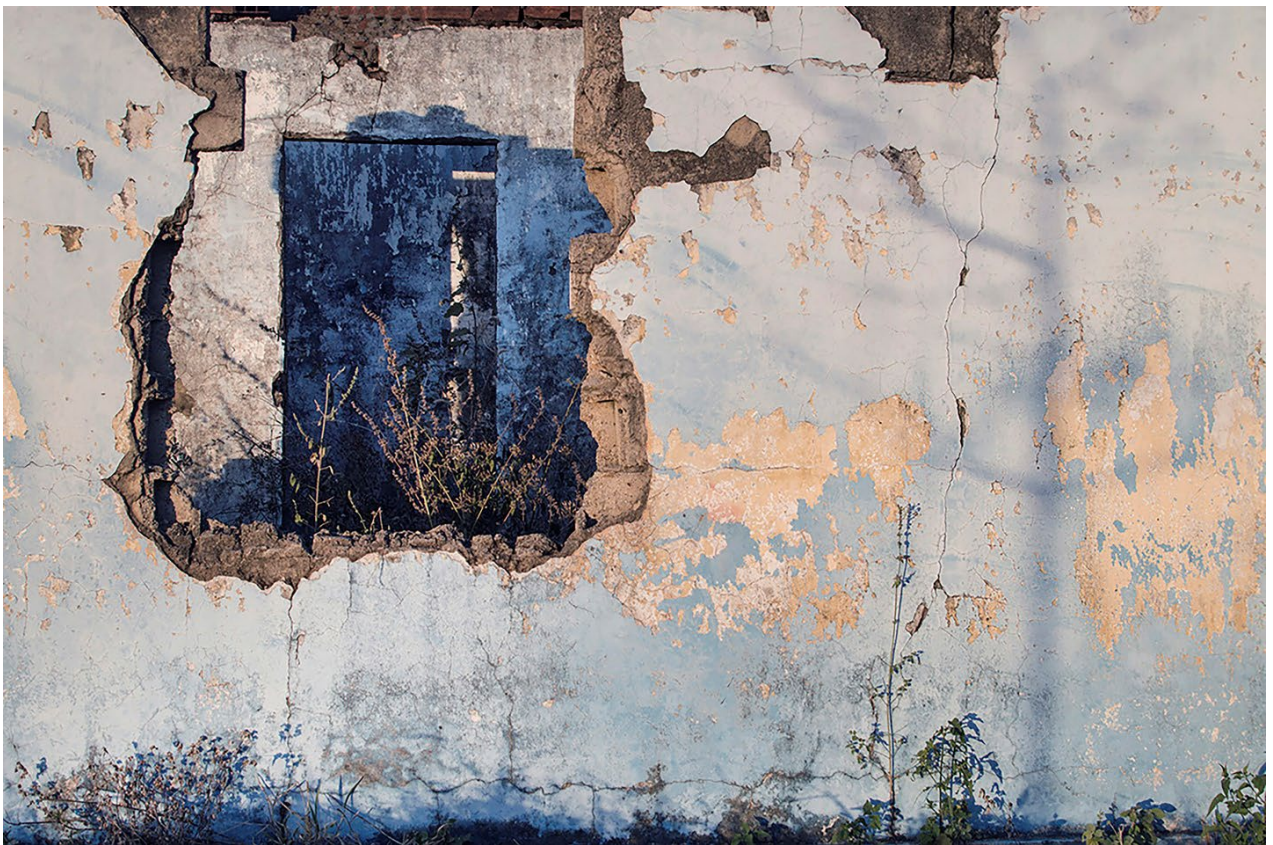
Imagem 3. Tainá Xavier, fotografia 3 da série “sobre escombros e poesia”, 2017. Fotografia Digital, 40cmX27,11cm. Goiás, 2017.