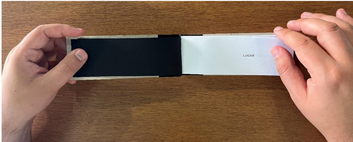
Imagem 4. Fernanda Fedrizzi, _____ lugar _____, 2023. Publicação, 15,85 x 6 x 2 cm.