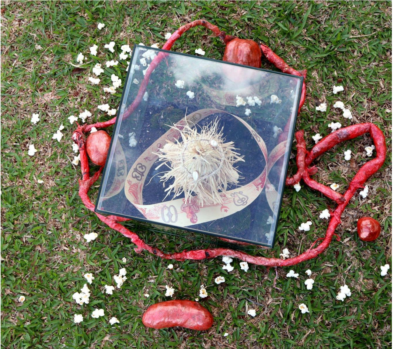
Imagem 4 - Diogo Nogue. Se não Hoje, Quando?, búzios, sisal, vidro, cerâmica, terra, papel, pipoca e plástico pvc. 70 x 70 cm. São Paulo, 2024.