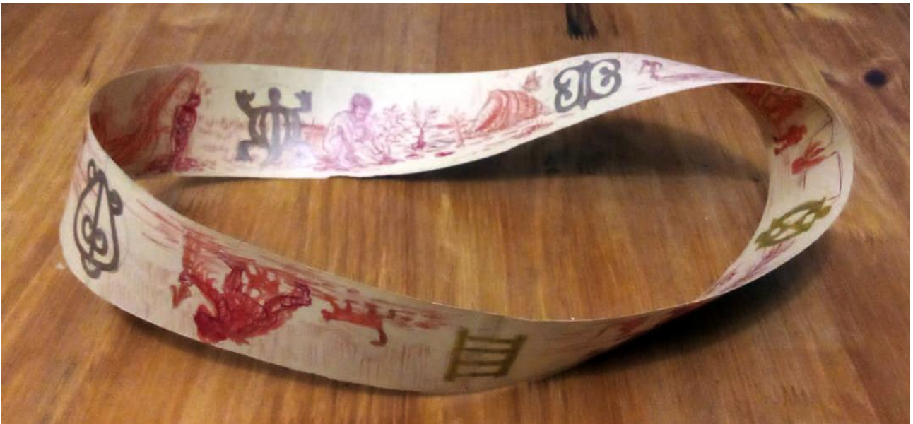
Imagem 2 - Diogo Nogue. Fita de Möbius, caneta, lápis de cor e marcadores sobre papel, São Paulo, 2024.