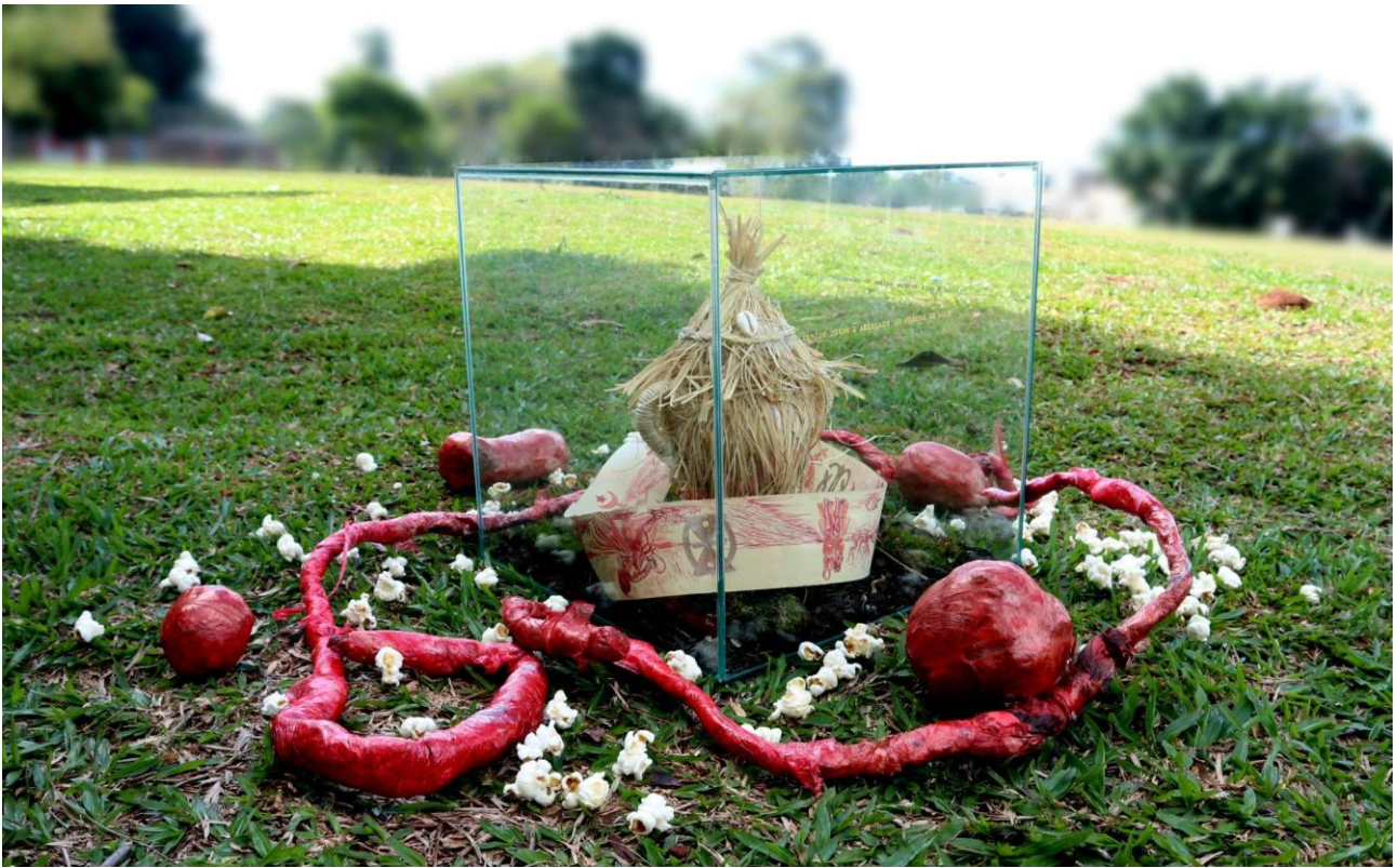
Imagem 5 - Diogo Nogue. Se não Hoje, Quando?, búzios, sisal, vidro, cerâmica, terra, papel, pipoca e plástico pvc. 70 x 70 cm. (detalhe) São Paulo, 2024.