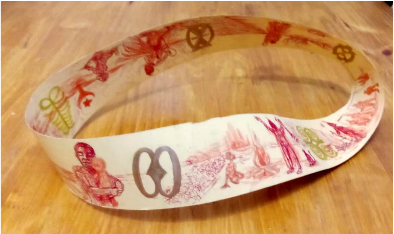
Imagem 1 - Diogo Nogueira. Fita de Möbius, caneta, lápis de cor e marcadores sobre papel, São Paulo, 2024.