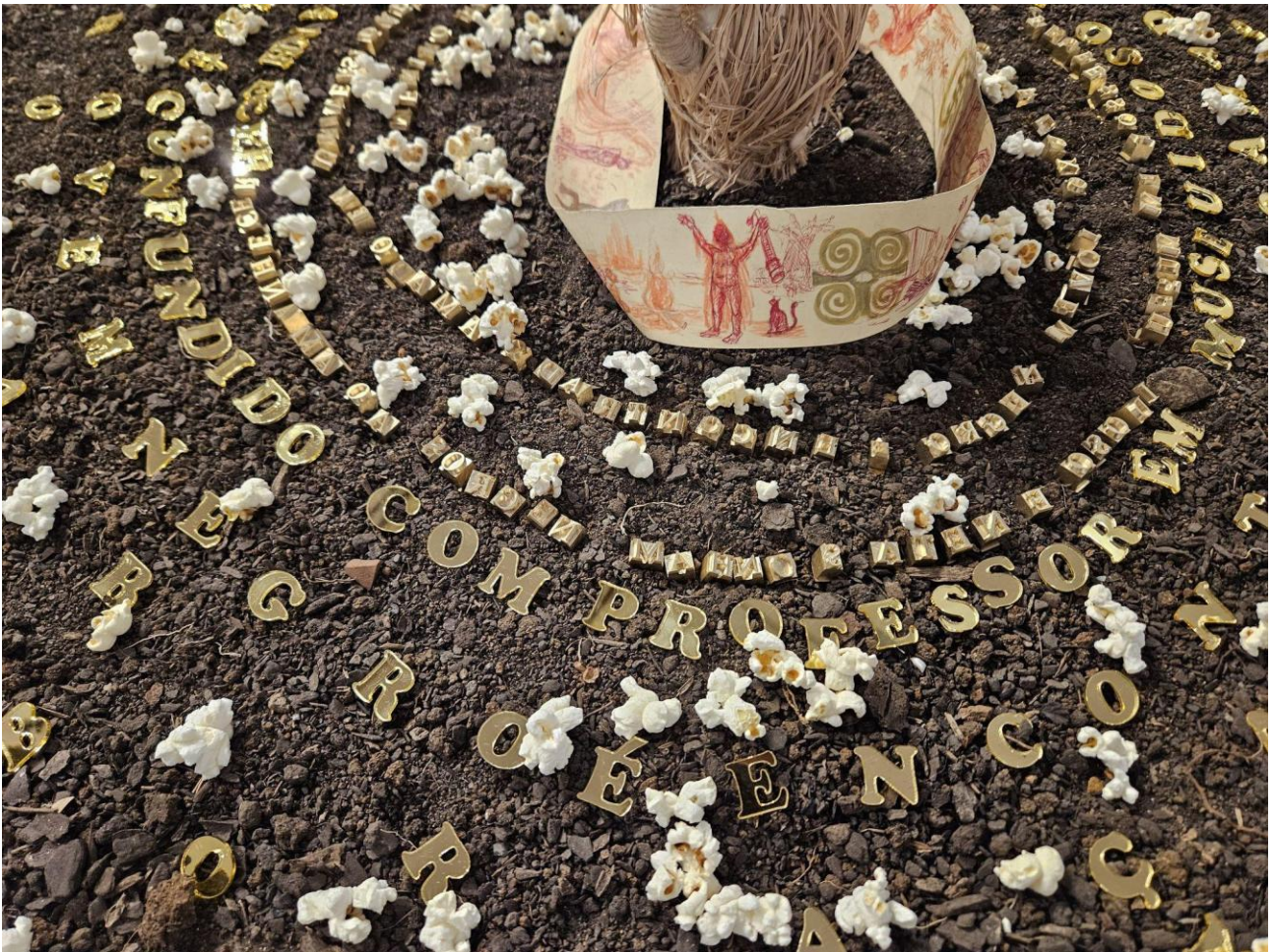
Imagem 6 - Diogo Nogueira. Se não Hoje, Quando? II, búzios, sisal, cerâmica, terra, pipoca, acrílico e latão. 70 x 70 x 25 cm (detalhe) São Paulo, 2024. Foto: Diogo Nogueira, 2024