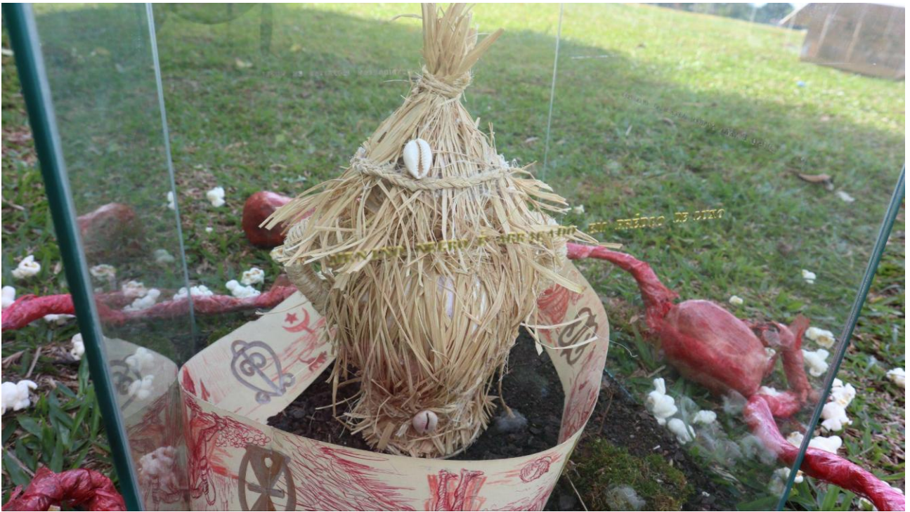
Imagem 3 - Diogo Nogue. Se não Hoje, Quando?, búzios, sisal, vidro, cerâmica, terra, papel, pipoca e plástico pvc. 70 x 70 cm. (detalhe) São Paulo, 2024.