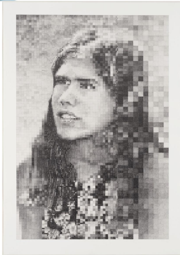
Imagem 1.