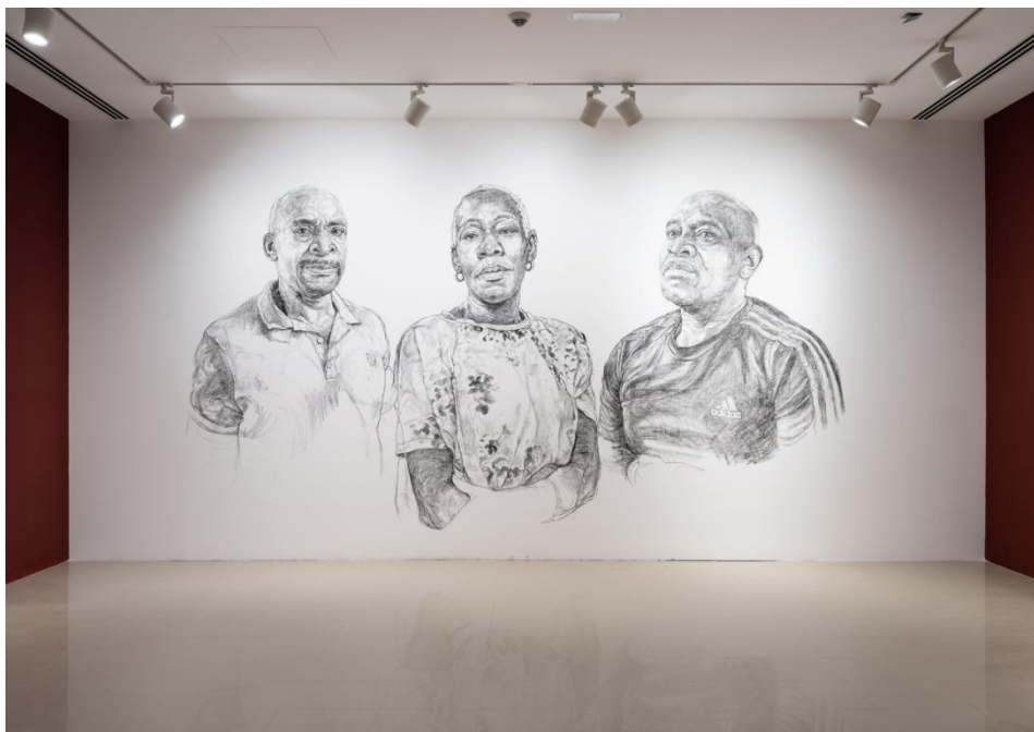
Imagem 6. Barbara Walker.

ela considera importantes, mas não tiveram o reconhecimento merecido e as desenha em escala monumental direto na parede usando carvão como técnica.