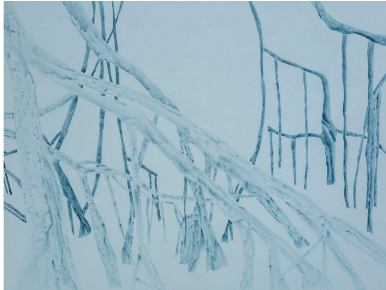
Imagem 4. Irene Kopelman.