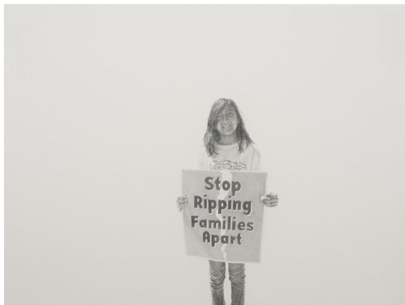
Imagem 2. Andrea Bowers, Estudo da Marcha do Dia do Trabalho, Los Angeles, 2010 (Parem de Destruir Famílias).