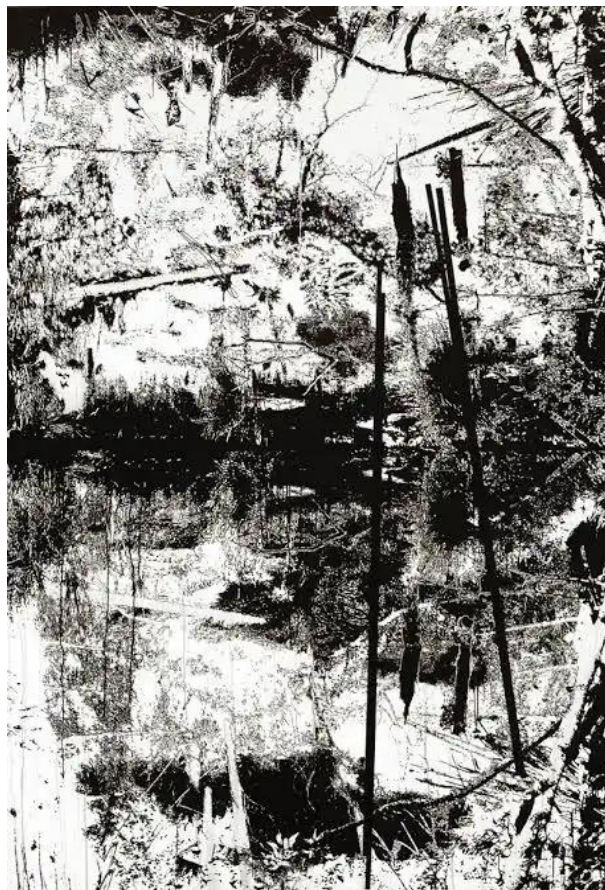
Imagem 5. Yehudit Sasportas.

Outra artista que trabalha o desenho no espaço, como uma instalação é a britânica Bárbara Walker (imagem 6), que pesquisa em arquivos históricos pessoas negras que