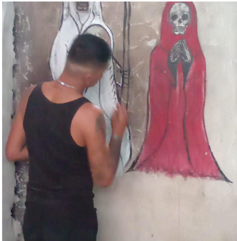
Imagem 10. A arte de se refazer - A comunidade aposta na arte como caminho para reestabelecimento e união do templo, 2024. Digital, 10cm X 10cm. Xalapa.