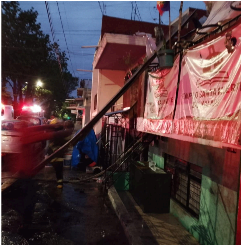
Imagem 5. Correria e incêndio no Templo, 2024. Digital, 10cm X 10cm. Xalapa.