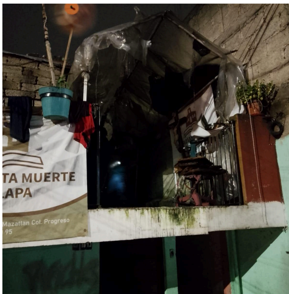
Imagem 2. Fachada do templo incendiado, 2024. Digital, 10cm X 10cm. Xalapa.