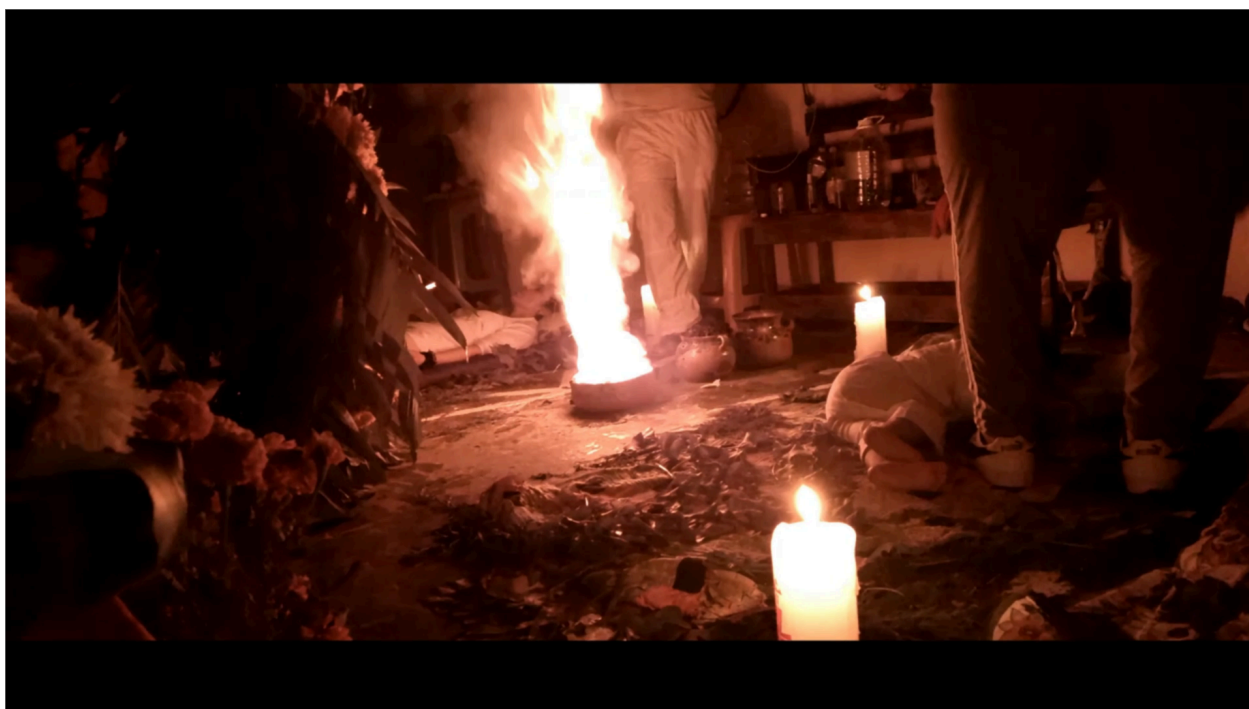
Imagem 4. Ritual de dia dos mortos, 2024. Still digital, Frame do curta "Santa Muerte - El culto a Mictecacihuatl 6'15". 1920 X 1080px. Xalapa.