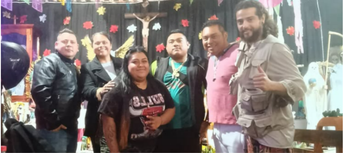
Imagem 9. “Taller de Video Santa Muerte Xalapa” - Oficina de audiovisual gratuita realizada na comunidade para defesa patrimonial e legalização da comunidade, 2025. Digital, 1080 X 566px. Xalapa.