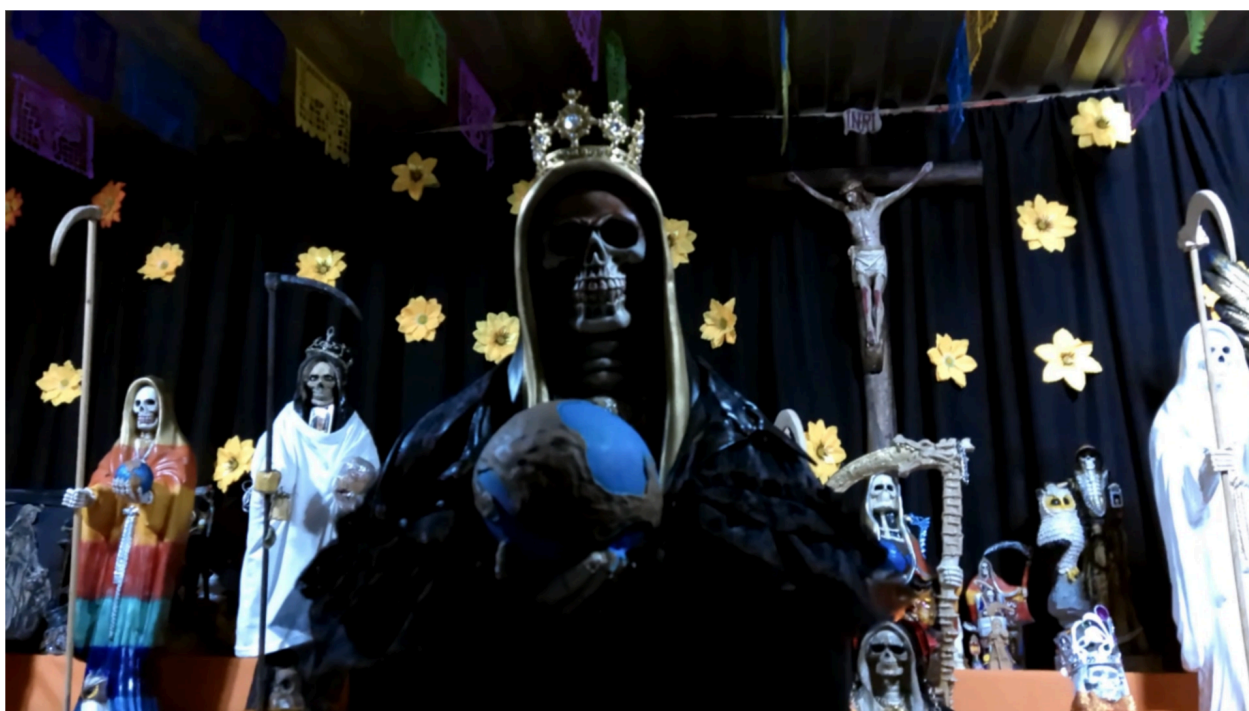
Imagem 1. Santa Muerte, 2024. Still digital, Frame do curta "Santa Muerte - El culto a Mictecacihuatl 6'15". 1920 X 1080px. Xalapa.