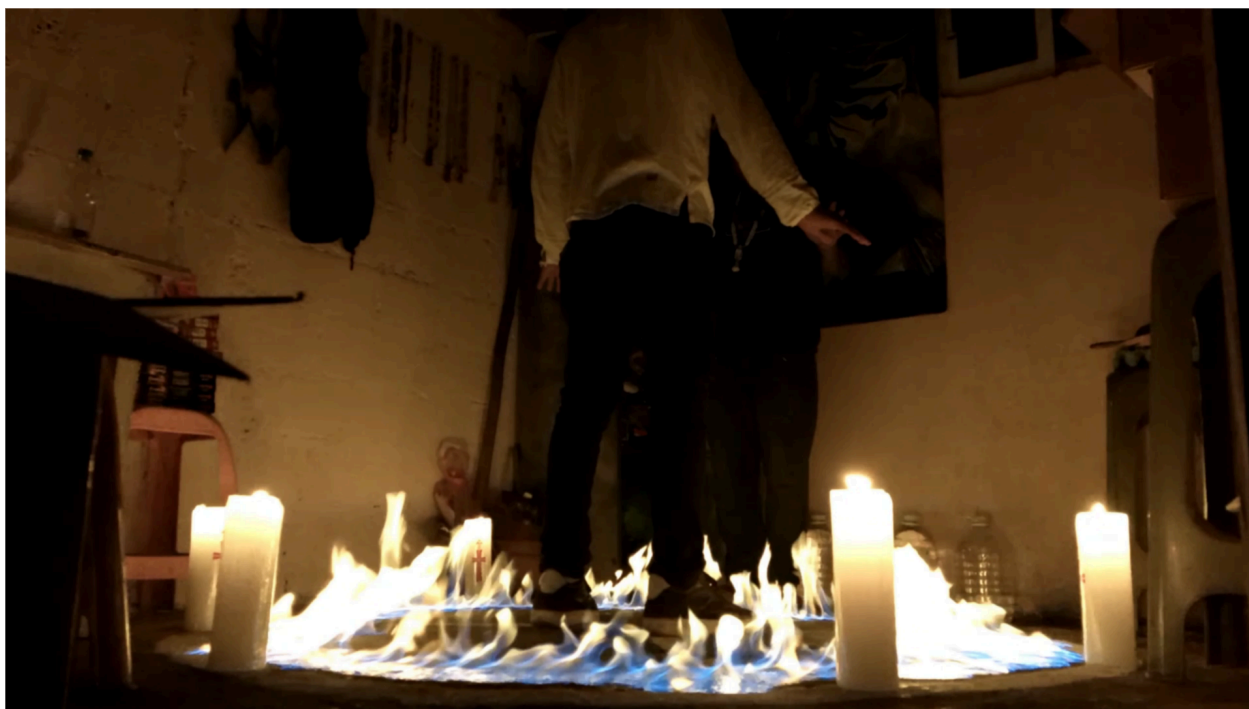
Imagem 3. Limpeza espiritual, 2024. Still digital, Frame do curta "Santa Muerte - El culto a Mictecacihuatl 6'15". Xalapa, Foto: Bruno Karasiaki Filene.