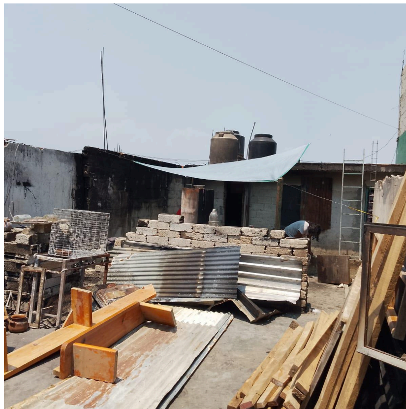
Imagem 8. Reconstrução do Templo, 2024. Digital, 10cm X 10cm. Xalapa.