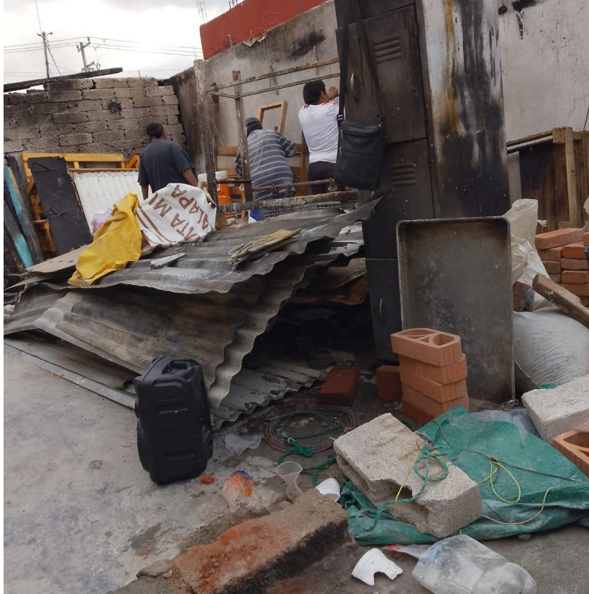
Imagem 7. Mutirão comunitário, 2024. Digital, 10cm X 10cm. Xalapa.