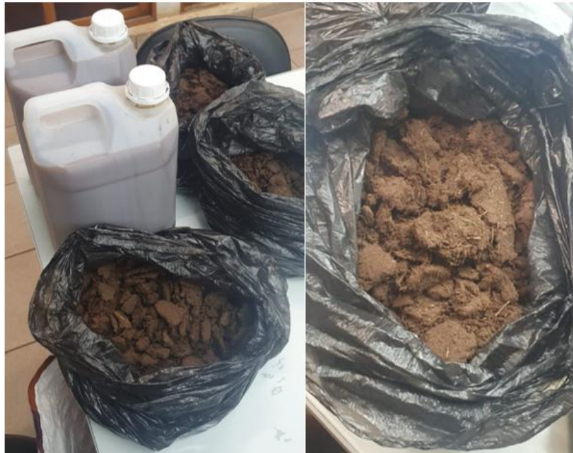
Figura 1: Substratos coletados.