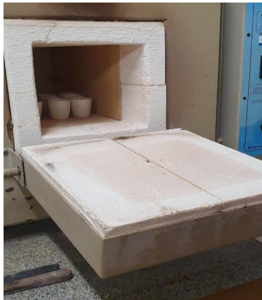
Figura 2: Cadinhos na mufla para análise de STV e STF.

Um dos parâmetros analisados foi o teor de sólidos presentes nas amostras, sendo estes sólidos totais (ST), sólidos totais voláteis (STV) e sólidos totais fixos (STF). Com isso, obtém-se também o teor de umidade (UM) das amostras. Essas análises seguiram como base conceitos de gravimetria, conforme sugere Standard Methods 2540-B (APHA, 2005). Para a quantificação de ST, as amostras foram submetidas a temperatura de 105°C em estufa até que atingissem massa constante. Após isso, as amostras secas foram submetidas a temperatura de 550°C em mufla, também até atingirem massas constantes, de maneira a quantificar os STF e STV. A Figura 2 exhibe os cadinhos com as amostras sendo incinerados em na mufla.