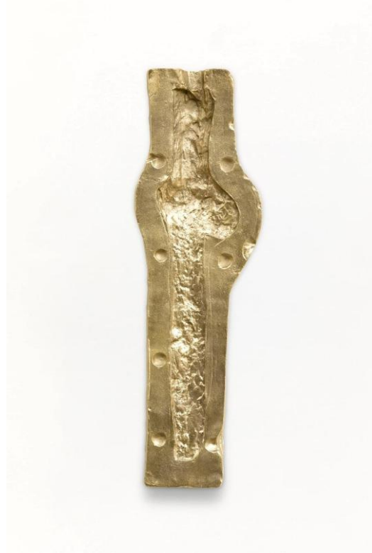
Imagem 2: Adriano Costa, The House of God . Bronze, 51 x 16 x 3 cm, 2022. Fonte: Mendes Wood ii

Sobre a brincadeira da criança e sua relação com a perda, Didi-Huberman cita a observação de Freud, abordada aqui, associando-a com o luto de duas meninas que acabavam de perder sua mãe, situação narrada por Pierre Fédida. Enquanto brincavam com um lençol, fazendo dele uma espécie de mortalha, as meninas se revezavam na representação da velada. Diante do medo da desapareição, mesmo que simulada, o choro se faz presente mas, logo em seguida, ao desvendar a brincadeira o riso surge e o lençol se transforma em toda a sorte de objetos imaginários, desde bandeiras até vestidos, enquanto "torcendo-se de rir" liberam imagens que estão para além do princípio da dor ou do prazer, produzindo um lugar e um objeto simbólico de substituição: