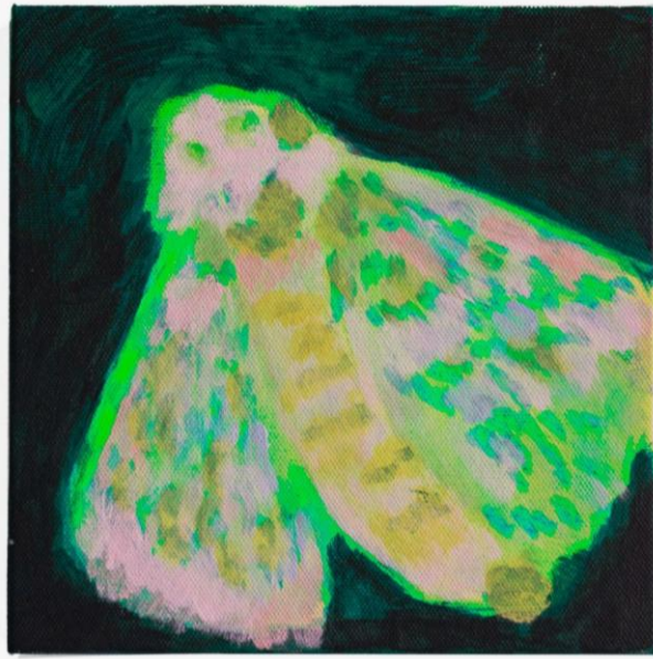
Imagem 5: Pietro Espíndula, Premonição. Acrílica sobre tela, 20 x 20 cm, 2024.