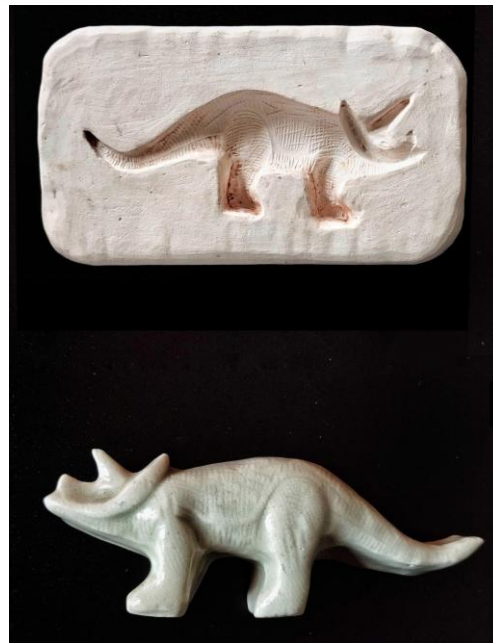
Imagem 1. Pietro Espíndula, Todo amor há de ser fossilizado. Forma de gesso e objeto de cerâmica, 5x13x2,5cm, 2024.

Pietro busca como referência as produções do artista Adriano Costa (São Paulo), que influencia uma percepção sobre misturas de matérias e materiais variados, desierarquizando seus usos, os modos de montar e dispor objetos. Costa utiliza paredes, teto, chão e encontros entre paredes e chão, sem, no entanto, empregar pedestais e suportes tradicionais. Enfatiza a desierarquização também entre materiais, o que mostra possibilidades de desafiar modelos convencionais de expor, ao utilizar forma de bronze, por exemplo, para objetos descartados, banais ou inusitados (Imagem 2) e gestos também muito simples, como apenas deslocar, dobrar ou enrolar algo.