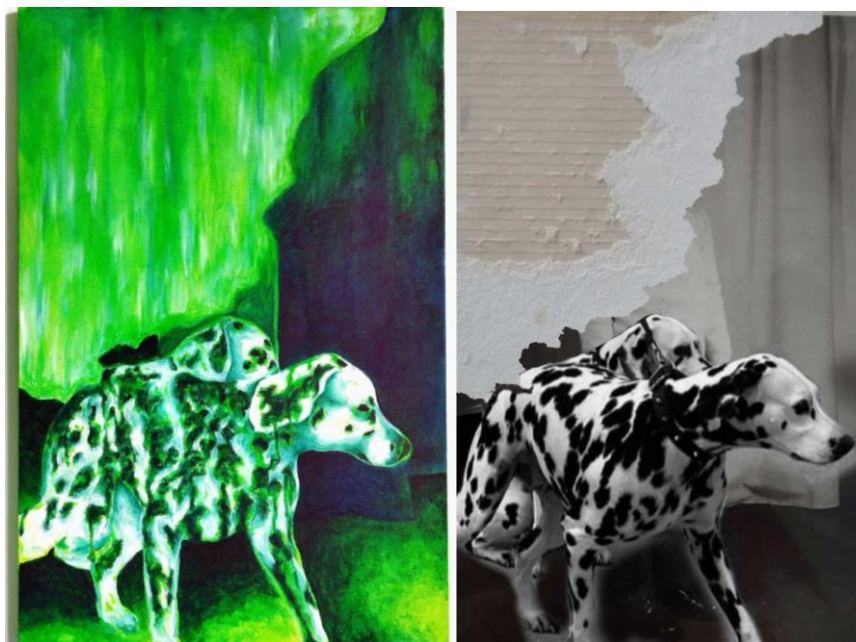
Imagem 4: Pietro Espíndula, à esquerda “Em busca de carinho”. Acrílica sobre tela, 90 x 60 cm, 2024, à direita fotografia rasgada encontrada em álbum de família.

reconstitui de modo simbólico enquanto busca superação. Não há recordações da casa da infância, nem tampouco da vizinhança, mas o grande dálmata encontra espaço na memória. Nesse sentido, as imagens visíveis que restaram nas fotografias atuam como disparadores sensoriais, tanto quanto as partes invisíveis extraídas a golpes. Esta última atua por sintoma, já que só apresenta indícios de gestos e materialidades que conversam com a imagem que sobrou.