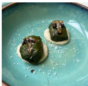
Figuras 1 a 4 - Menu Um Brasil Sustentável

O último passo, a sobremesa, introduz a invisibilidade feminina na cadeia do cacau, destacando seu protagonismo na agricultura familiar, uma vez que as mulheres ocupam um papel importante na organização familiar e sustento financeiro (Silva, 2022). O doce é uma trufa de chocolate vegana, feita com batata doce roxa e cacau, acompanhada de pó de casca de laranja, a fim de trazer textura, sabor, alinhando a problemática da sustentabilidade ao aproveitar o alimento de forma integral.