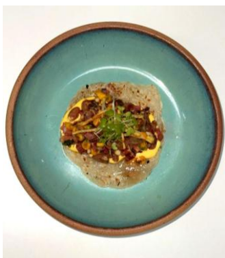
Figura 5 - Prato a base de tortilla

Ao criar um prato que contemplasse a importância da preservação da cultura e identidade locais, principalmente da agricultura e alimentação, utilizou-se de alimentos originários da América Latina, como símbolos de resistência à indústria dos ultraprocessados e suas ramificações. A preparação tem como base uma tortilla , alimento simbólico e estrutural para mexicanos, reinterpretada com mandioca, ingrediente emblemático da alimentação brasileira. O recheio é composto por feijão jalo, queijo coalho e linguiça suína, com inspiração no feijão tropeiro, preparo tradicional do sertão. A maionese de abóbora cabotiá é combinada com tucupi e gengibre, trazendo frescor e complexidade ao prato. Ele contempla também um vinagrete de tomate com milho e coentro, e, por fim, chips de batata finalizam a montagem, destacando um ingrediente amplamente difundido no mundo com origem nas Américas.