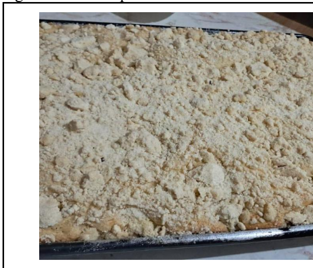
Figura 1 - Cuca rápida da Vó Martha

14 A 16 DE AGOSTO DE 2025 | PORTO ALEGRE - RS