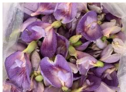
Figura 1 – Pétalas de C. fairchildiana .

O presente trabalho propõe; como ferramenta visual para práticas de Química; o uso das pétalas de C. Fairchildiana para confecção de um indicador ácido-base.