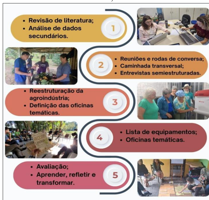
Figura 2- Etapas da Pesquisa-Ação Participante realizadas pelo NAPI Alimento e Território com as comunidades rurais no Litoral do Paraná, Brasil.

Nesse contexto, a apresentação dos resultados está estruturada com base nas ações realizadas nas etapas 3 e 4, equivalente a construção e execução do plano de ação com as comunidades. No entanto, todas as etapas da operacionalização da Pesquisa-Ação Participante desenvolvidas podem ser visualizadas na Figura 2.