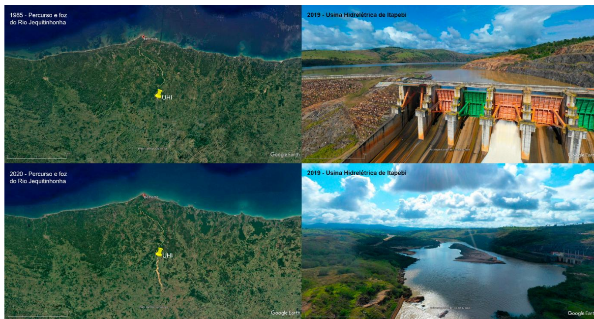
FIGURA 1 – Mudanças espaciais do Rio Jequitinhonha e estrutura da UHE Itapebi.