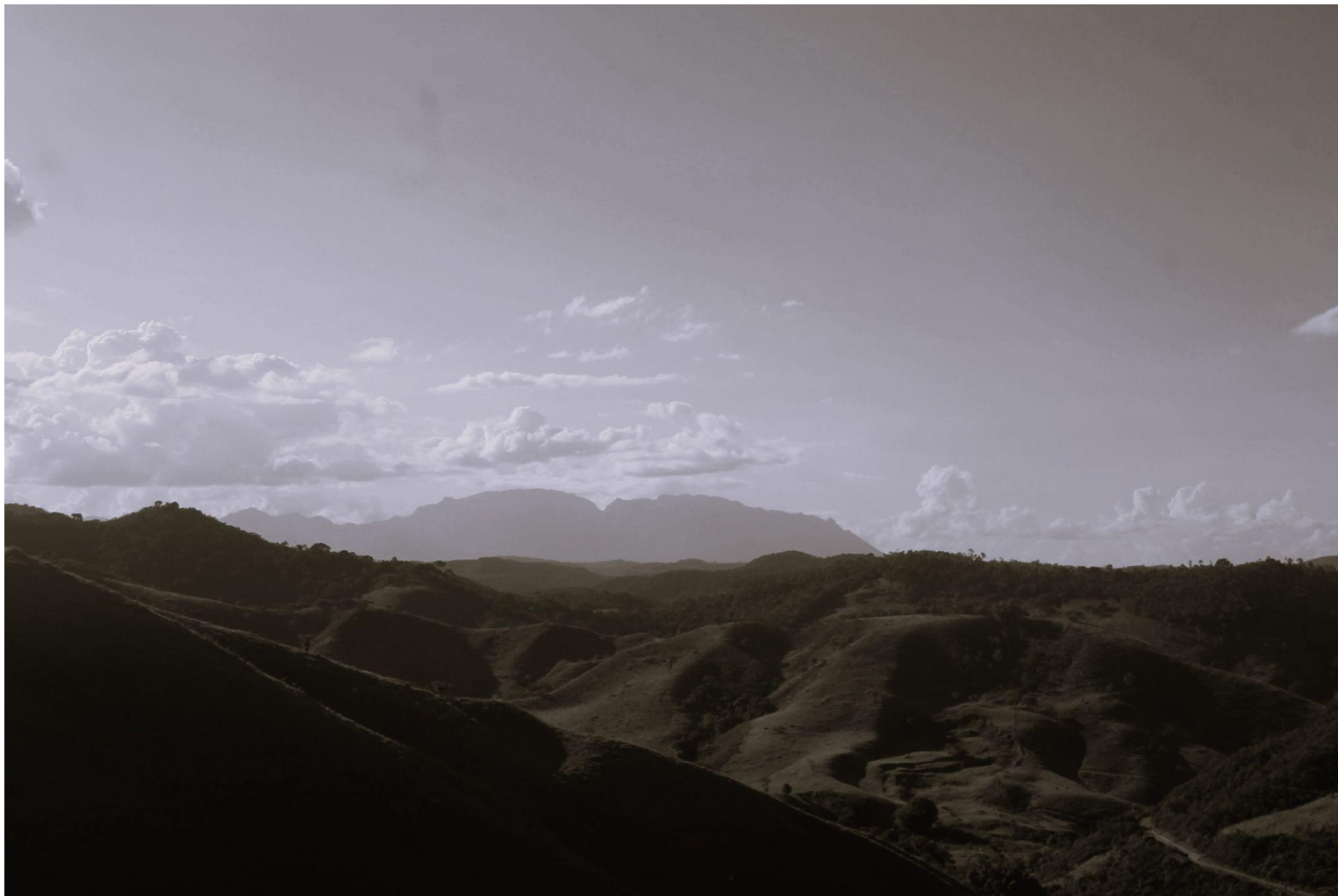
título: mar de montanhas . Mariana (MG)