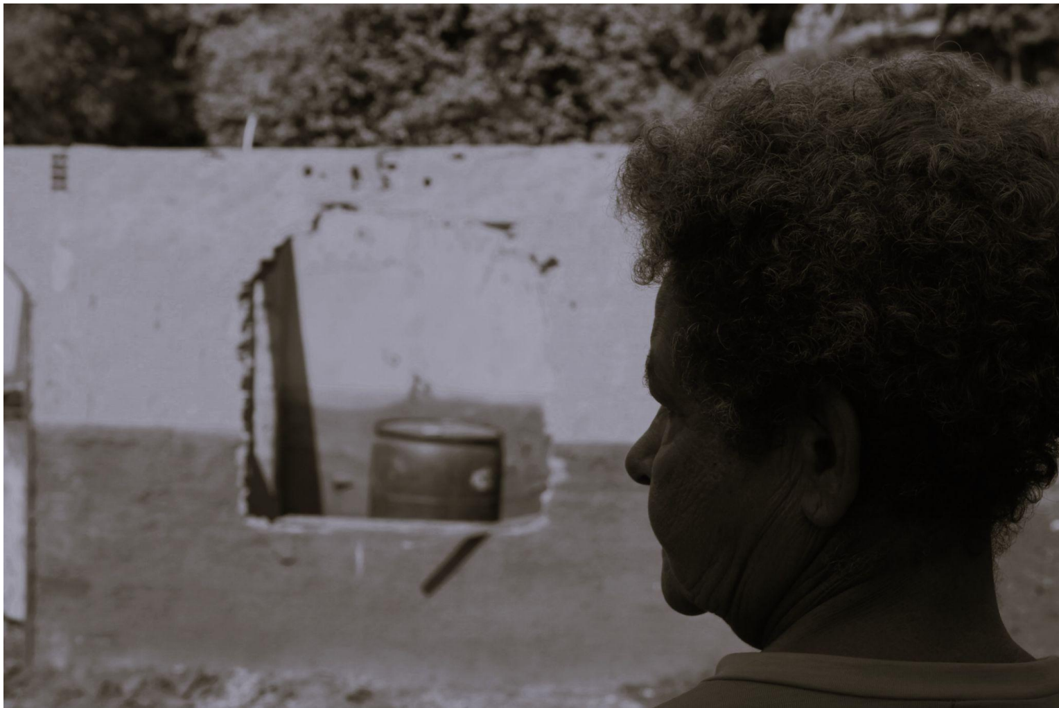
título: casa e lama. Mariana (MG)