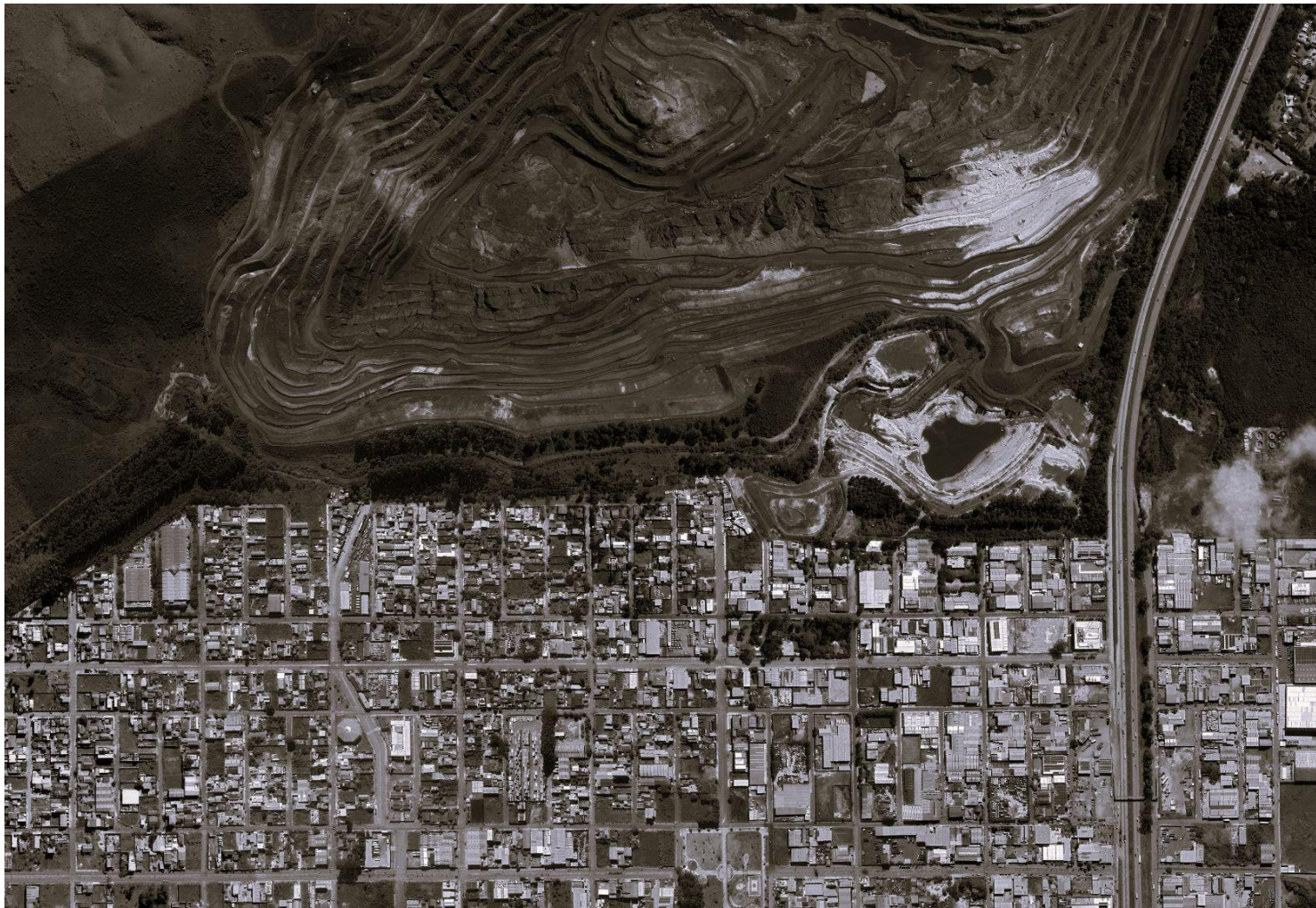
título: casa e ferro. Vista aérea Jardim Canadá - Belo Horizonte (MG)