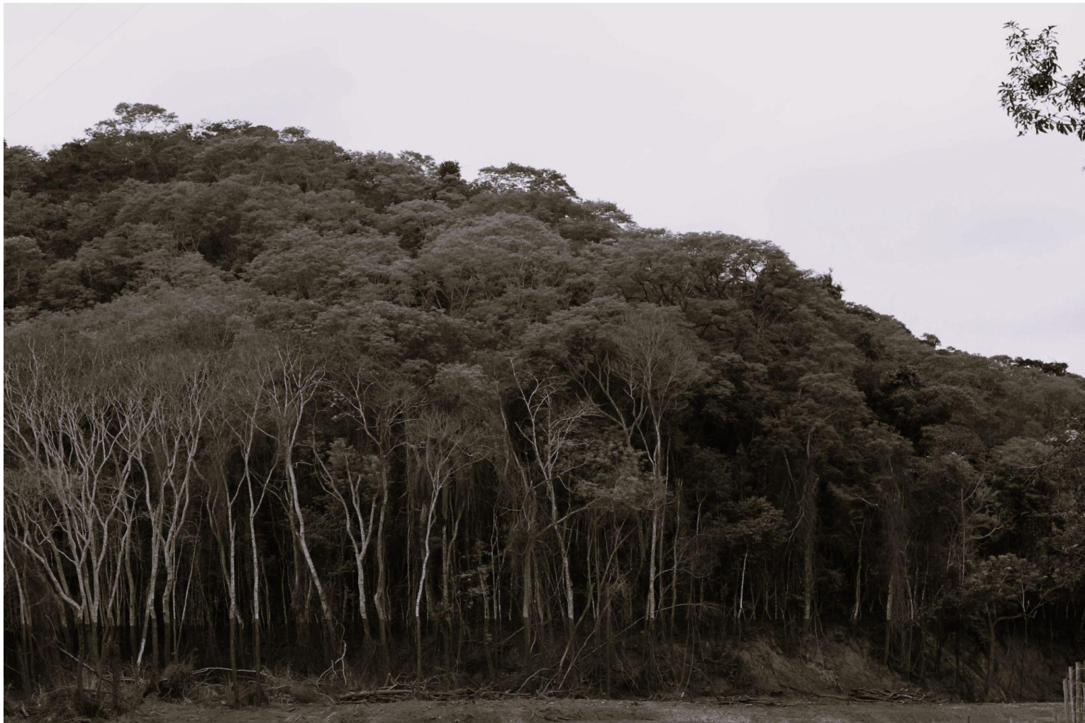
título: mar de lama região atingida pelo desastre da Samarco em Mariana(MG)