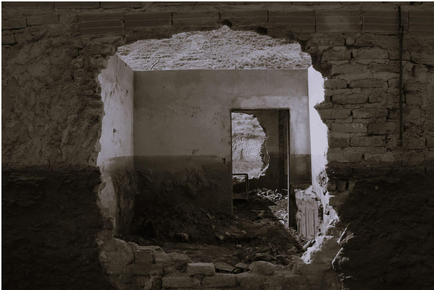
título: ruínas da destruição. casa atingida pelo desastre da Samarco em Mariana (MG)