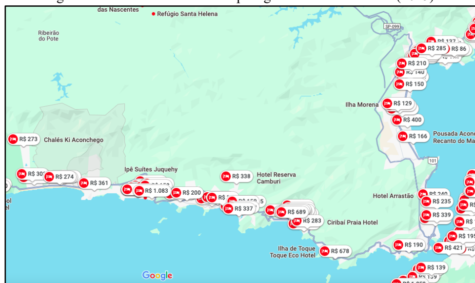
Figura 1 - Oferta de meios de hospedagem em São Sebastião (2025).

No caso dos meios de hospedagem, dados recentes da Secretaria de Turismo do município registram um total de 179 empreendimentos cadastrados entre as tipologias hotéis, pousadas, campings e hostels , distribuídos ao longo das praias de São Sebastião 7 . Como se pode ver na Figura 1, os meios de hospedagem concentram-se em uma estreita faixa da planície litorânea mais próxima ao mar (Figura 1).