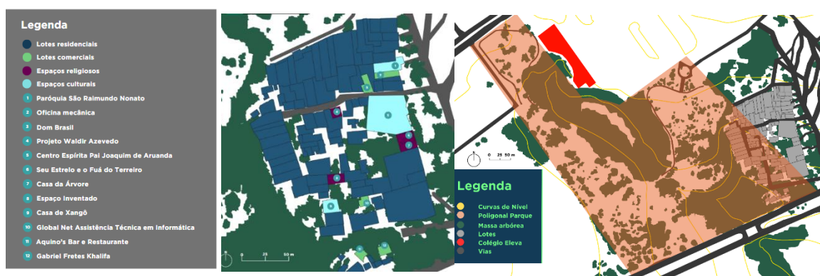
Figuras 1 e 2 – Mapa de usos do solo da Vila e Poligonal do Parque Ecológico da Asa Sul

Ocorre que os moradores têm enfrentado dificuldades para permanecer na região, pois há ameaças constantes de remoção. Segundo os dados do Censo IBGE 2022 6 , cerca de 351 pessoas são habitantes locais e, em 2025, estima-se que o número tenha aumentado. Essa população precede a criação do Parque Ecológico da Asa Sul (criado em 2003) administrado pelo IBRAM, o qual alega que parte do território da Vila ocupa a poligonal da área (Figura 2).