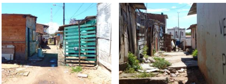
Figura 1 - Moradias precárias

Também conhecida como Vila dos Pescadores, a favela do Jaraguá surgiu como refúgio para trabalhadores rurais e pescadores. A comunidade dependia da pesca artesanal, mas enfrentava precariedade das moradias, falta de infraestrutura e serviços básicos. Desde a década de 1980, o bairro passou por processos de valorização imobiliária e gentrificação, intensificando a pressão pela remoção dos moradores para a construção de um Centro Pesqueiro. Em 2015, a população foi retirada de forma violenta, algumas famílias foram levadas a abrigos provisórios, e outras foram para o Residencial Vila dos Pescadores, oriundo do PMCMV. Embora existisse forte tradição e identidade cultural, por meio da pesca artesanal e das atividades tradicionais realizadas pelos moradores, esse reconhecimento foi rejeitado pelos órgãos competentes. 3