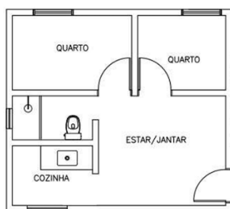
Figura 4 - Planta baixa Res.Vila dos Pescadores

No caso do Residencial Parque da Lagoa, a área de serviço, embora existente, é percebida como insuficiente, uma vez que muitos moradores recorrem à parte externa das moradias para estender roupas. Questões previamente discutidas, como a criação de animais e a adaptação das famílias a residências no formato de apartamento, também permanecem relevantes neste contexto.