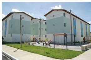
Figura 02 - Residencial em 2012

O Residencial Vila dos Pescadores, localizado a 4 km da antiga comunidade, apresenta sérios problemas urbanísticos, sociais e arquitetônicos. Com 75 prédios de três andares, os apartamentos de 45m 2 possuem limitações, como ausência de área de serviço adequada, cozinhas e banheiros com dimensões insuficientes e ventilação precária na área social, sala de estar e jantar. O entorno sofre com infiltrações, rachaduras e deterioração das fachadas. Moradores improvisam adaptações sem padrão, evidenciando ausência de planejamento. Além disso, a falta de espaços comunitários compromete a organização social e cultural da comunidade, que perdeu práticas tradicionais como a criação de animais e atividades socioculturais desenvolvidas na antiga favela.