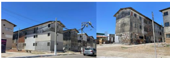
Figura 03 - Residencial Vila dos pescadores em 2024