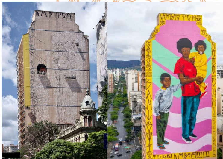
Figura 1. Imagem do Edifício Itamaraty. Foto Revista Projeto. Disponível

em: https://revistaprojeto.com.br/noticias/totens-auxiliam-o-festival-de-arte-urbana-cura-2020-em-belo-horizonte/