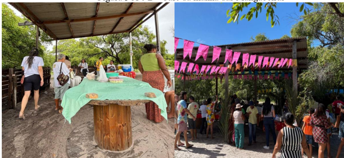
Figura 3 A e B - Café da manhã das Mangabeiras