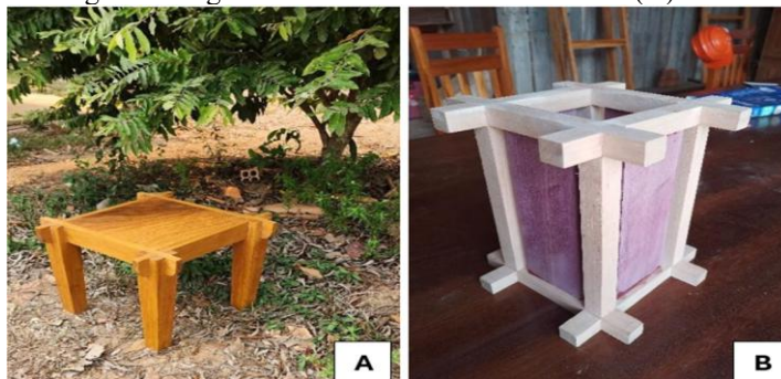
Figura 2: Registro fotográfico da Linha Conexão: mesinha (A) e luminária (B).

Fonte: Acervo da Assessoria, 2024. Produção, 26 e 29/11/2024