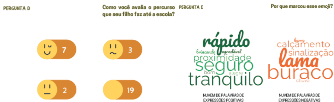
Figura 3 – Painel Síntese de Respostas do Questionário aos Responsáveis e/ou Cuidadores.

Em sua maioria, os responsáveis e/ou cuidadores no universo de 12 respostas, grande parte deles informou que o trajeto casa-escola é considerado bom, rápido e tranquilo pela proximidade da escola com a casa, mas que muitas questões de infraestruturas não colaboram com o trajeto. Com ênfase na falta de sinalização e calçamento; a presença de buracos, lama e barro, em períodos de chuva.