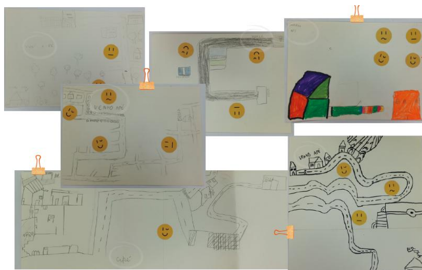
Figura 2 – Painel de Atividades com a manifestação de ir a pé para escola.

da liberdade em utilizar quantas folhas quisesse e no formato que fosse desejado; após a produção, foi fornecido alguns emojis de sentimentos que tem como objetivo qualificar, de modo a pensar no trajeto da casa para escola.