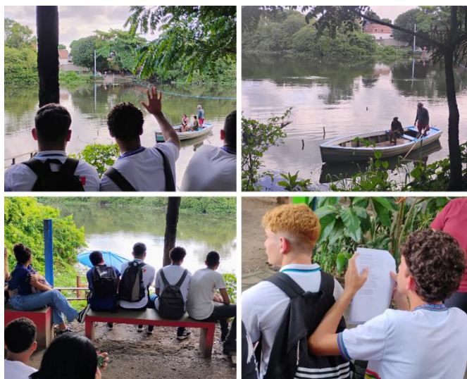
Figura 2- Segundo ponto da oficina

Entre os diálogos às margens do rio Capibaribe, percebemos a forte presença da população negra tirando seu sustento por meio das balsas que atravessam os passageiros de um lado para o outro, cruzando o rio. Ao refletir sobre quem são esses indivíduos que vivem às margens do Rio Capibaribe e trabalham nele, tornou-se notório que eles têm cor – uma cor carregada de história, cultura e resistência.