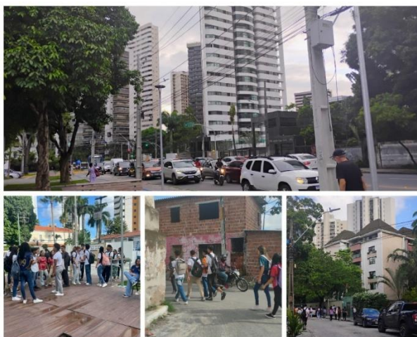
Figura 1- O primeiro ponto da oficina de campo

Conforme Lefebvre [2000], compreendem-se os espaços pelos seus símbolos instalados no território. O valor simbólico ganha significados próprios, o território se apresenta em meio a cada grupo que o ocupa. Isso quer dizer que o espaço é (re)significado perante os grupos sociais. Sendo assim, buscamos dialogar com a oficina aplicada em formato de aula de campo no espaço do Poço da Panela, no bairro de Recife, às margens do rio Capibaribe, já que nosso maior propulsor para refletir sobre a questão central é compreender os símbolos presentes na paisagem do bairro Poço da Panela em Recife. Foi diante dessa percepção que foi possível identificar as desigualdades sociais vivenciadas na paisagem da cidade.