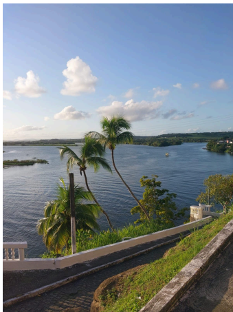
Foto I - Vista de Penedo para o Rio São Francisco