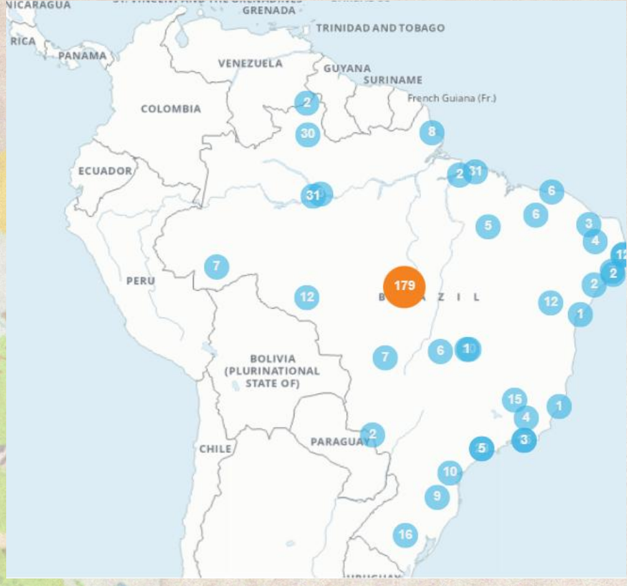
Figura 1 - Ações da ONU para os 17 Objetivos do Desenvolvimento Sustentável, no Brasil.