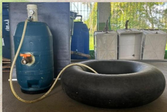
Figura 1 – Biodigestor caseiro construído com materiais acessíveis.

O processo fermentativo foi monitorado por 32 dias. Questionários foram aplicados a peixeiros do Mercado Municipal de Marituba para avaliar a percepção sobre o gerenciamento de resíduos e a receptividade à tecnologia.