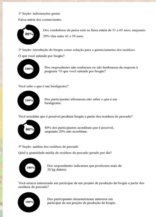
Figura 3 – Balanço da aplicação do questionário semiestruturado.