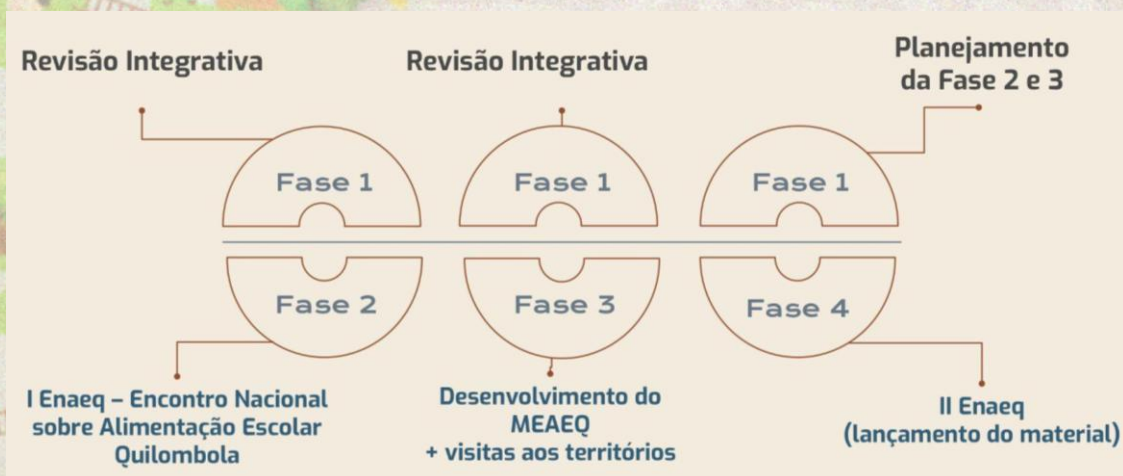
Imagem 1. Representação gráfica do percurso metodológico.

Trata-se de uma pesquisa qualitativa de natureza aplicada, desenvolvida com base em abordagem participativa voltada para o desenvolvimento de uma tecnologia social junto à quilombos de diferentes regiões do país e à atores sociais do Programa Nacional de Alimentação Escolar a partir de 3 etapas: a) revisão de literatura e revisão documental; b) realização de seminário de abertura e rodas de conversa online ; c) rodas de conversas presenciais em comunidades quilombolas.