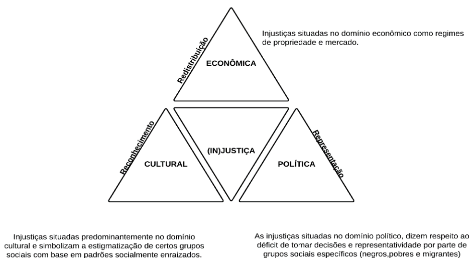
Figura 2. Conceitualização da pirâmide da injustiça

reconhecimento dessa população, expõe esse contingente à mercê de estereótipos grupais que promovem o separatismo (Fraser, 2022). Regulamentos impostos mesmo que tacitamente, regulam as interações das instituições sociais em uma relação perpetuada na estratificação social e desigual. O conceito de Pirâmide do Poder adotada por Fraser (2022), tal como esquematizado na figura 2, corrobora na compreensão dos mecanismos de injustiças sociais aplicadas aos refugiados ambientais.