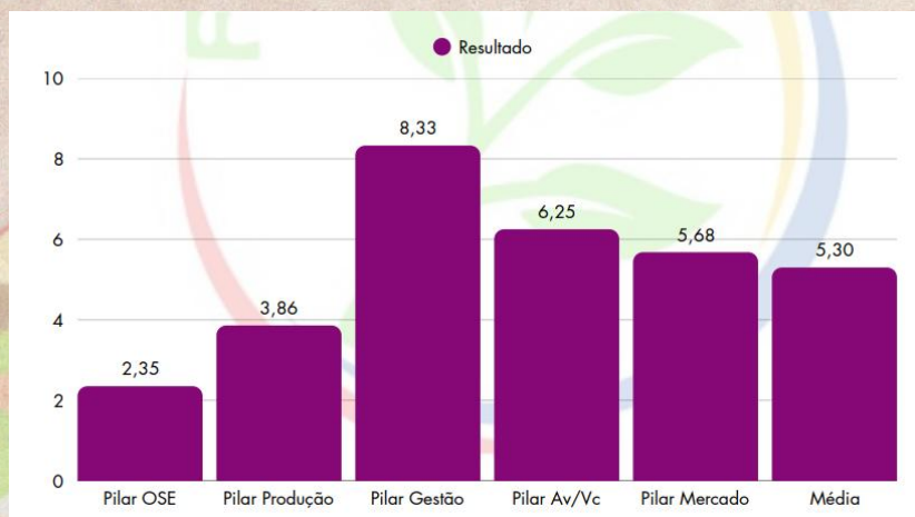
Gráfico 3: Diagnóstico dos 5 Pilares - TURIARTE