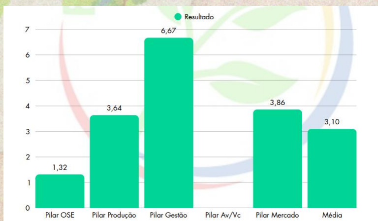
Gráfico 1: Diagnóstico dos 5 Pilares - COOPAFS

O questionário aplicado à COOPAFS apresentou resultados significativos, destacando-se especialmente no Pilar Gestão, com uma média de 6,67, o que indica que os processos administrativos estão alinhados e em conformidade (Gráfico 1). Por outro lado, no Pilar Av/Vc (Verticalização e Agregação de Valor) não houve pontuação, evidenciando uma carência no desenvolvimento desse aspecto e sinalizando a necessidade de melhorar o valor agregado dos produtos e serviços. Nos demais pilares, a COOPAFS obteve uma performance moderada, refletindo que, apesar dos avanços, ainda existem pontos estratégicos a serem fortalecidos para garantir uma estrutura mais sólida e competitiva.