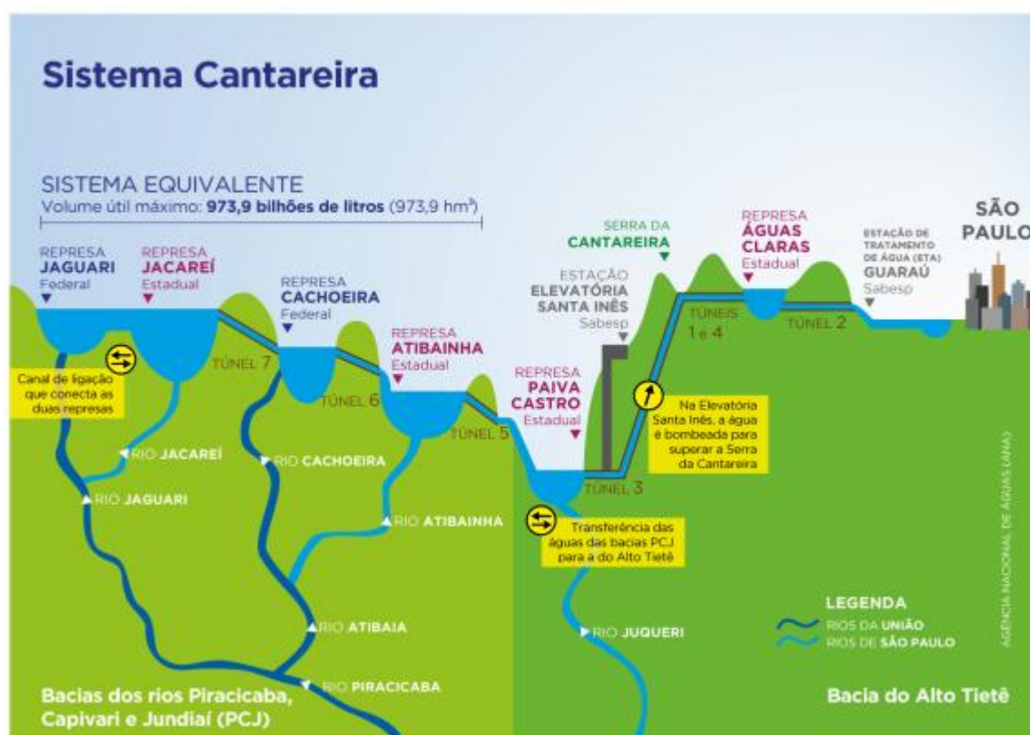
Figura 2 – Funcionamento do Sistema Cantareira

Situação que para a RMSP só não é tão grave pois, através de uma clara relação de teleacoplamento, parte de água para o abastecimento da região é feita por transposição da Bacia do PCJ através do Sistema Cantareira, responsável por cerca de 46% do abastecimento da população da RMSP, e que tem parte importante de sua vazão vinda de bacias inseridas no estado de Minas Gerais (reservatórios Jaguari e Jacareí).