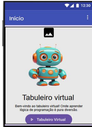
Figura 3 - Aplicativo produzido no MIT App inventor. Autor, 2025

sequenciais mais elaboradas para o robô. Na figura 3 demonstra o App desenvolvido para o projeto.