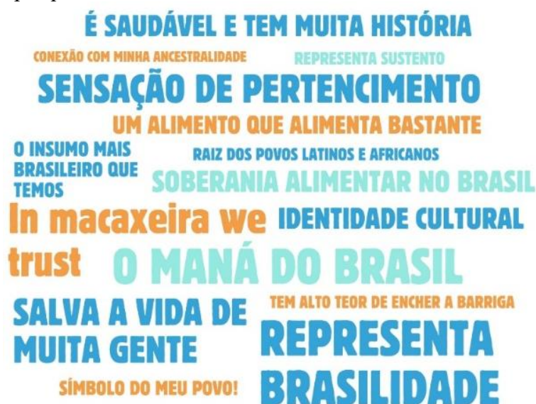
Figura 2 – Nuvem de frases (n=15) selecionadas dos 1215 depoimentos sobre significados da mandioca entre os participantes da pesquisa

14 A 16 DE AGOSTO DE 2025 | PORTO ALEGRE - RS